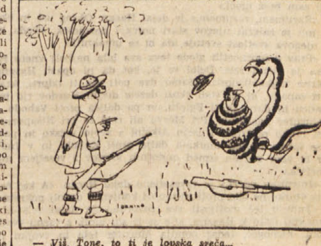
Viš, Tone, to ti je lovčka sreča...

šel oče na osmice sicer z materjo, vendar da sta korakala vsak zase, medtem ko sta se vračala skupaj, ker je imel klubok po strani.