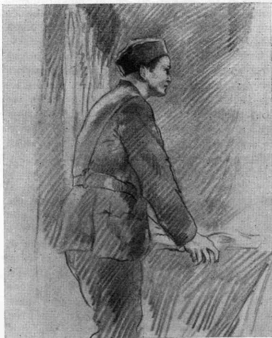
Tov. Boris Kidrič na govorniškem odru

Podoba Kočevskega zbora bi ostala nepopolna, če na kratko ne pregledamo vsaj vseh glavnih dokumentov, ki so zbrani izšli v lepi knjigi »Zbor odposlancev slovenskega naroda v Kočevju« (Ljubljana 1953). Osnovno pozornost vzbujata brez dvoma govora voditeljev NOB slovenskega naroda, tovariša Kidriča in Kardelja. Govor tov. Kidriča je dragocen zlasti po tem, ker podaja kratek in zgoščen historiat NOB na Slovenskem od začetka do Kočevskega zbora. Tov. Kidrič deli našo NOB na določena razdobja in vsako od teh podrobno analizira. Ker je ta govor poročilo IOOF o njegovem dve in pol letnem delu, so v njem ne samo načeti, temveč mestoma tudi do vseh podrobnosti razčlenjeni vsi važnejši problemi NOB. Kot povzetek Kidričevega referata je važna tale njegova ugotovitev: »Aprila 1941 je razpadla vojska. Danes imamo vojsko. Aprila 1941 je razpadel ves naš javni aparat. Danes ga imamo. Toda ne samo, da imamo vojsko in