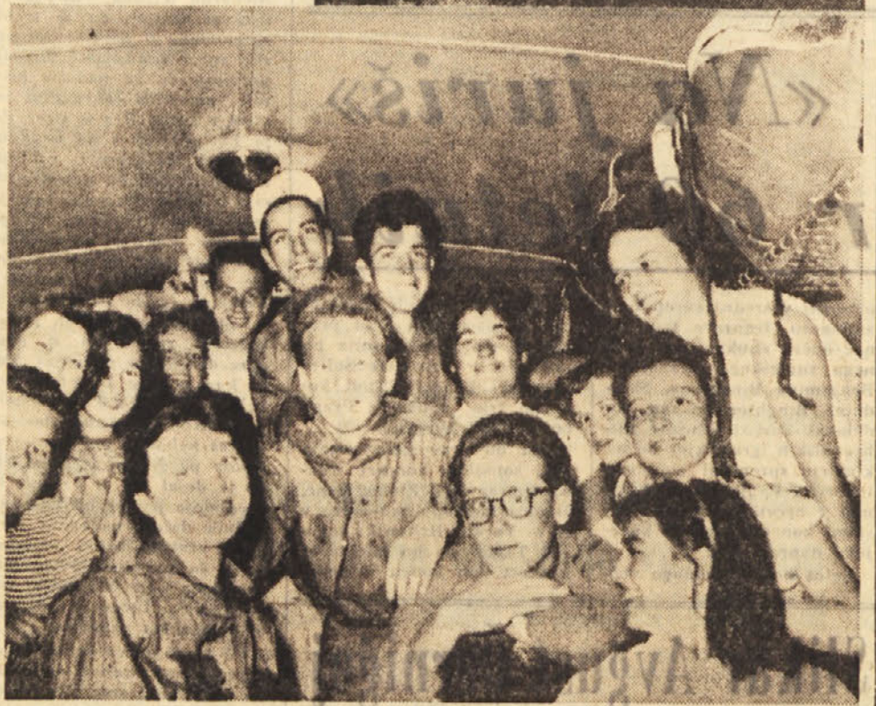
Taborniki rodu »Modrega valca« so se spet poslovili od mestnih ulic ter odšli k Belo-peskim jezerom. Tam se bodo na treditenskem taborjenju v čistem gorskem zraku okrepili ter si v prijetnem razvedrilu, združenem z redom in disciplino, pridobili novih moči za nadaljnje težko delo, ki jih spet čaka po počitnicah.