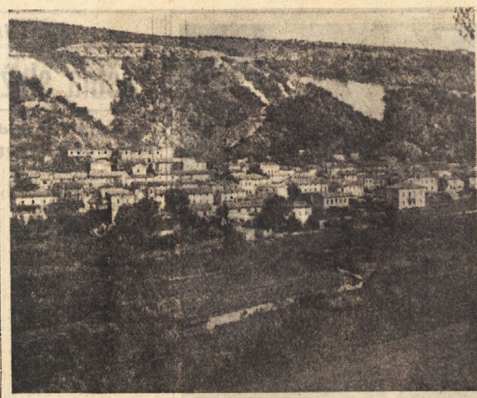
Pogled na Lonjer

Poslednja prireditev pevskega in bralnega društva «Zastava» je bila leta 1923 v Lonjerju na vrtu pri Blaževih. To prireditev so skušali onemogočiti nekateri mišči fašisti, a se jim to ni posrečilo.