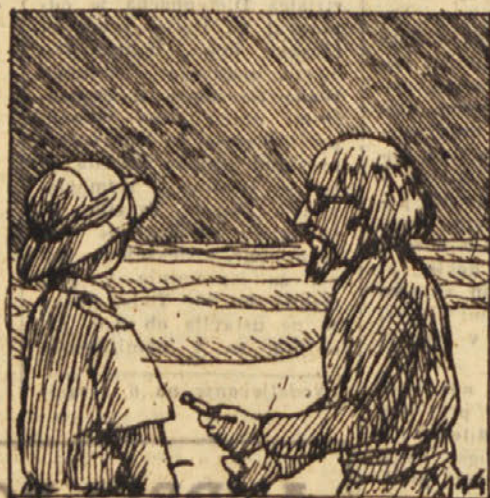
»Jaz se bom tu skrila, da me dr. Grom in Domani ne vidita. Tu imaš posebno pripravljene majhne klešče. Z njimi lahko odtrgaš pecat, ne da bi ti kaj škodoval. Samo glej, da te nihče ne bo opazoval pri delu.