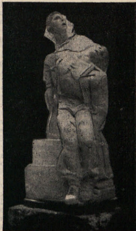
Spomenik v Selah

„Ker so avstrijske oblasti onemogočile naši delegaciji udeležbo pri odkritju spomenika padlim protifašističnim borcem v Selah, vam ob tej priložnosti pošiljamo borbeno pozdrave. Še nadalje dvigajte visoko zastavo narodnoosvobodilne borbe in ostanite zvesti načelom, za katera so dajali svoja življenja najboljši sinovi slovenskega naroda na Koroškem.“