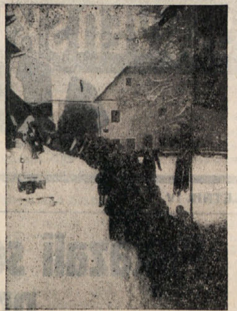
Spreved se pomika proti pokopališču

Naslednji dan, v nedeljo dopoldne je bila svečanost prekopa in odkritja spomenika. Čeprav je bilo jako slabo vreme in je skoraj ves dopoldan snežilo, se je ob tej priložnosti zbrala v Selah ogromna množica našega ljudstva. Dobrih 1500 koroških