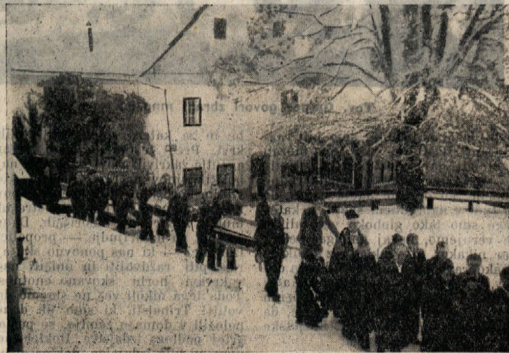
Bivši partizani nosijo v slovenske zastave zavite krste