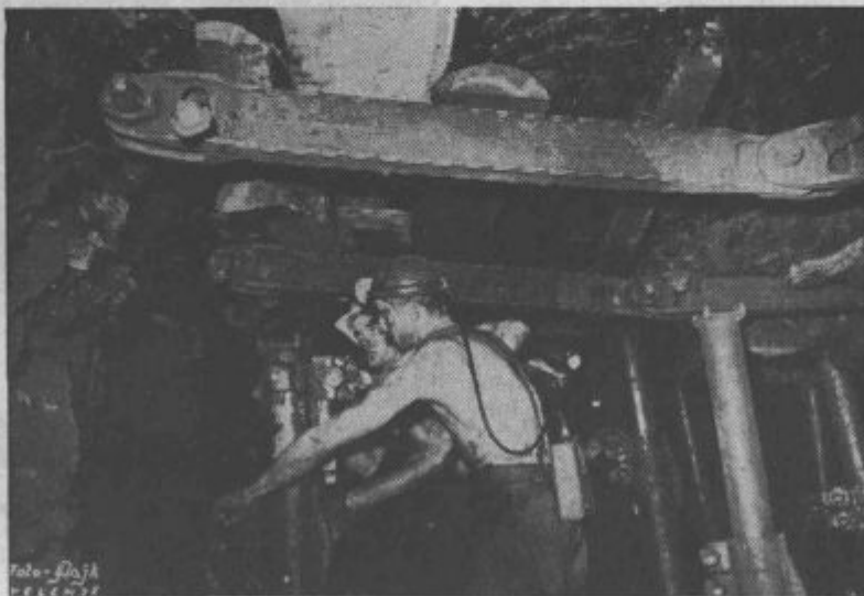
Rudarji pri delu

Da, dragi tovariš, dragi rudar! Precejšen je bil torej delež pri osvoboditvi domovine, ki je končno postala last delovnih ljudi, last skupnosti. Spet si bil med prvimi,