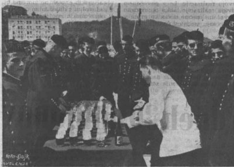
Tradicionalni ceremonial pri skoku čez kožo