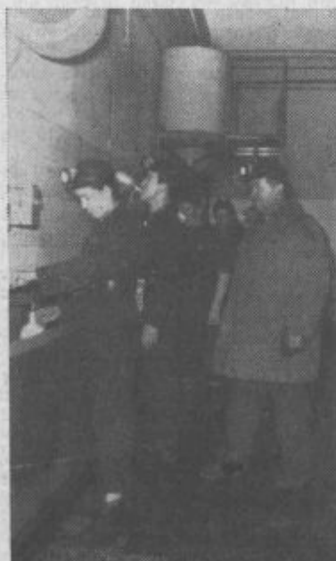
Rudarji polnijo čutarice

Velenjski rudnik ni več tisti stari rudnik, v katerem so pustili žalostne sledove in spomine tuji kapitalisti. Prav tako ni več tisti rudnik, katerega prvi organi delavskega samoupravljanja so na prvem koraku naleteli na nešteto nepremagljivih težav in problemov. Ni pa več tisti rudnik tudi zato, ker so se njegovi proizvajalci, upravitelji, spoprijeli z vsemi težavami in problemi in jih tudi premagali. Prizadevali so si, da bi si delo v jami čim bolj olajšali in da bi delali varno. Borili so se ne samo za uvajanje novih strojev in proti pomanjkanju zaščitnih sredstev, temveč tudi proti zastalemu pojmovanju delavcev. Premagati je bilo treba oboje. Naš rudar je storil vse in uspehi to nazorno dokazujejo. Novi obrati, rekonstrukcija in modernizacija starih, čedalje številnejša in sodobnejša sredstva za mehanizacijo, bolj in bolj izpopolnje-