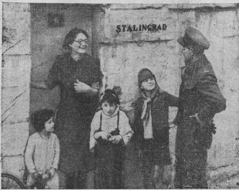
Neko kamnito zaklonišče na Malli, ki je bilo največkrat na svetu bombardirano iz zraka, nosi ime "Stalingrad." S tem so dali malteški junaki priznanje drugim junakom — junakom Stalingrada.