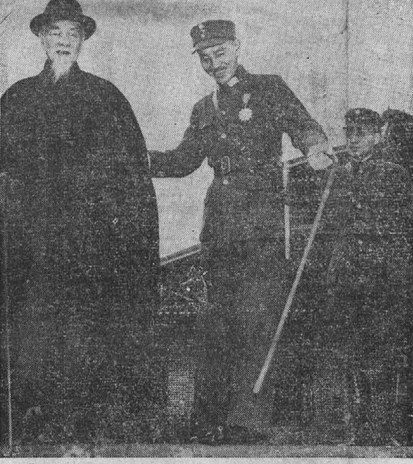
Castiljni mož z brado je predsednik kitajske republike Lin Sen, poleg njega pa sta generalissimo Ciangkašek in general Čang Ču-Čung.