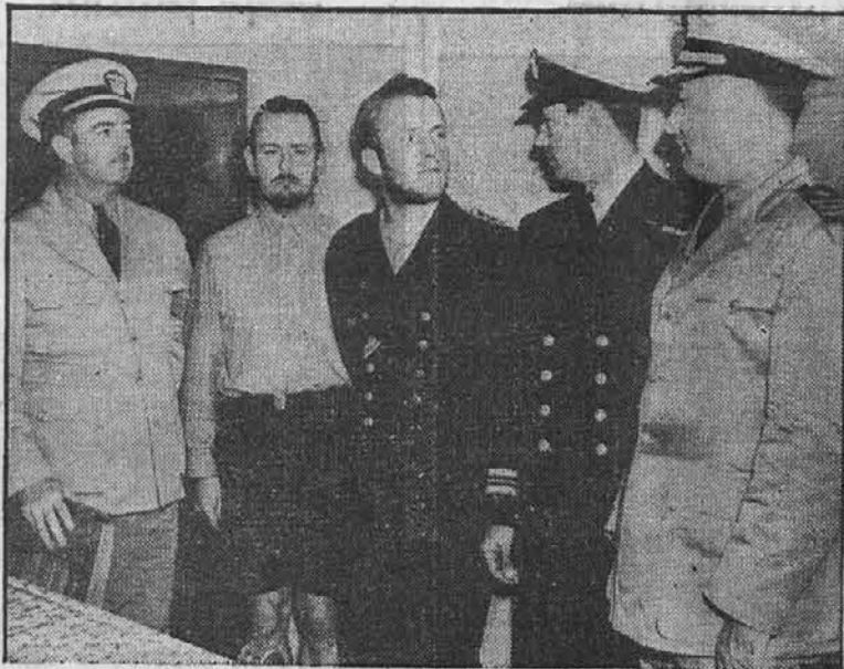
Na sliki so častniki ameriške obrežne stražne ladje Icarus, ki je nedavno pogreznila neko nemško podmornico. Srednji bradati mož na sliki je bil poveljnik podmornice, poleg njega pa stoji eden izmed njegovega moštva.