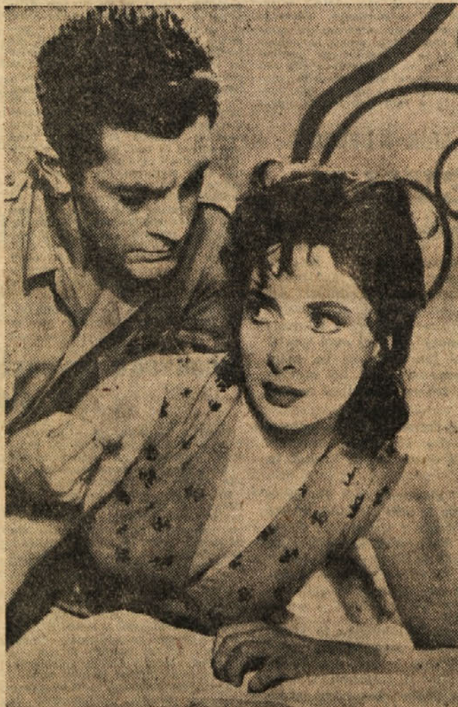
Očarljiva Gina Lollobrigida ugaja tisočem...

V Salzburgu je nekdo vdrl v tamkajšnjo papirnico. Tamkaj je vzel nekaj denarja in pisalni stroj, zraven tega pa samo sliko Marilyn Monroe... Lepšega poklona lepa Marilyn Monroe pač ni mogla doživeti!