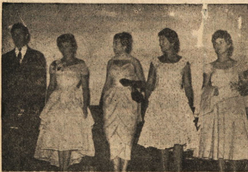
Mladost, uglajenost in eleganca...

Ko so nedavno izročili namenu novo poslopje revije "Look" v ZDA, so v veliki dvorani vzdali tudi dvojice cestovnih kovinskih skatel, v katerih bodo shranili napovedi nekaterih ameriških industrijskih in drugih strokovnjakov o življenju na naši zemlji čez 30 let. Skatlo bodo namreč odprli v januarju leta 1989!