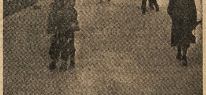
S NEGOM PRIDE TUDI VESELJE