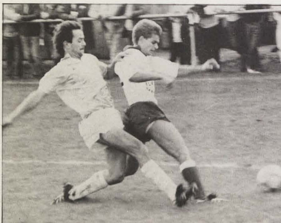
Gostje so bili v obrambi močni, Bilčovščani pa so kljub temu dvakrat zadeli.

Sicer pa je v spodnji ligi-vzhod ostalo vse pri starem: Dobrla vas je tokrat zgubila z Vetrinjem.