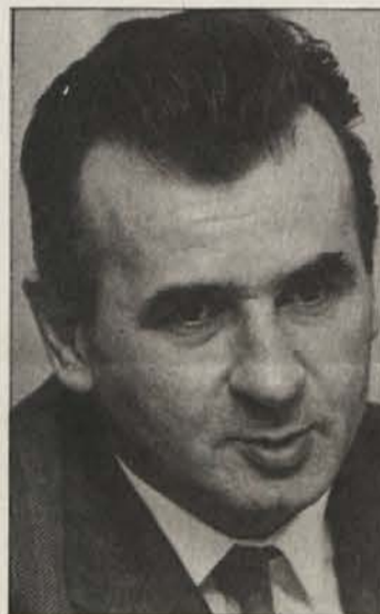
Predsednik Miran Potrč