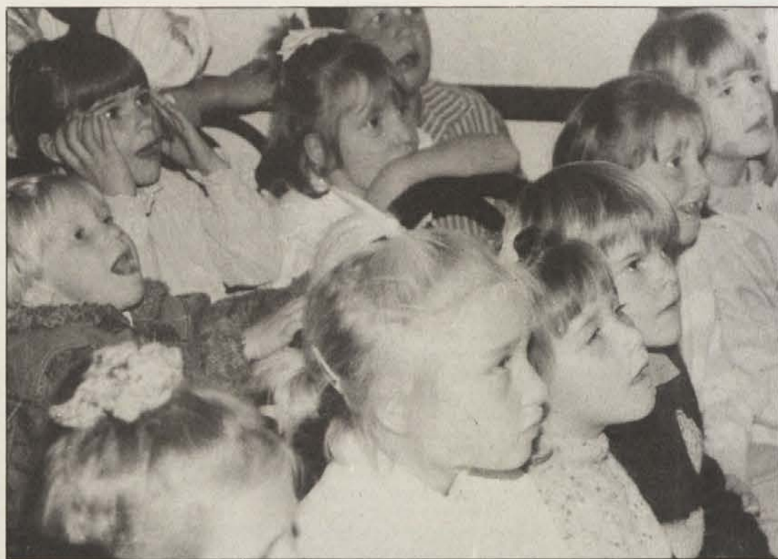
Otroci niso bili le hvaležni poslušalci, ampak so pri igri tudi sodelovali z vprašanji in odgovori