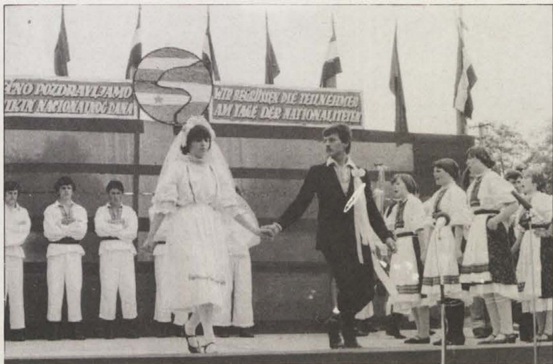
V Porabju vsako leto prireajo „Narodnostni dan“, na katerem se srečujejo pripadniki raznih narodnostnih skupnosti.