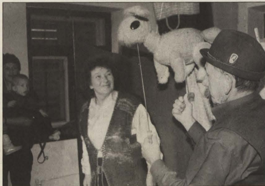
Važno vlogo je imel tudi kuža, ki sta ga med otroke privedla spretna lutkarja iz Ljubljane

HEUTE SLOVENSKI IM Die Seite VESTNIK für unsere deutschsprachigen Leser/innen