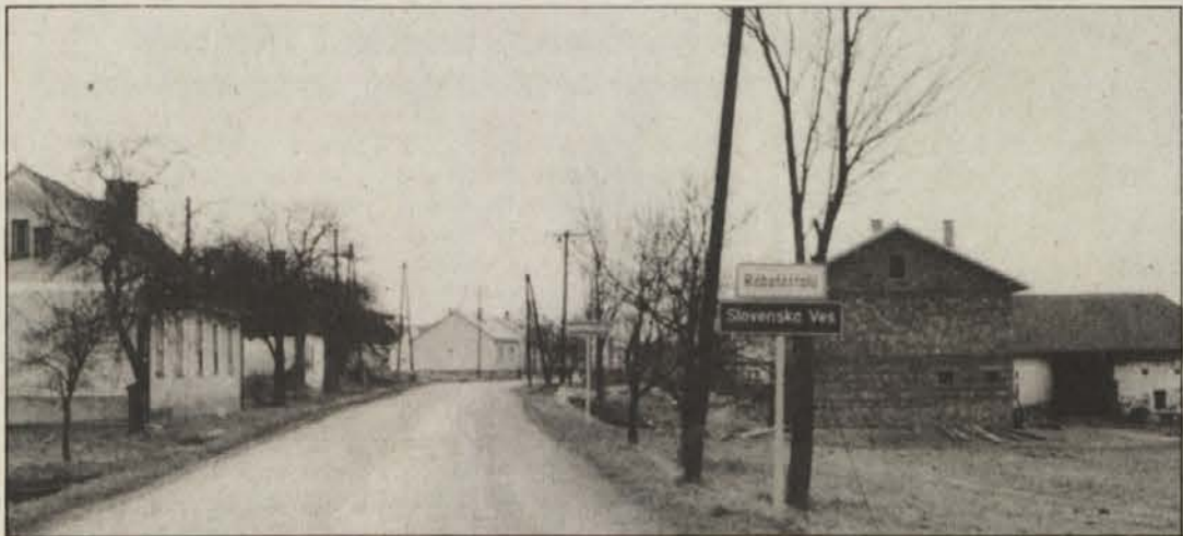
Slovenska ves, del mesta Monošter (Szentgothard), v katerem bo imelo svoj sedež novo samostojno društvo porabskih Slovencev.

Slovenski inštitut za preučevanje prostora Alpe-Jadran