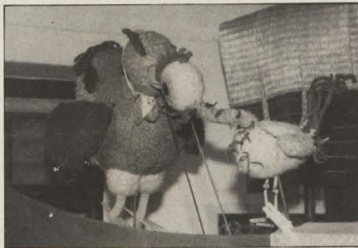
Veliki Kikiriki v pogovoru s svojo mamo Kokodajso

nu“, vedno znova potrjuje, da take prireditve v Celovcu potrebujemo. Žal nekateri še vedno ne uvidijo (ali pa nočejo), da živi v Celovcu tudi mnogo slovenskih ali dvojezičnih družin, ki čutijo potrebo po kulturni hrani zase in svoje malčke.