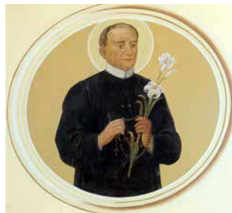
Podoba sv. Klemenca Marije Dvoržaka v ladijski kupoli ž. c. sv. Janeza Krstnika v Hotedršici