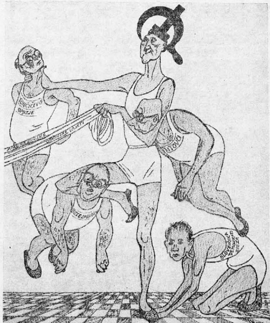
TAKO SO NAS HOTELI P RESLEPITI V NABREŽINI

VSI NA VOLIŠČA, VSI VOLIMO »SLOVENSKO LISTO«!