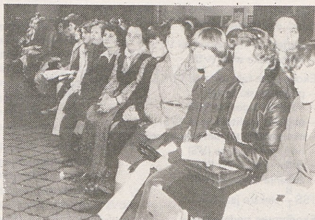
Sodelavke so z zanimanjem prisluhnile sporedu iz "domaćih logov"