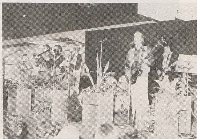
Člani ansambla "Veseli perivjeki" so se predstavili tudi kot igralci