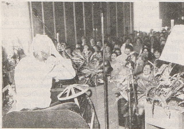
Navdušili so tudi člani ŠIK