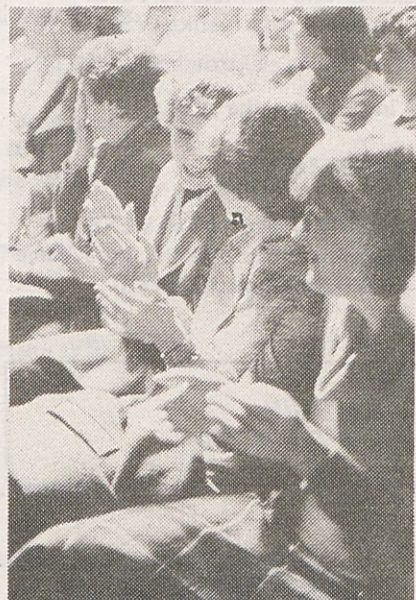
Spored je bil pester, zato je resnično razvedril vse prisotne