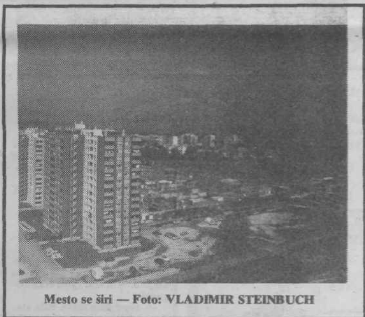
Mesto se širi