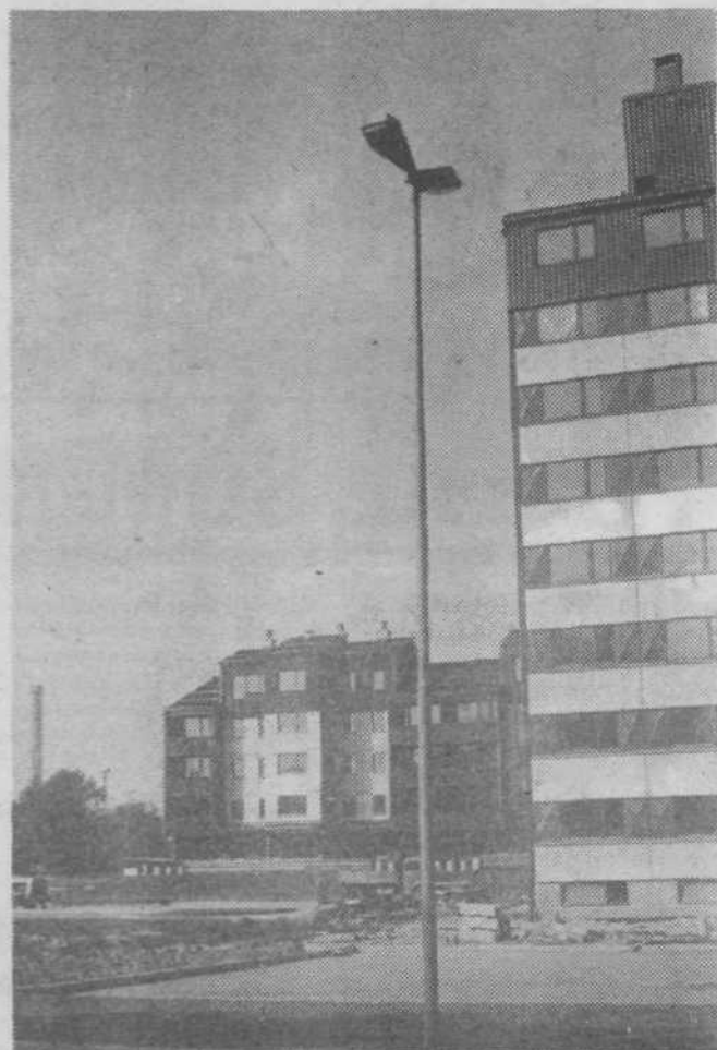
V soseski Nove Fužine gradimo 1237 stanovanj — AM