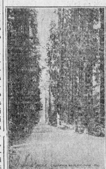
Redwood Park, California

Zarki jutranjega solnca so že pregnali polumrak iz pragozda in po vejah se je lesketala rosa kot biseri, ko se je Milo zbudil. Začuden je nekaj časa zrl ogromna, nekakemu smrečju podobna drevesa, katerih debela so bila ravna kot sveče in katerim skoro ni mogel doledati do vrha. Oče je bil medtem že skuhal kavo in oevrl slanino za zajutrak. Naslonjen na deblo redwood drevesa, katerega ne bi deset mož obseglo, je Milan po zajutruku začel pripovedovati svoje sanje: