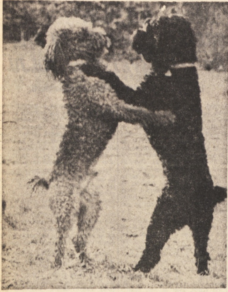
«Crno-bela reduta»

Sicer zelo potrebna, žal pa dokaj površna publikacija