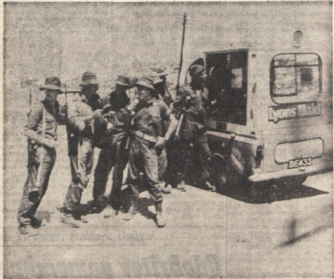
Britanski vojaki v sklopu mirovniških sil OZN bodo v prihodnjih dneh zasedli položaje med turško vojsko in ciprsko narodno gardo, da bi preprečili morebitne kršitve premirja. Zbor mirovniških sil OZN na otoku se bo v kratkem okrepil s približno 1.000 švedskimi in danskimi vojniki

RIM, 31. — Izvršni odbori časni-karske bolniške blagajne INPGI vsedravnega združenja italijanskega tiska in časniškega združenja so se danes sestali na skupni seji, na kateri so proučili pobude za za-ščito avtonomije bolniške blagajne italijanskih časnikarjev v zvezi z zakonskim odlokom o odpravi deficita bolniških blagajin in v pričakovanju zdravstvene reforme. Na seji so pozitivno ocenili dosedanje sporazume z ministrom za zdravstvo