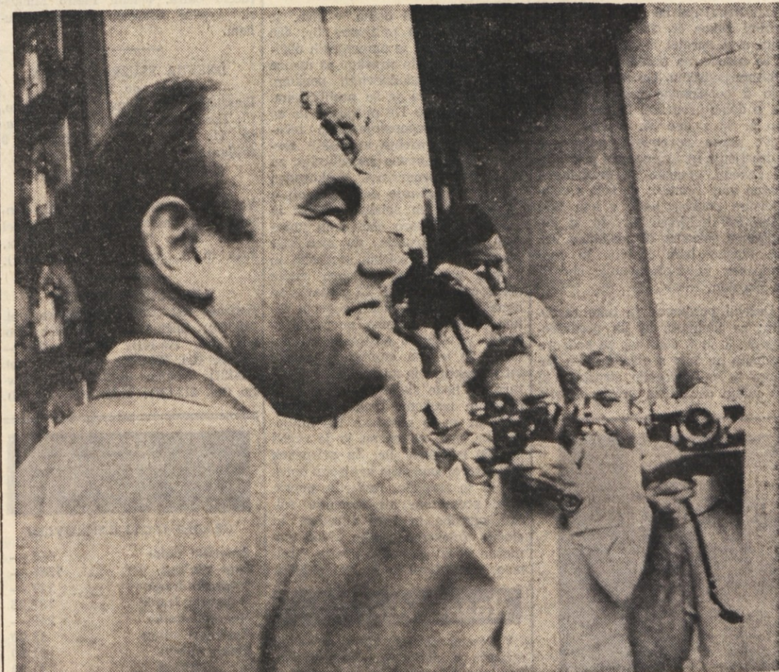
John Ehrlichman, bivši glavni svetovalec v Beli hiši, je bil obsojen na zaporno kazen od 20 mesecev do pet let ječe, kot vodja vohunov Bele hiše