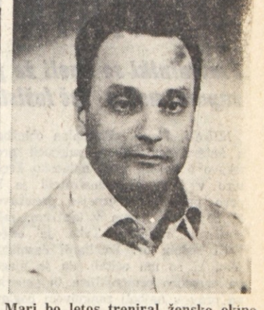
Mari bo letos treniral žensko ekipo Darwil, ki nastopa v B ligi

Kaj pa o ženski tržaški košarki? «Ženska tržaška košarka je v dokaj klavrnem položaju. Predvsem primanjkuje trenerjev in tudi voditeljev, ki bi znali uvesti v društva