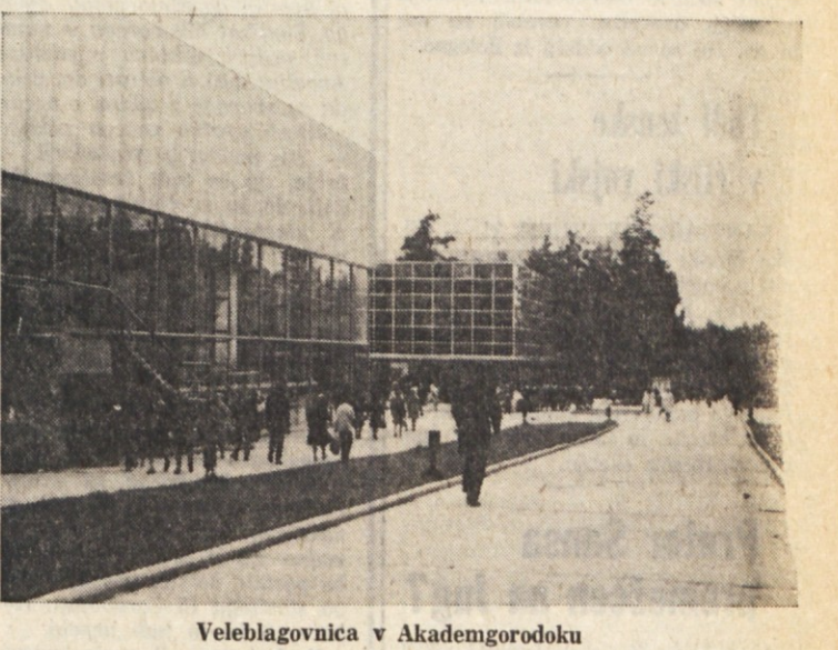
Veleblagovnica v Akademgorodoku

Nekajminutni sprehod po prospektu Morskoi skozi borov gozd do rekreacijskega prostora ob Obskem jezeru nam je bil po obilnem kosilu več kot dobrodošel. Spotoma smo se potikali po podratku tajge, veselili se živahnosti nabrlih vevec in iskali gobe. Gob v tajgi niti ni treba iskati, toliko jih je na vsakem koraku. In Rusi se jih, kot kaviarja in vodke, v obilni meri poslužujejo. Komaj nam je pogled zaobelj prostornost Širnega Obskega jezera in dolgo peščeno plažo, ki so jo ustvarili z nad dva milijona kubnih metrov pripeljanege belega peska. Plaža je bila prazna. V poznih avgustovskih dneh in ob nestanovitnem vremenu so se vrhovi brez že lahko nadedli z rumenilom in s