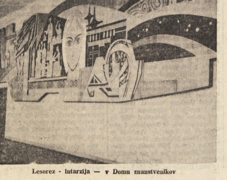
Lesorez - intarzija - v Domu znanstvenikov

so tudi redni obiskovalci koncertov in gledaliških predstav v čudoviti novosibirski Operi in v drugih gledališčih, kamor je le dobre pol ure z avtobusom, z avtomobilom niti toliko ne. Presenečenja v Akademgorodoku so vsepovsod. Mestece je razdeljeno na več okolišev, ki pa so za asfaltnimi potmi skozi parke in gozdiče tesno povezani, čeprav so si med seboj nevidni. Zolotaja dolina (zlata dolina) je območje vil, kjer stanujejo izredno zaslužni znanstveniki. Nikakršne ruske dače, kot bi človek pričakoval, ampak samo najmoderneje vile z najsoodobnejšim komfortom. Socialistična družba jih je kar najbolje oskrbela z udobnim zasebnim življenjem v eno ali dvostanovanjskih vlah z ogrevanjem na nafto, toplo vodo, elektri-