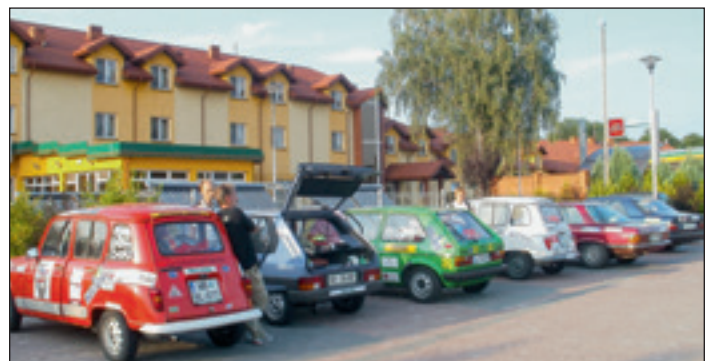
Naši »prijatelj« pred prenočiščem (za 10 EUR)

Pred zasluženim počitkom smo že mislili na prehod oziroma izstop iz Evrope, ki je bil pred nami.