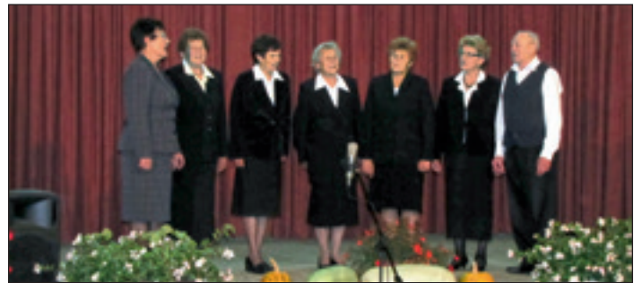
Z nastopa v Obrežu