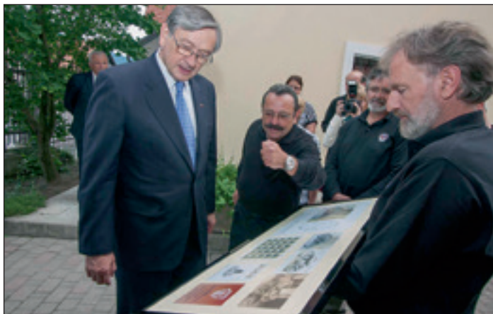
Predstavitve naših prizadevanj dr. Danilu Türku

in Republike Slovenije. Kot ustanovitelj in vodja projekta Moskva Tour sem bil gost na številnih prireditvah na najvišjem nivoju. Kot podpredsednik slovenske veteranske avto-moto zveze sem se imel priložnost pogovarjati na to temo s predsednikom države dr. Danilom Türkom. No, zmeraj smo ob koncu pogovorov prišli do zaključka, da je projekt odlična promocija za našo državo. Je pa res, da pa iz teh poznanstev in podpore premalo vemo iztržiti na gospodarskem področju. Osebnostno upam, da se bo ta naša kratkovidnost spremenila in da bomo v prihodnje vedeli izkoristiti ponujene nam priložnosti.