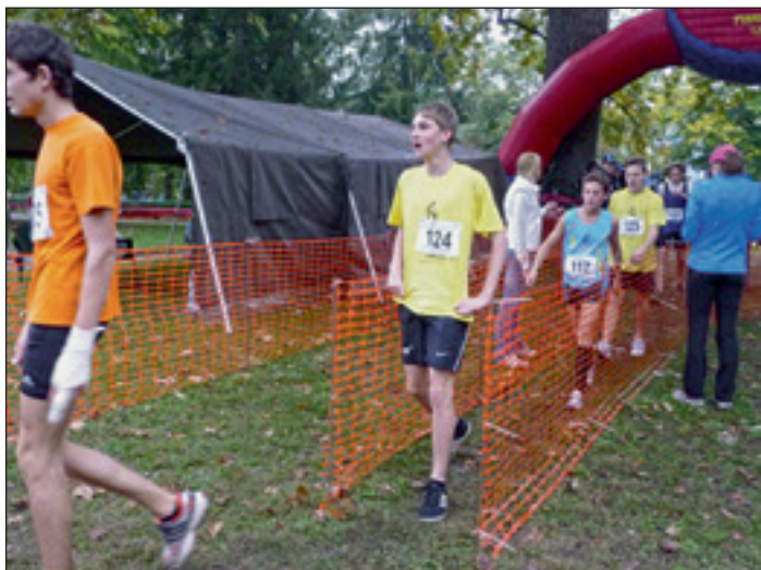
Prihod na cilj – na odličnem sedmem mestu.