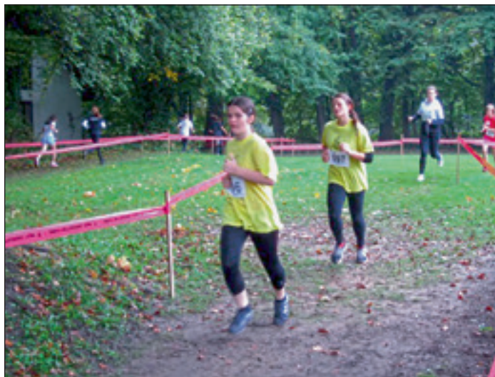
Proga je bila dobro pripravljena in je kljub slabemu vremenu zdržala.