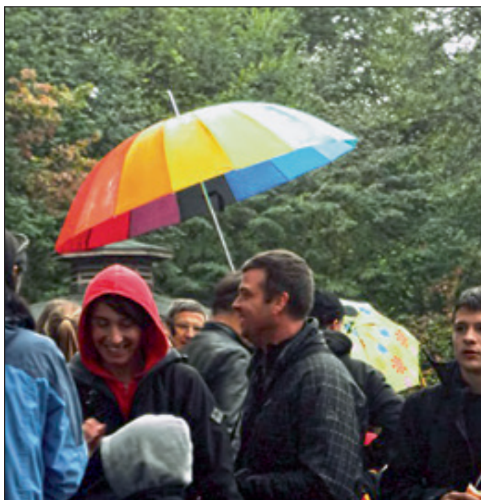
Sonce ni niti enkrat posijalo, pa smo kljub temu videli mavrico.