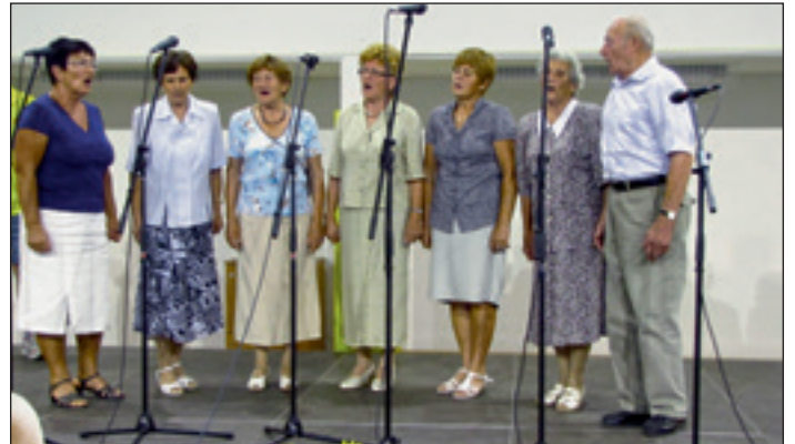
Naš nastop 17. avgusta na Kogu (Javna radijska oddaja radia Prlek)

In ne pozabite: naslednje leto ob istem času na veselo snidenje!