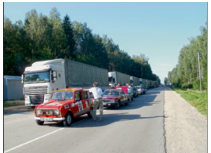
Na schengenski meji

Pot je potekala dokaj normalno, čeprav je bila prva etapa nenormalno dolga. Letos nam je spet malo zagodla Budimpešta, saj se zaradi ogromnih delovišč zmeraj prebijemo na drugi konec mesta. Seveda po drugi poti. Ta izgubljeni čas v Budimpešti smo pridobili na hrvaško-madžarski meji, saj smo za razliko od prejšnjih let, brez problema in brez kontrole dokumentov zapeljali nazaj v evropski prostor. Seveda so nas spremljali nejeverni posmehi madžarskih mejnih organov spremljani z besedami: »Moskva, Moskva...« Po nabavi vinjet (ki jih še vedno prodajajo na nasprotni strani avtoceste) smo začeli premagovati kilometre, ki so na avtocesti za naša vozila zelo dolgočasni in zelo utrujajoči. Vremenske razmere so bile