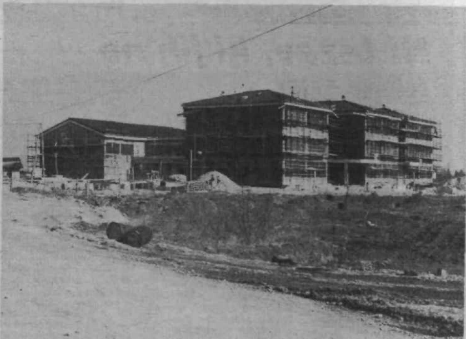
ŠE ENA ŠOLA IZ SAMOPRISPEVKA - Vzgojni zavod Janeza Levca se bo jeseni preselil v nove prostore za Bežigradom. Predvidevajo, da bo gradnja končana že junija, v začetku julija pa bo tehnični prevzem. V napovedih se verjetno niso zmotili, kar dokazuje tudi zunanji videz zgradbe.