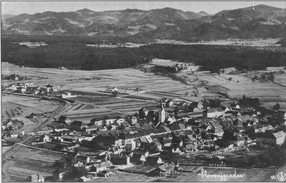
Mislinjska dolina s Slovenj Gradcem.

V tem okraju je obstajala kar močna opozicija SLS, vendar so imeli tudi liberalno-unitarni privrženci šestojanuarske deklaracije in s tem unitarizma in centralizma močne postojanke. Privržence so imeli predvsem v državnem Sokolu kraljevine Jugoslavije, Zvezi kulturnih društev (ZKD) in v sindikalni organizaciji Narodni strokovni zvezi.