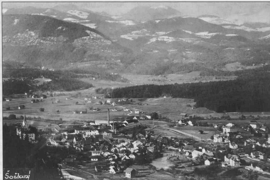
Šaleška dolina s Šoštanjem.

leta 1937 petnajst občin in sicer Mislinjo, Pameče, Podgorje, Razbor, Slovenj Gradec, Št. Andraž pri Velenju, Št. Ilj pri Velenju, Št. Janž na Vinski gori, Škale, Stari trg pri Slovenj Gradcu, Šmartno pri Slovenj Gradcu, Šoštanj-mesto, Šoštanj-okolica, Topolšica in Velenje. 2 S komasacijo nekaterih občin v naslednjih letih pa jih je leta 1939 ostalo še trinajst. Odpadla je občina Stari trg pri Slovenj Gradcu, ki so jo priključili slovenjgraški občini, poleg tega sta se 1937 združili obe šoštanjski občini. Leta 1939 je okraj meril 484,27 km 2 in je imel 28.800 prebivalcev, od tega 14.112 moških in 14.688 žensk. Po površini je bila tedaj Mislinja največja občina s 103,49 km 2 , med manjše pa so spadale Št. Janž na Vinski gori z 20,49 km 2 , Št. Andraž pri Velenju s 17,41 km 2 , najmanjša je bila občina Št. Ilj pri Velenju, bsegala je le 9,82 km 2 . 3 Nad 4.000 prebivalci sta imeli mesti Slovenj Gradec in Šoštanj, tri in pol tisoč trg Velenje, nekaj več pa Mislinja. 4 Območje okraja se razprostira po Mislinjski in Šaleški dolini. Po odločbi Ministrstva za trgovino in industrijo z dne 22. decembra 1936 je sodil Slovenj Gradec med turistična mesta v Dravski banovini. 5