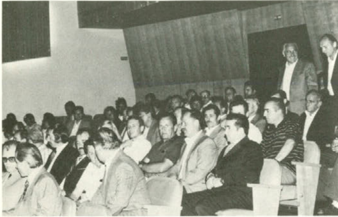
Udeleženci slavnostne seje delavskega sveta naše sestavljene organizacije so se zbrali za začetek seje.

V drugem delu svečane seje delavskega sveta naše sestavljene organizacije je 49 delavcev in upokojencev iz Rudnika lignita Velenje prejelo odlikovanja predsedstva Socialistične federativne republike Jugoslavije: