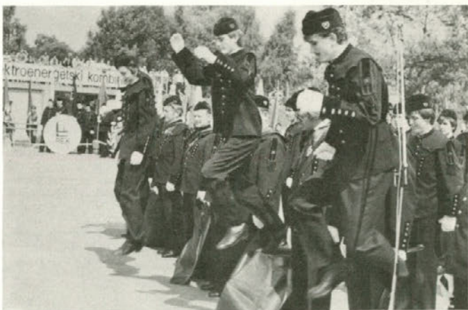
s 'skokom čez kožo' in, kot običajno,...