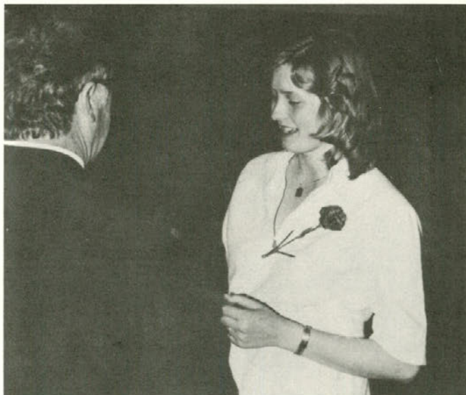
Prizor s slovesnega sprejemanja delavk in delavcev iz našega kombinata 2. julija v zvezo komunistov

Po pozdravih je zbrani množici gledalcev iz vseh delov naše občine pa tudi od drugod spregovoril o prizadevanjih in uspehih delavcev v našem kombinatu na področju izpolnjevanja proizvodnih nalog, uresničevanja politike ekonomske stabilizacije in razvoja samoupravnih socialističnih odnosov. Pri tem pa nas ni samo hvalil; zlasti ko je govoril o tem, kako se obnašamo pri nadaljnjem razvijanju dohodkovnih odnosov in svobodne menjave dela. Dejal je, da se še vedno prepogosto in že predolgo ukvarjamo z govorjenjem, kaj bi bilo treba spremeniti v našem kombinatu in v slovenskem elektrogospodarstvu, namesto da bi ukrepali. Še vedno se ne zavedamo - je dejal - da bomo do boljših rezultatov prišli šele takrat, ko bomo delo in uspehe