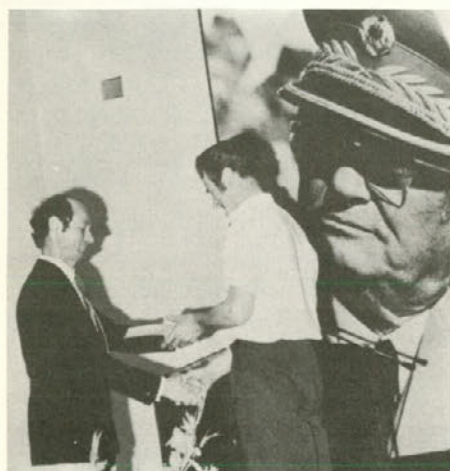
Dva prizora s podeljevanja odlikovanj predsedstva SFRJ delavcem in upokojencem iz RLV...