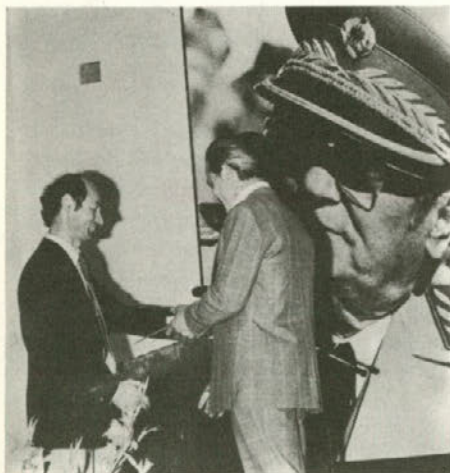
na slavnostni seji delavskega sveta naše sestavljene organizacije letos ob 3. juliju

Vsebina ● (Stran 2) Program ukrepov za uspešno nadaljnje poslovanje naše sestavljene organizacije v letu 1981 ● (Stran 4) Društvo energetikov Šoštanj je proslavilo svojo 25-letnico ● (Stran 6) Drugi zbor racionalizatorjev ESO ● (Strani 6-20) S prirediteljem ob našem letošnjem 3. juliju - Iz delovne organizacije "Plastika"-Trebliško vas zopet vabi - Naša delovna organizacija "Tiskarna" ponovno razpisuje ● (Stran 21) Nadaljnjih 77 novih stanovanj za delavce iz našega kombinata ● (Stran 22) Z nekega neuspešnega razgovora v naši sestavljeni organizaciji ● (Stran 23) Dve sporočili v zvezi z OD