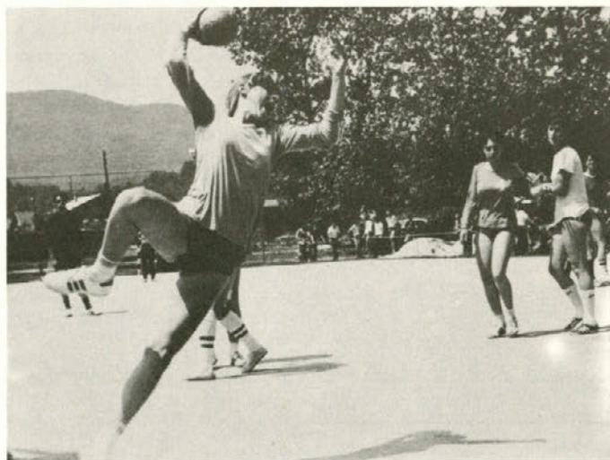
Z ženskega rokometnega turnirja 28. junija v Šmartnem ob Paki