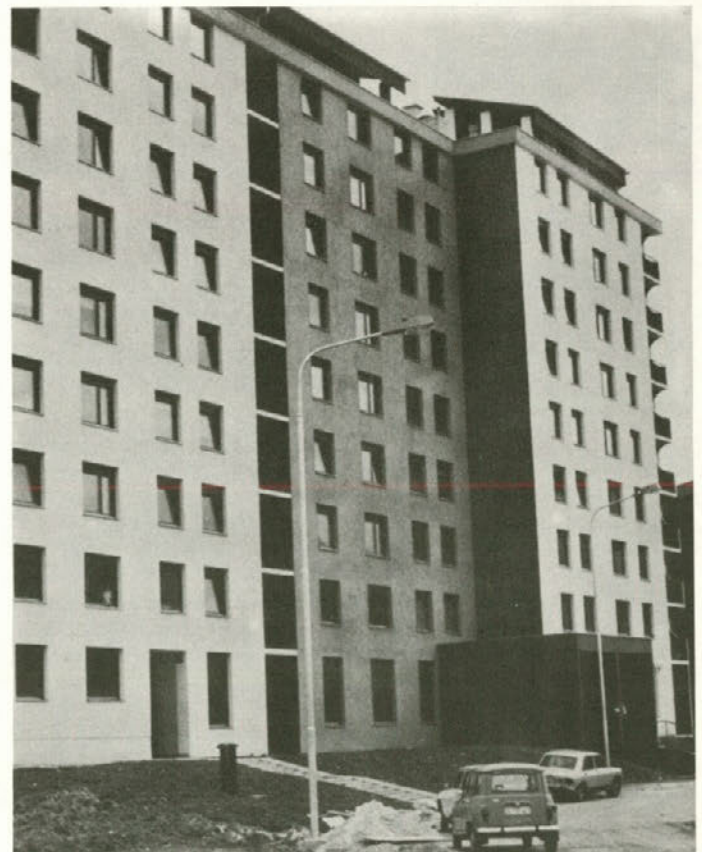
Nanovo zgrajeni blok B 2 v stanovanjski soseski na ploščadi Edvarda Kardelja v Velenju