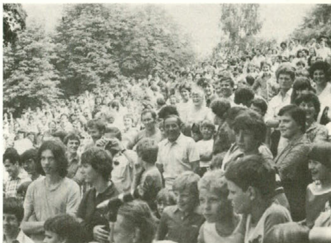
Na gradu 3. julija popoldne...

Zadnji ponedeljek v mesecu juniju se je delavcem naše delovne organizacije Plastika uresničila dolgoletna želja in potreba. Položili so - kot se reče - temeljni kamen za novo proizvodno