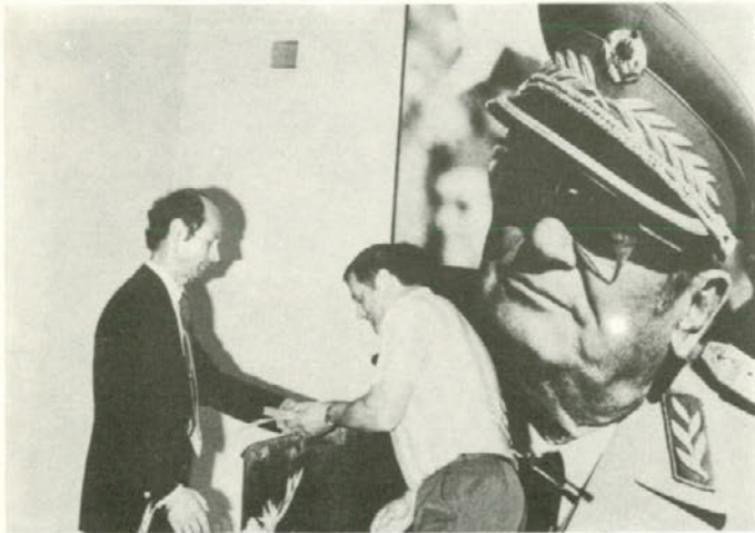
V osrednjem delu seje je potekalo podeljevanje odlikovanj predsedstva SFRJ delavcem in upokojencem iz RLV.