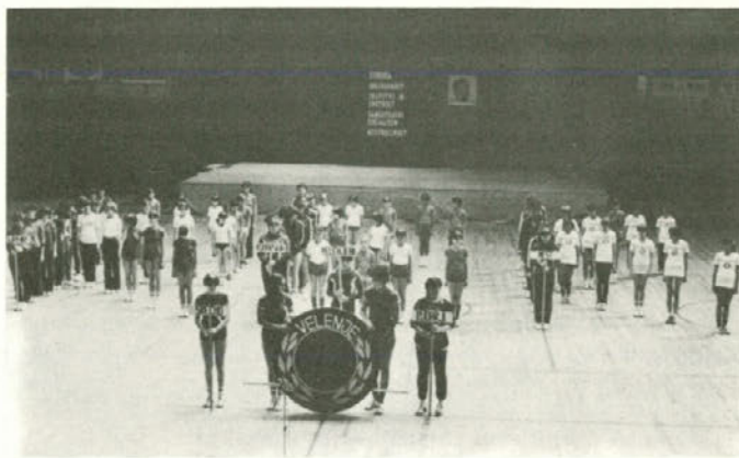
Svečani začetek ženskega rokometnega turnirja rudarskih mest 27. junija v Rdeči dvorani in pionirke ženskega rokometnega kluba Velenje, ki so poleg ekip rudarskih mest sodelovale v programu turnirja.

V finalni tekmi sta se pomerili ekipe labinskega Rudarja in prva ekipa Velenja. Zmagale so Labinčanke (z 22 : 19). Rezultat je bil vseskozi zelo izenačen, kar se je videlo tudi v živčnosti igralk obeh ekip, saj so proti koncu napravile nekaj protinapadov.