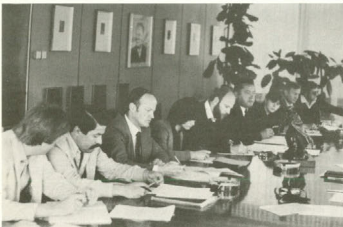
Del udeležencev razgovora v naši sestavljeni organizaciji 26. junija o potrebah po spremembah in dopolnitvah zakona o delovnih razmerjih

Sporočilo z gospodarskega področja skupnih služb SOZD REK Velenje