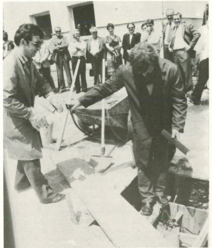
Predsednik delavskega sveta (desno) in predsednik sindikalne organizacije Plastike sta v pripravljeno prostor vgradila ročni spenjalec s kosom plastičnega embalažnega traku in sponko ter dokument o tem dejanju in s tem položila temeljni kamen za novo proizvodno halo Plastike.