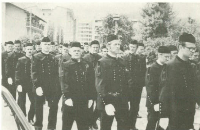
Po prihodu praznične parade na kotalkališče...

Zabava za že oskrbljene in tiste, ki so se namenili pozneje oskrbeti na bloke - pa tudi tiste brez blokov, saj je pri drugih stojnicah bilo mogoče kupiti po zmer- nih cenah jedačo in pijačo - se je tako lahko začela. Tam so bile veselične mize s stoli, oder za ples in