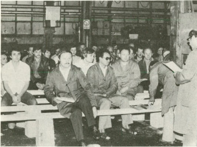
Omenjeni zbor delavcev v RLV 28. julija v uvodnem članku (nočne izmene TOZD RLV - Jamska mehanizacija), o katerem bomo še nadrobno pisali (v Informatorju).