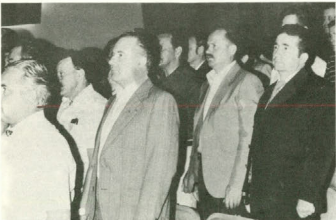
Med kratkim kulturnim programom v začetku seje, ko je moški pevski zbor "Kajuh" zapel rudarsko himno.