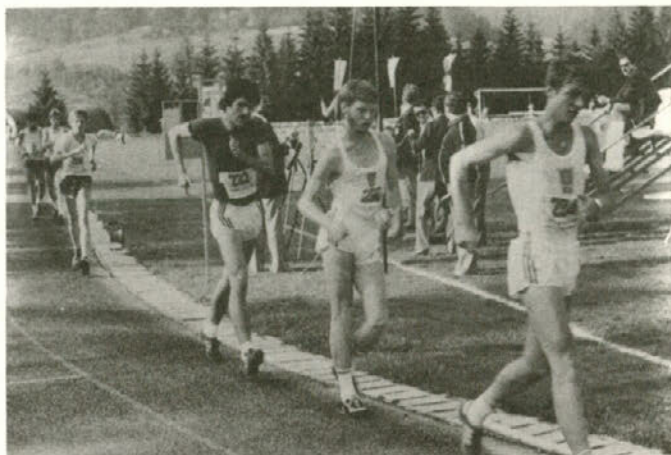
Dva prizora z atletskega srečanja 1. julija na velenjskem stadionu

Po tekmovanju se je med športnimi delavci, novinarji in trenerji izoblikovalo mnenje, da naj bi bil velenjski atletski miting ob 3. juliju vsakoletna revija samo jugoslovanske atletike, in to zavoljo tega, ker ob mednarodnih tekmovanjih v Celju, Zagrebu, Mariboru in