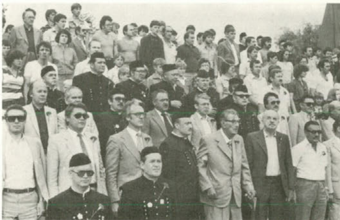
se je začela osrednja proslava praznika...