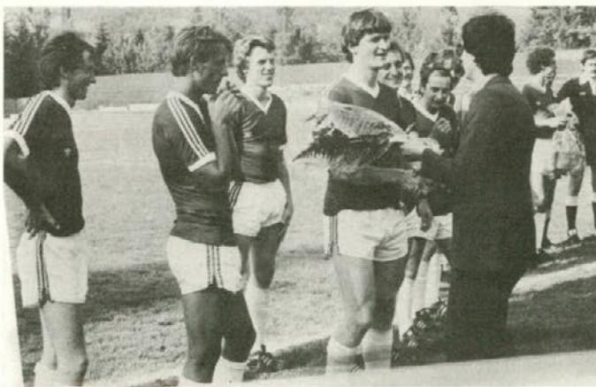
S srečanja nogometašev iz Šmartnega ob Paki in Trboveljskega Rudarja 27. junija na velenjskem stadionu