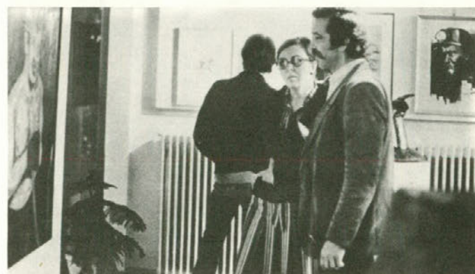
Iz razstavnega prostora knjižnice Velenje takoj po svečanem odprtju razstave