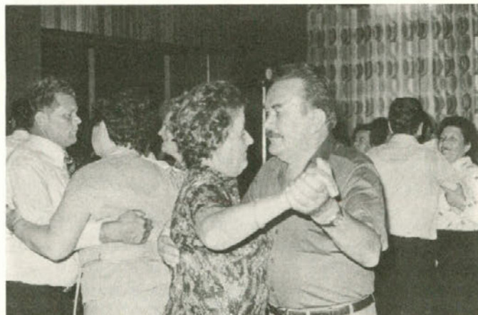
V Delavskem klubu 1. julija zvečer: naši upokojeni delavci in delavke po lanskem 3. juliju pri plesu