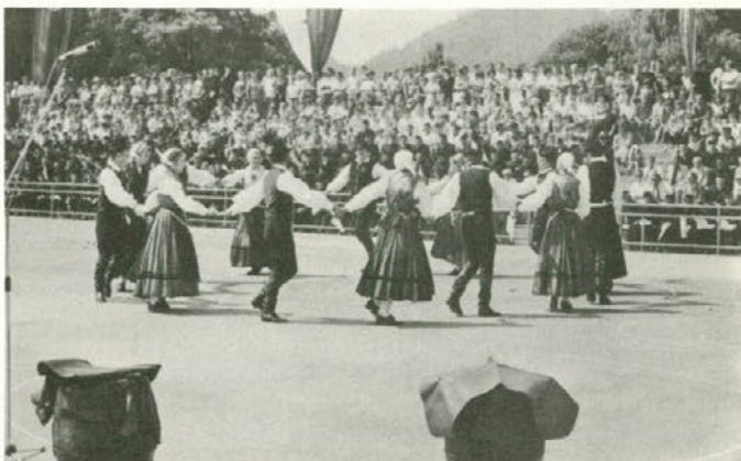
tudi z nastopom šaleške folklorne skupine "Koleda".