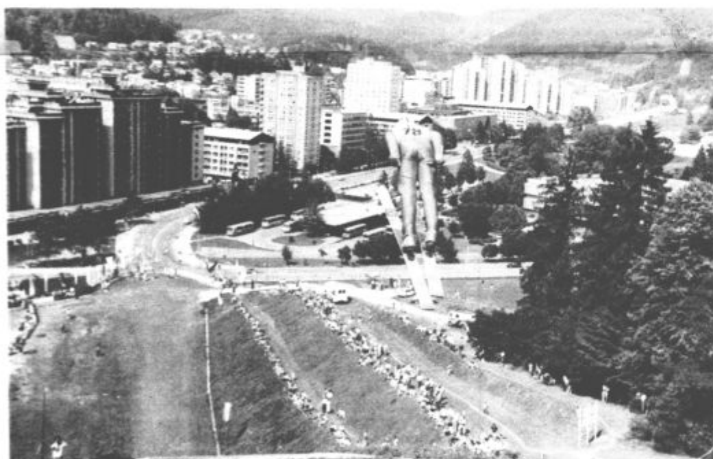
Hopla, Gorzdd, ne v mesto