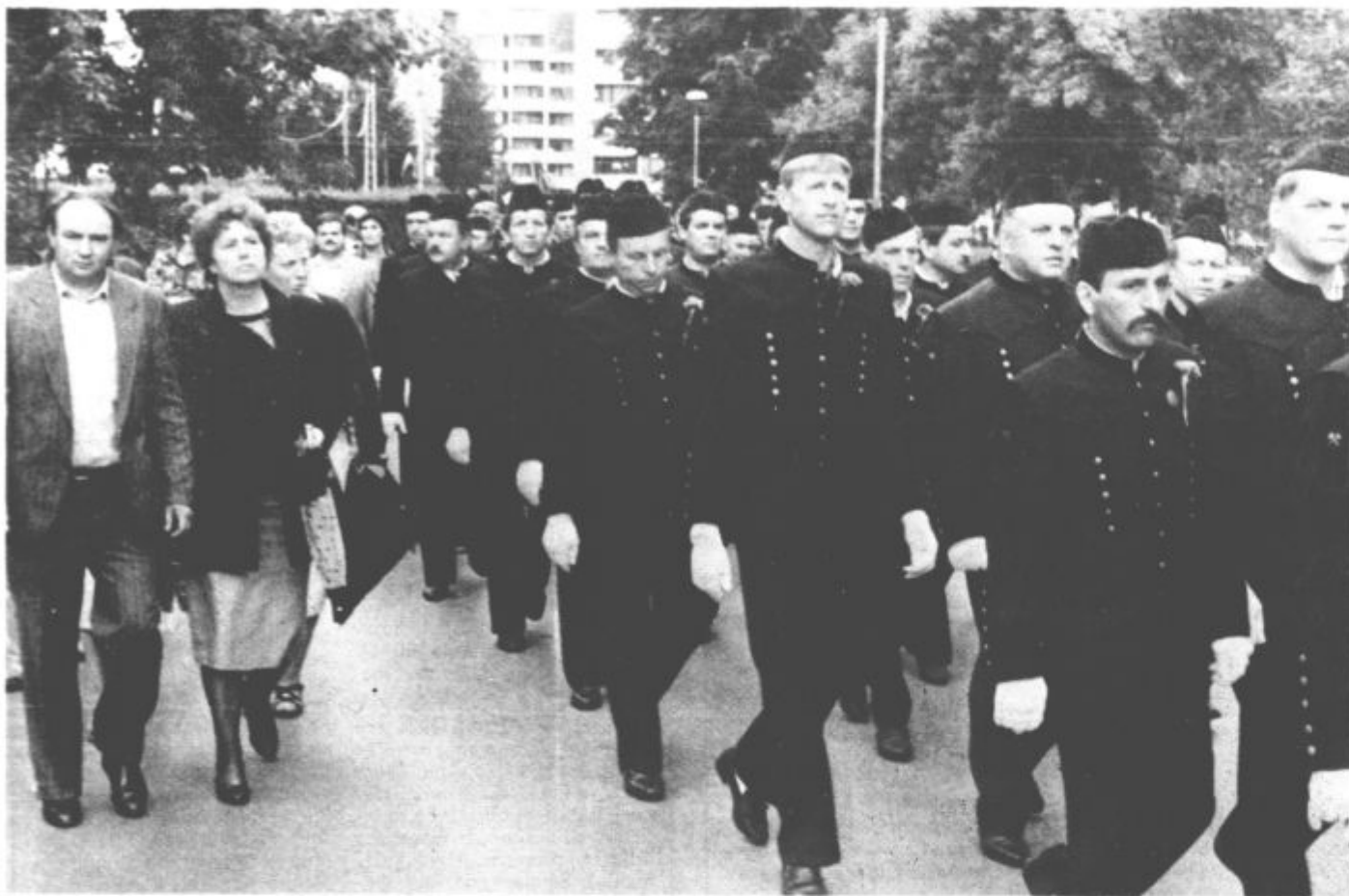
3. JULIJ — to ni le praznik rudarjev, praznik delavcev Rudarsko elektroenergetskega kombinata Franc Leskošek-Luka Velenje, vse bolj postaja 3. julij praznik nas vseh, praznik mesta Titovo Velenje.