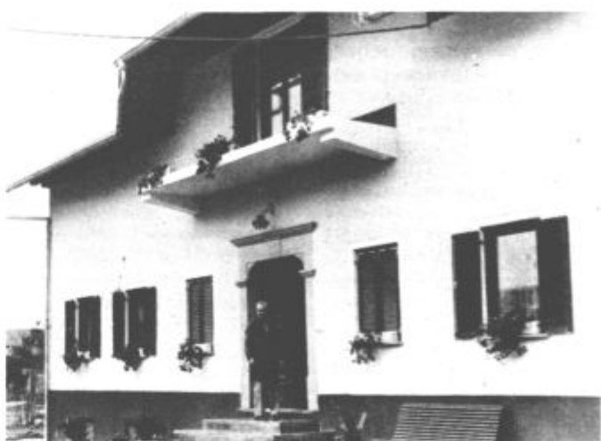
Povečana in prenovljena hiša bo služila tudi kmečkemu turizmu

Tržno usmerjena kmetija se ukvarja tudi z mlečno proizvodnjo. Tu pa so težave največje. »Kmet dobi za pridelano