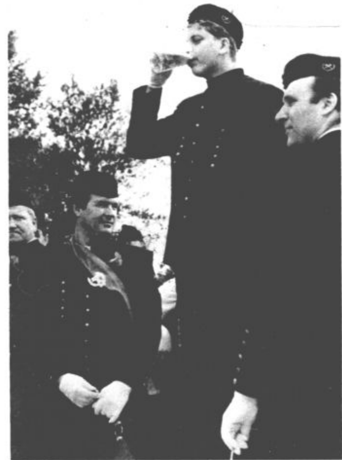
Pivo na dušek, tudi to je knapovska preizkušnja