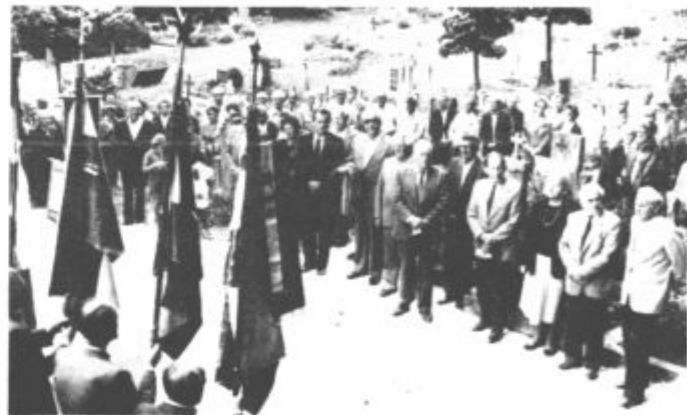
Šmartno v Titovem Velenju