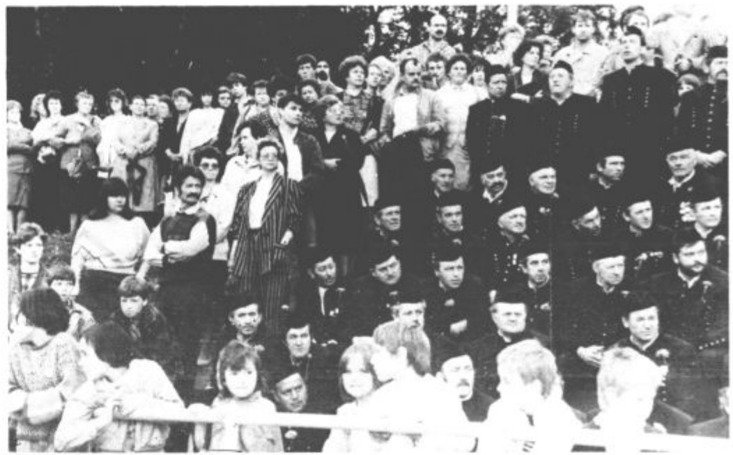
Praznik rudarjev, vseh drugih delavcev, njihovih družinskih članov — vsega mesta

Na letošnji osrednji slovesnosti ob dnevu rudarjev so