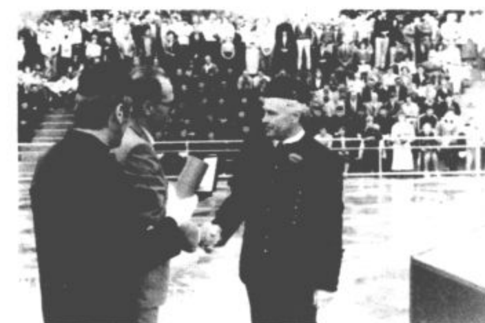
Red dela z rdečo zvezdo Montanistiki

Vendarle lepi tekmi za pokal M kluba in veliko rudarsko svetilko