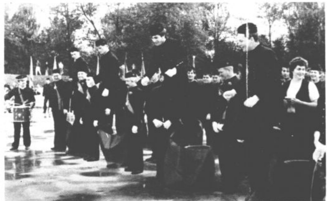
Skočiti znam, zakaj ne bi še dober knap postal