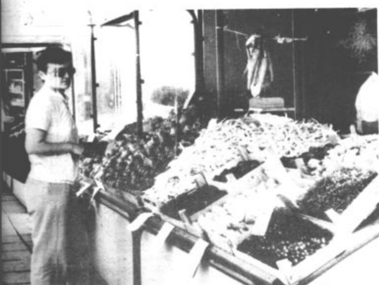
... in za izživiljanje