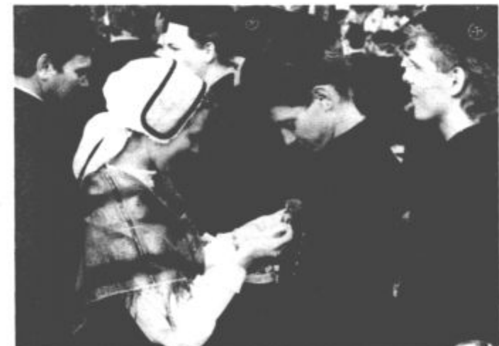
Rdeč nagelj za ljubezen