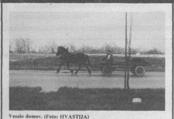
Veselo domov.