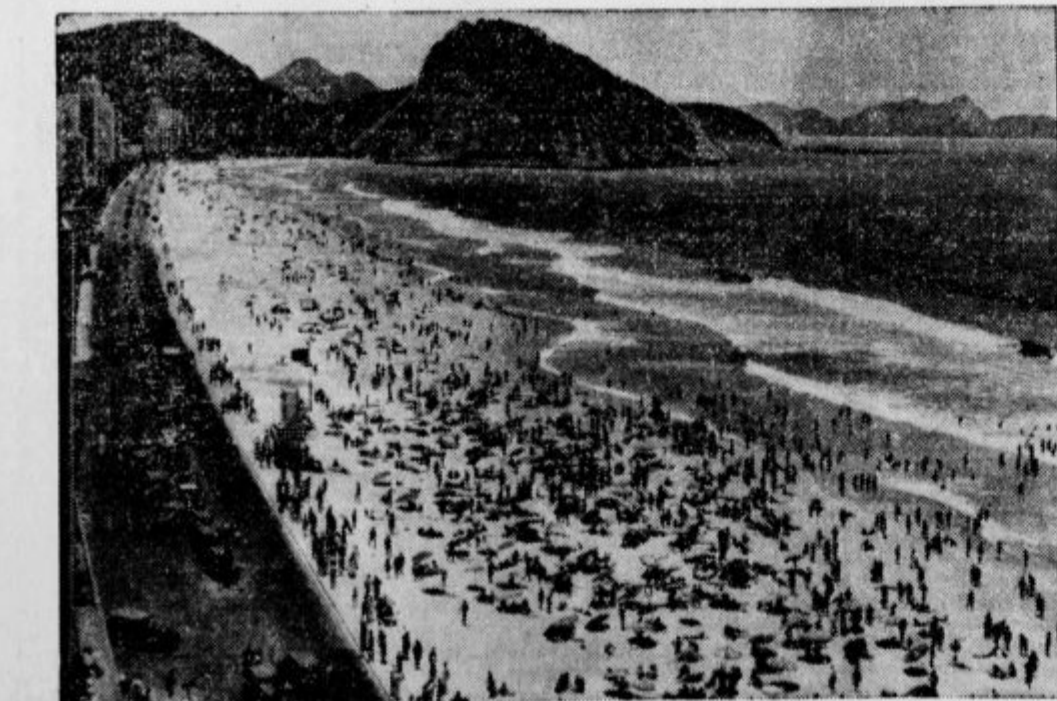
V Rio de Janeiro je poletje! Tu so pravkar otvili kopalnišča. Na sliki vidiš čudovito kopalnišče Copa cabana.

»Kakšno pisano ruto pa imaš krog vratu?« »Saj ni ruta! Zavezal sem si le prav vse kravate, ki sem jih dobil za božič, da ne bo kje zamerele«