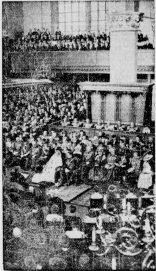
S poroke holandske prestolonaslednice Julijane: poročni par (sedé) v cerkvi sv. Jakoba v Haagu pri poročnem obredu.