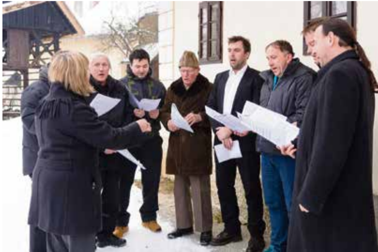
Tudi letos so se Muljavci poklonili Jurčiču na predvečer njegove obletnice rojstva

Predvečer jubilejnega 25. Pohoda po Jurčičevi poti je bil v občini Ivančna Gorica zaznamovan z dvema kulturnima dogodkoma, posvečenima rojaku Josipu Jurčiču. Na Muljavi so se že tradicionalno poklonili rojaku pred Jurčičevo rojstno hišo, nadaljevali pa v Galeriji Kresnička, kjer je potekalo odprtje fotografske razstave ob 25-letnici Jurčičeve poti in ogled ilustracij z likovnega natečaja Deseti brat. Slovesno je bilo tudi v Višnji Gori, kjer so organizatorji pripravili razstavo likovnih del Kulturnega društva likovnikov Ferda Vesela Šentvid pri Stični na temo Kranjske čebele.