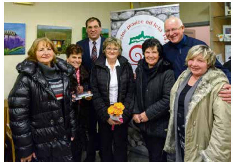
Članice KD likovnikov Ferda Vesela Šentvid pri Stični so v mestni hiši v Višnji Gori pripravile razstavo slik na temo Kranjske čebele