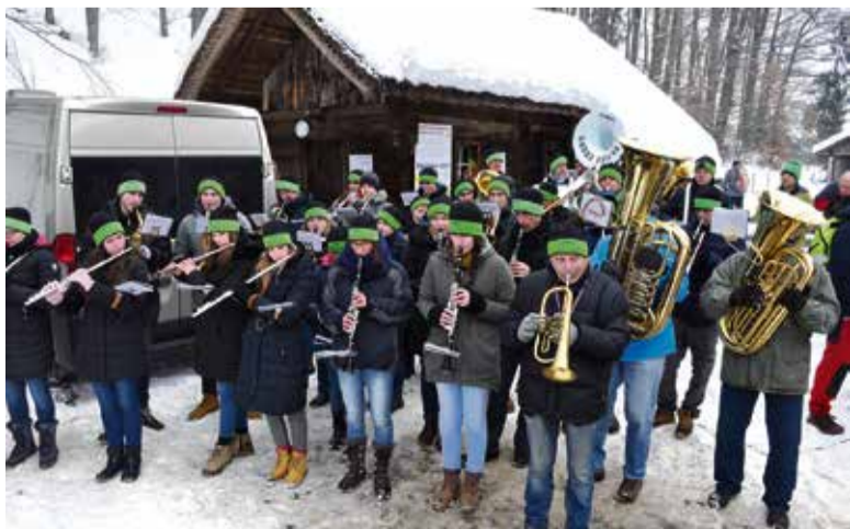
Brez Godbe Stična ni Jurčičeve poti