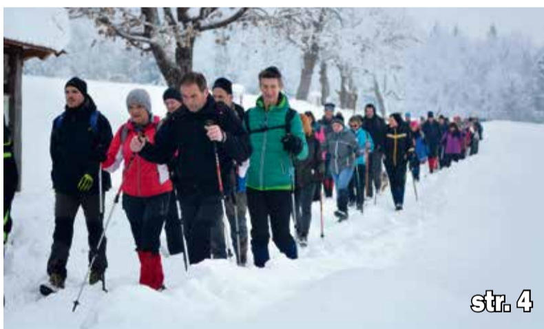
Jubilejnega Jurčičevega pohoda se je v mrazu in snegu udeležilo 3.000 pohodnikov

Tudi naša odgovornost je, da se bodo štokrlje vsako pomlad vrnile v Ivančno Gorico.