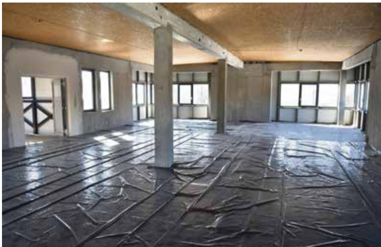
Občina Ivančna Gorica je že izbrala izvajalca za ureditev prostorov v nadstropju nad novo lekarno