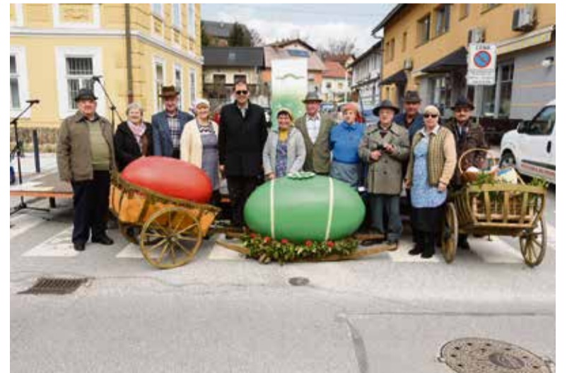
Člani TD Ivančna Gorica so letos pripeljali pirhe »velikane«