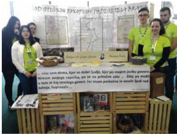
Srebrna turistična stojnica