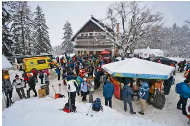
Polževo je bilo prva večja postojanka pohodnikov z brezplačnimi toplimi napitki in živo glasbo Godbe Stična.

Po Jurčičevi šolski poti od Višnje Gore do Jurčičeve domačije na Muljavi je kljub slabši vremenski napovedi, mrazu in snegu stopalo več kot 3.000 ljubiteljev literarnega pohodništva. Višnja Gora, ki letos praznuje 540-letnico mestnih pravic, je tudi zibelka najbolj marljive pasme čebel na svetu kranjske sivke, zato so predstavniki Čebelarstva društva Stična pohodnikom že na startu postregli z medenim zaj-