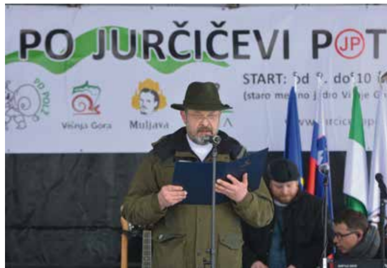
Pohodnikom se je letos pridružil tudi novi predsednik državnega sveta Alojz Kovšca, ki je med drugim nagovoril udeležence in opozoril na pomembnost Jurčičeve popotnice slovenstvu.