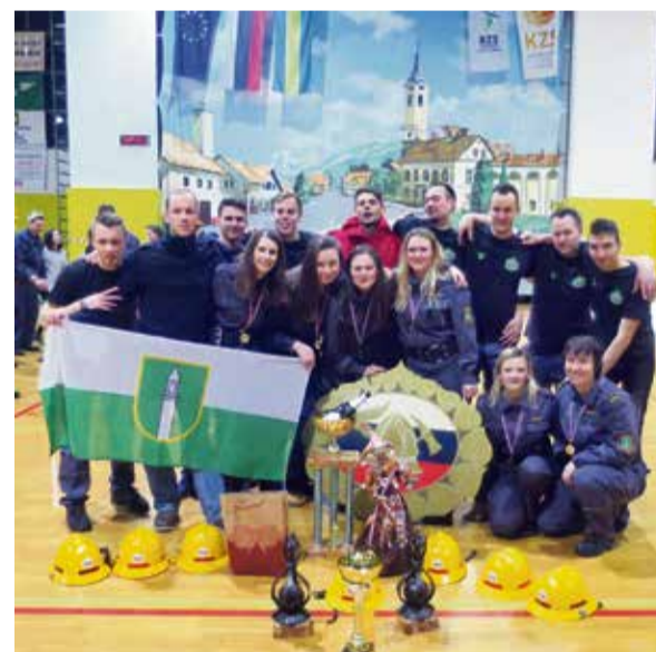
Skupna slika po tekmovanju v Zalogu na Gorenjskem, kjer sta obe ekipi pobrali pokala za najhitrejši ekipi, Ivančna Gorica pa še prehodni pokal in pokal za 1. mesto.