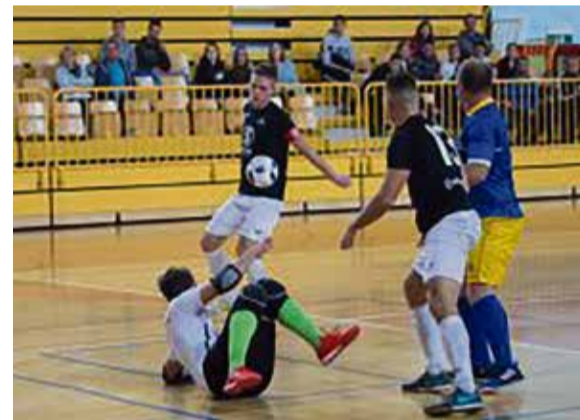
Utrinek s tekme v Novi Gorici

Poleg članov so letos prvič v klubskih tekmovanjih na-