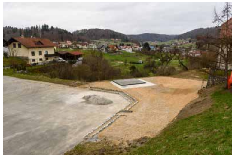
Čebelnjak Kranjske čebele bo v Višnji Gori stal v neposredni bližini starega mestnega jedra

V Višnji Gori že potekajo številna dela za čebelarstvo praznovanja v maju. Prvi dogodek bo slovesno odprtje novega čebelnjaka, poimenovanega Čebelnjak Kranjske čebele.