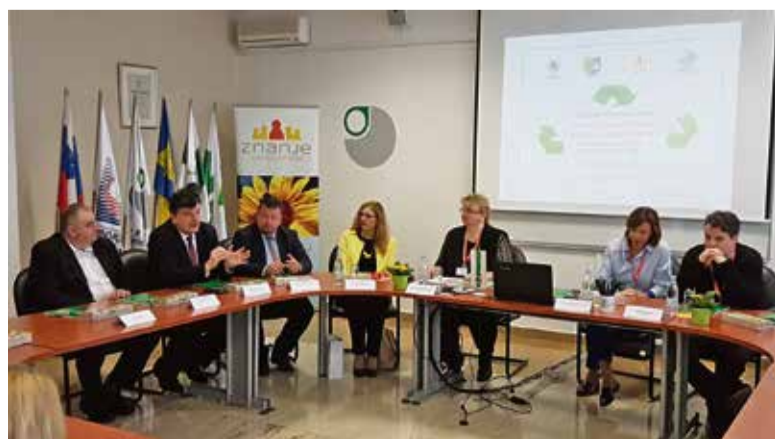
Posvet »KAJ PODJETNIKU PRINAŠA KROŽNO GOSPODARSTVO«, 5. 4. 2018, Dom obrtnikov Grosuplje.