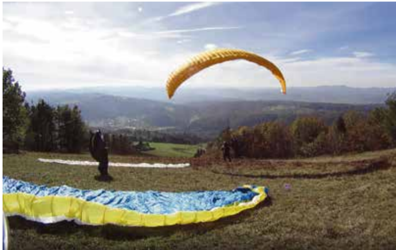
Vzletišče na Gradišču nad Višnjo Goro