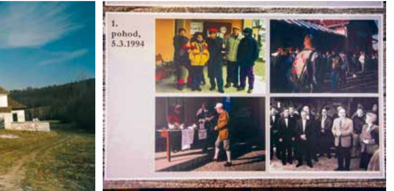
Utrinki iz prvega pohoda leta 1994