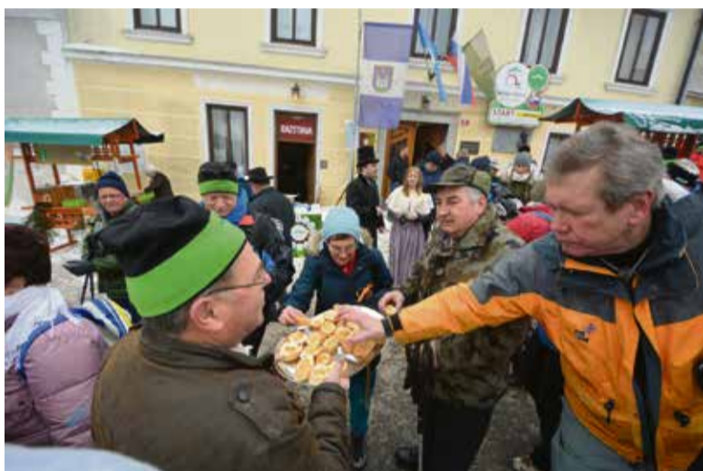
Medeni zajtrk za pohodnike so pripravili člani čebelarstva Stična.