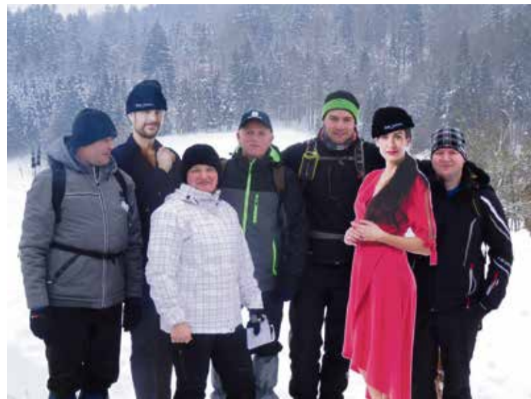
Na Oslici so učenci Podružnične šole Zagradec pohodnike vabili, da izberejo nekoliko daljšo različico poti do Krke, in si med drugim ogledajo tudi znamenite lokacije snemanja priljubljene nanižanke Reka ljubezni.

V podporo njegovim besedam govorijo tudi številke, saj se je po oceni organizatorjev v vseh 25. letih pohodov udeležilo že več kot 100.000 ljudi. Kot dober primer prispevka k trajnostni mobilnosti udeležencev in Slovenskih železnic velja poudariti, da se vsako leto več pohodnikov iz smeri Novega mesta in Ljubljane na start pohoda v Višnjo Goro pripelje z brezplačnim vlakom. Župan je ob zaključku pri-