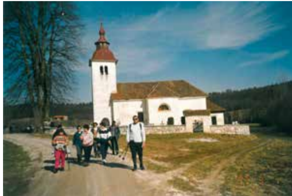
Utrinek iz 4. pohoda leta 1997 (fotografija iz arhiva Jožeta Gregoriča, ki se je udeležil vseh 25 pohodov po Jurčičevi poti)

je dejal razstava zajema fotografije vse od prvega pohoda leta 1994 do lanskoletnega in predstavlja prepletanje dveh značilnosti Jurčičeve poti. To so čudovite naravne lepote in bogata kulturna dediščina. Dogodek so obogatili člani Moškega pevskega zbora Muljava in najmlajši muljavski kulturniki.