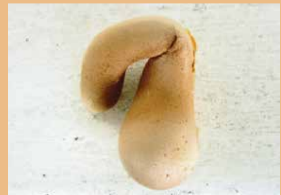
Jajce v približno naravni velikosti.