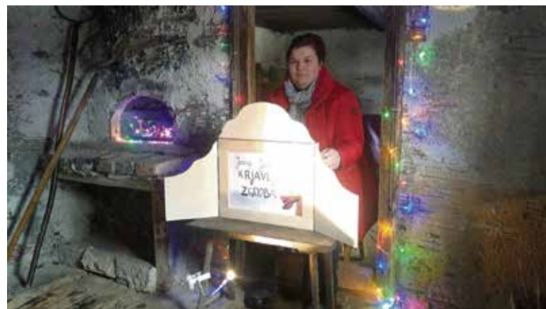
Organizatorji pohoda so v sodelovanju s knjižnico Ivančna Gorica tudi letos pripravili literarni kviz, tokrat na temo prvega slovenskega romana z naslovom Deseti brat. Knjižnica je za najmlajše in tudi tiste malo starejše organizirala tudi kamišibaj, namizno gledališče v Krjavljevi koči.