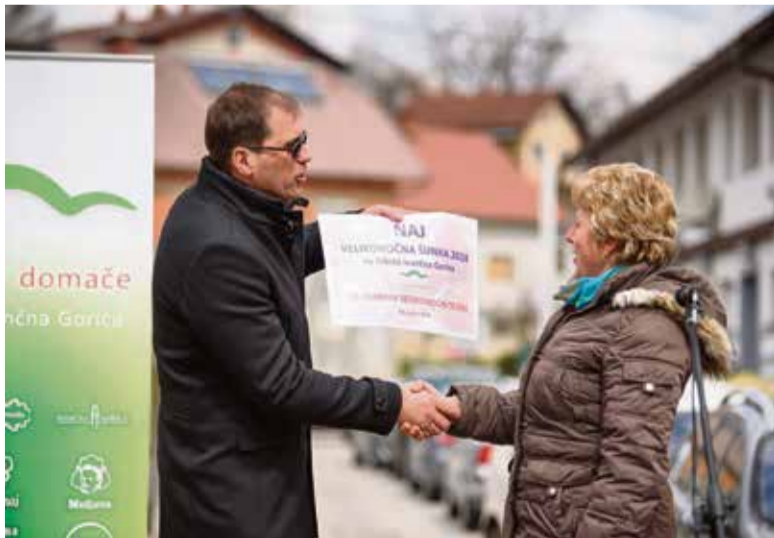
Priznanje za naj velikonočno šunko je prejela Izletniška kmetija Okorn.

V soboto, 23. marca, je v Ivančni Gorici potekal tradicionalni 11. velikonočni Ivankin sejem. Sejem, ki je poimenovan po Ivanki iz legende, ki govori o nastanku imena Ivančne Gorice, je na Sokolsko ulico v središču Ivančne Gorice znova privabil množico obiskovalcev.