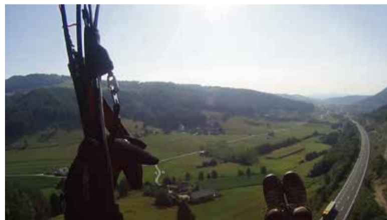
Nad Dednim Dolom in pogled na dolensko avtocesto