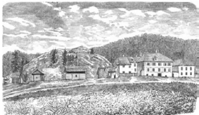
Grad Podsmreka pri Višnji Gori s čebelnjaki (1875)