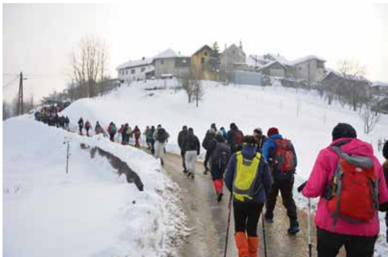
Slovenske železnice so tudi letos omogočile brezplačen prevoz pohodnikov na izhodišče jubilejnega pohoda v Višnjo Goro iz smeri Novega mesta in Ljubljane.