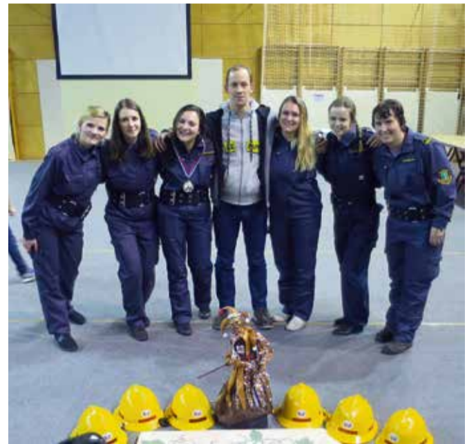
Tekmovalna enota članice A PGD Ivančna Gorica.

Zagraški člani letos tekmujejo že drugič v zimski ligi hitrega spajanja sesalnega voda, ki ga organizira Gasilska zveza Slovenije in so lani v