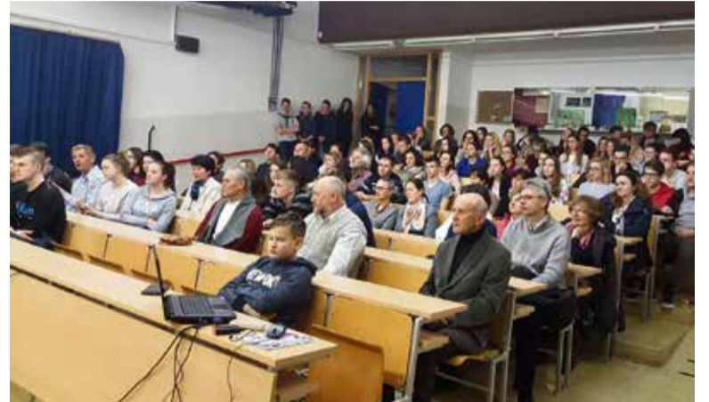
Obiskovalci so napolnili predavalnico

Srednja šola Josipa Jurčiča Ivančna Gorica praznuje dan šole s počastitvijo Jurčičevega rojstnega dne. Ker je tedaj običajno Jurčičev pohod, praznovanje organiziramo en teden kasneje, letos je bilo to v petek, 9. 3. 2018, ob 17.30 v šolski predavalnici. Pripravili smo okroglo mizo s svojimi nekdanjimi dijaki, ki so v šolsko predavalnico privabili veliko množico dijakov in profesorjev in tudi kar nekaj staršev.