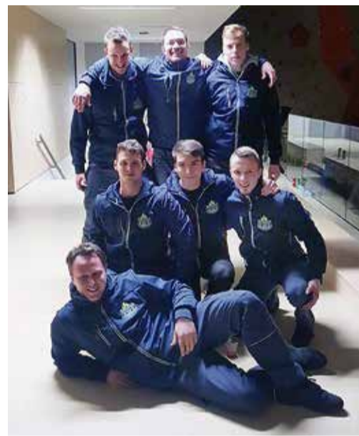
Tekmovalna enota člani A PGD Zagradec pri Grosupljem