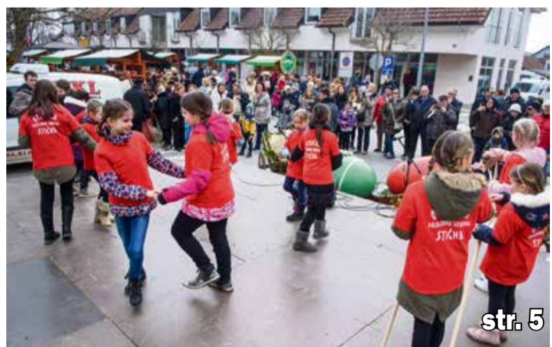
Ivankin sejem in pridih velikonočnih praznikov