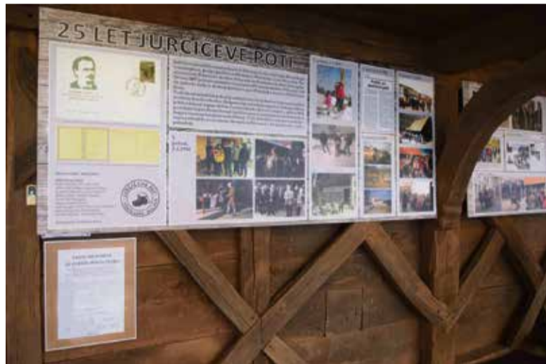
Ob 25. pohodu po Jurčičevi poti je nastala tudi spominska razstava fotografij iz vseh dosedanjih pohodov