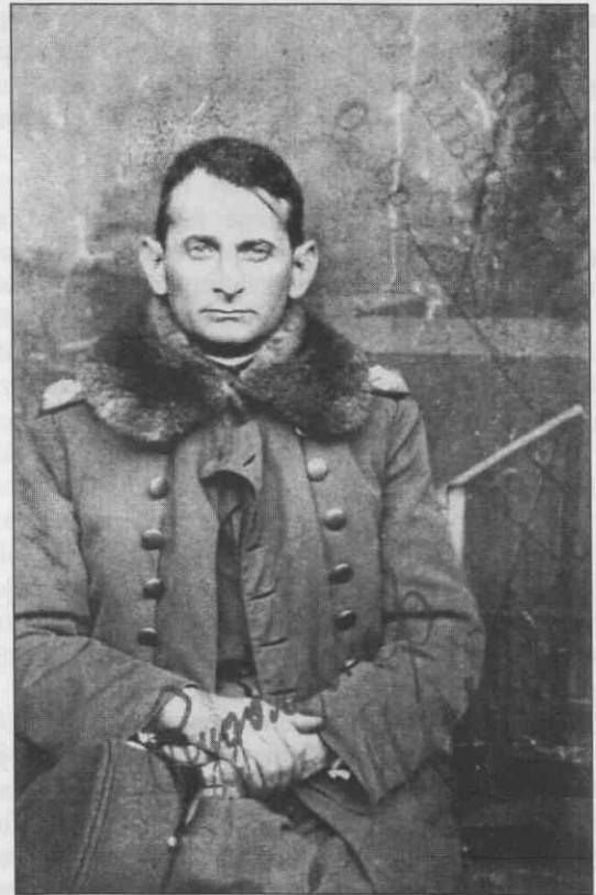
Iz časa, ko je služil v Osijeku. Zanimivo je, da se je na sliko podpisal v cirilici.

vstajo preložijo, dokler ne bo vse pripravljeno. Ko mi je deputacija izjavila, da je že izdan ukaz in da je preložitev nemogoča, sem zavrnil ponudbo in vsako sodelovanje, tudi to, da bi se vsaj pojavil v albanskih planinah, kar bi po njihovem mnenju pomenilo, da je Avstrija spet zaživela in s tem bi bil uspeh zagotovljen. Povedal sem jim: 'Gospodje, tukaj je moj mali sin brez matere, njemu sem bolj potreben kot tistim vrbam na Skadorskemu jezeru.' Zares se je 20. novembra dvignila vstaja, njen rezultat pa je bil, da je brez potrebe padlo mnogo junaških glav." 9