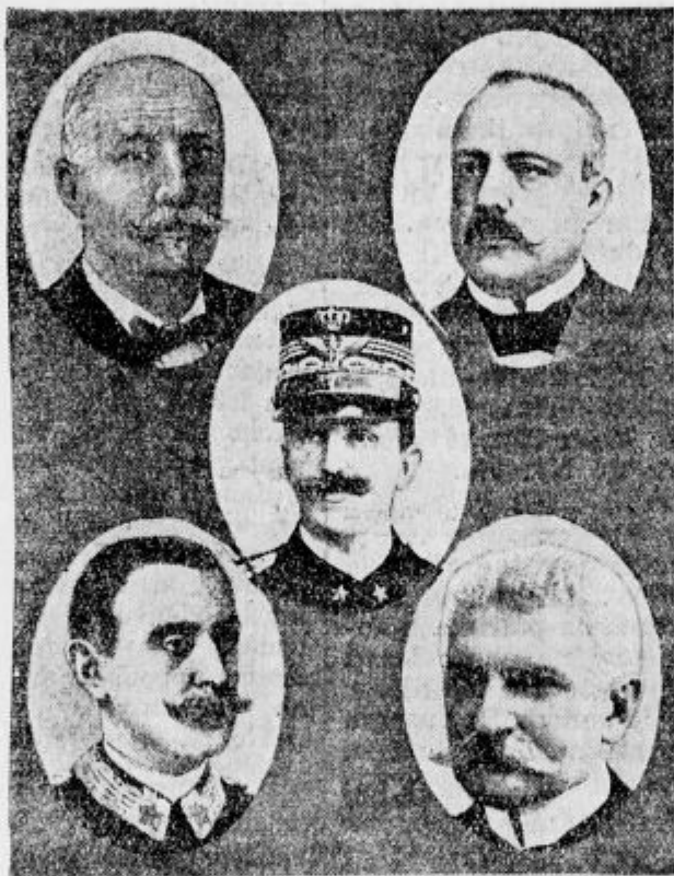
Naša slika kaže (zgoraj) od leve na desno Giolittija, Salandro, v sredi italijanskega kralja, spodaj od leve na desno vojne ministra Zupellija in Sonnina.

Nato je govoril »mučenik« d'Annunzio, ki je v svojem govoru opljuval z grdim blatom vse prijatelje miru in rekel, da mora ljudstvo poiskati izdajalce Giolittijevega kova po njihovih skrivališčih in jih kaznovati. Niti eden teh zločincev ne sme v četrtek v vežo zbornice. Narod mora vse te izdajalce napisati na proskribicijsko listo in jih kaznovati. d'Annunzio je nato zasramoval kneza Bülowa, čegar rimsko vilo bo kmalu narod zaplenil. Z gledališko gesto je nato potegnil pesnik zarjavelo sabljo, ki jo je svojčas nosil bojev-