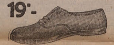
19°.— Za djecu ljeti najpraktičnije. Veličina 27—34 Din 25.—