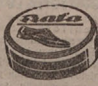
KREMA DIN 4.—