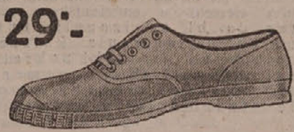
29°.— Platnene sa gumenim djonom u raznim bojama. Muške Din 39.—