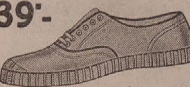
39°.— Specijal-tenis cipele sa elastičnim djonom. Muške Din 49.—