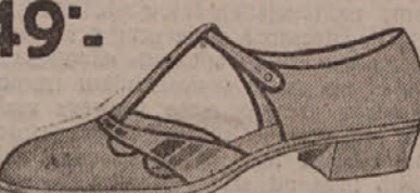
49°.— Na ulicu, za izlet i na ljetovanje, uvijek ih trebate. U svim modnim bojama.