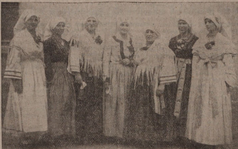
(Fotografije narodnih noš — z nedeljske prireditve Soče-matice v Ljubljani se dobe v podupravi »Istra«, Erjačeva c. 4a, dvorišče)

»Ja, ekcelenca, — odgovori čovjek, — nisam lud. Ja sam ovdje nadglednik«.