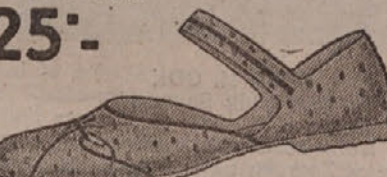
25°.— Na plaži očuvat će Vas ozlijeda naše kupaće cipele. Dječje Din 19.—