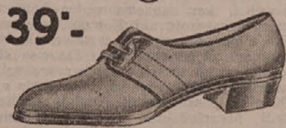
39°.— Za ljetovanje i izlete najprikladnije. Udobne su i veoma lagane.