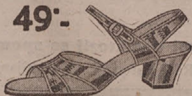
49°.— »Hawaye« sandale u svim modnim kombinacijama boja.