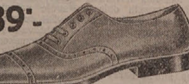
89°.— Dobar boks i jaki gumeni djon izdržat će svaki štrapač.