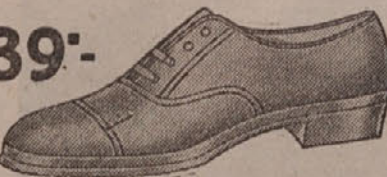
39°.— Praktične platnene cipele za svakidašnje nošenje.