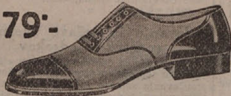
79°.— Elegantne kožne cipele kombinirane sa platnom. Lagane i prozračne.