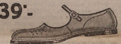
39°.— Kožne sandale sa krep djonom. Vel. 23—26 Din 35.—, Vel. 35—38 Din 49.—, Muške Din 59.—