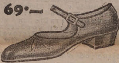
69°.— Lagana sandala u modnim bojama. Udobna i prozračna.