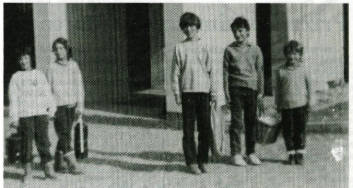
Mladi člani RK Osnovne šole Kresnice, ki nesejo živila iz trgovine in kosilo ostarelim