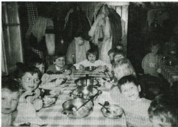
Po smučanju sem vedno lačen