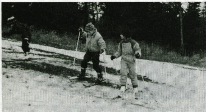
Uh, kako je smuka lahko naporna