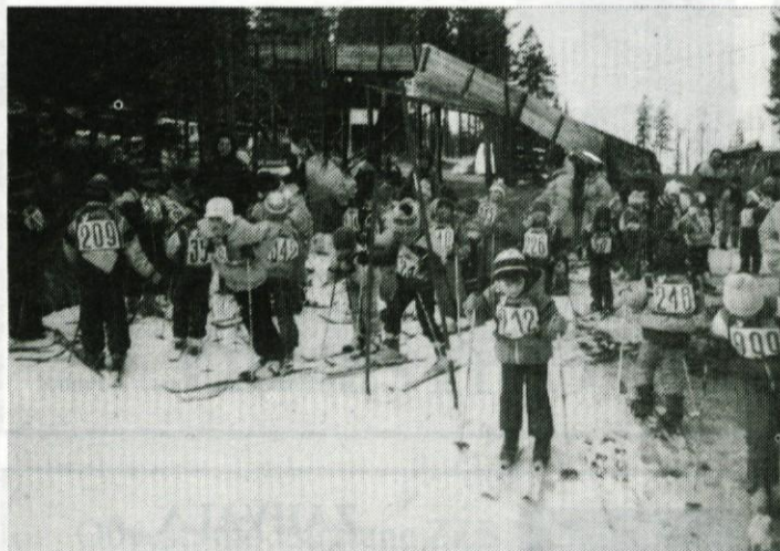
Poglejte me, saj smučam kot Bojan Križaj!