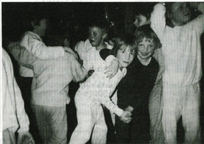
Kljub utrujenosti rad zaplešem. In to disco!