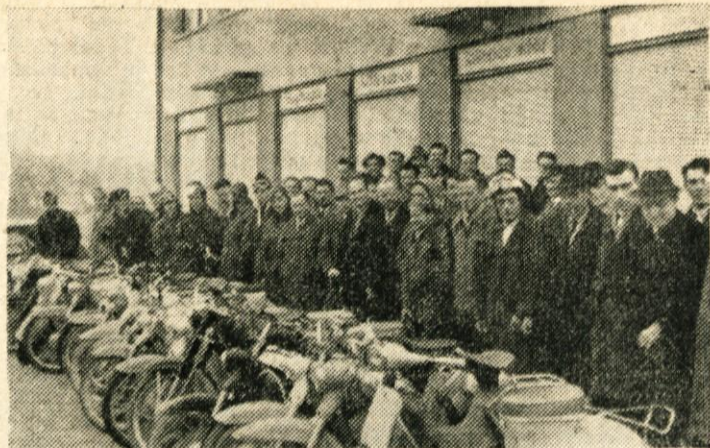
Motorizacija se nezadržno širi. Tudi v Moravčah je kljub slabim cestam vedno več motornih vozil, posebno motornih koles in mopedov, njihove lastnike pa je prizadevno AMD Moravčce povežalo v trdno organizacijo. Na sliki: revija motorizacije pred Zadrudnim domom

Ker se bodo podobni primeri v letnem času verjetno še pojavljali, naprošamo občane, da o vseh sumljivih ljudeh takoj obvestijo postajo LM ali najbližjega milicijskega. Če bi bila v opisanem primeru LM obveščena ob 10. uri dopoldne, to je takrat, ko so sumljive tujce ljudje prvič opazili, potem smo prepričani, da do roparskega napada ne bi prišlo.