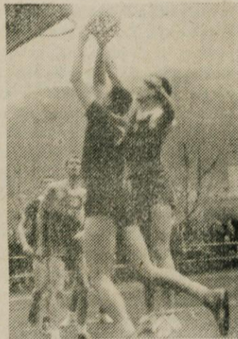
Domžalčani v napadu

Dermastje in Homeirja ni bilo, ker je bil naš gost odlično razpoložen. Domžale so visoko zmagale 61:49 (37:34).