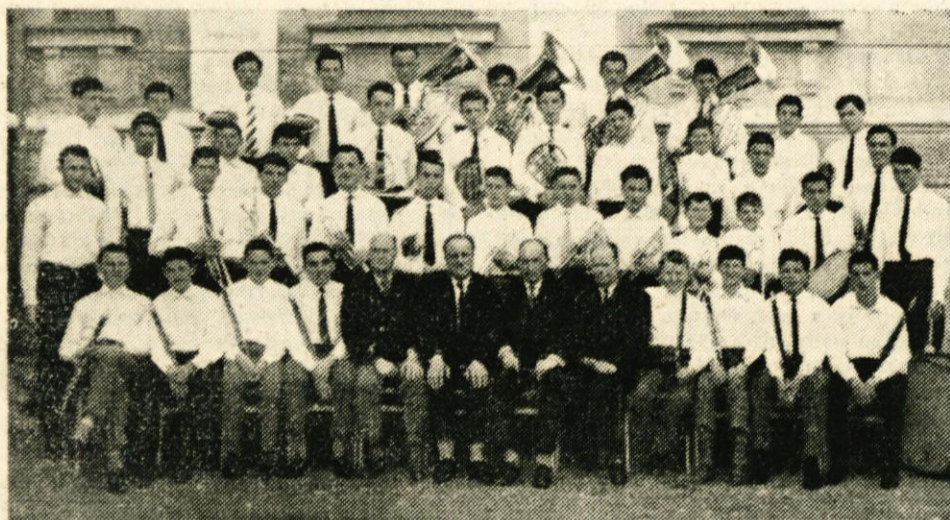
Mladinska godba glasbene šole Domžale-Mengeš je bogat rezervoar mladih in sposobnih glasbenikov za obe naši godbi, ki imata bogato tradicijo, obenem pa je že tudi s svojimi samostojnimi nastopi dokazala visoko kvaliteto in vedno požela največje priznanje poslušalcev

Glasbena šola Domžale je bila ustanovljena v septembru 1950. leta. Do jeseni leta 1959 je delovala v manjšem obsegu. Imela je približno 100 učencev in to na oddelku za klavir povprečno 40, za violino 14, za pihala in trobila 8, za ljudske instrumente 35 učencev ter 20 cicibanov.