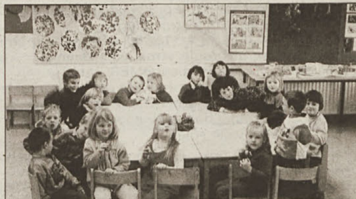
Polžki s svojim adventnim venčkom

V vrtcu pri osnovni šoli Podbočje v skupini polžkov (4-5 let) so december preživel praznično in malce drugače kot običajno. Veliko so prepevali ob spremljavi kitare, okrasili so svojo igralnico in pripravili kratek nastop za starše.