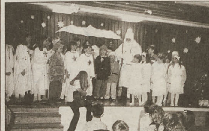
Dedek Mrza v družbi svojih prijateljev