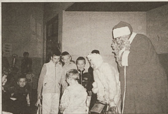
Božiček je s svojim spremstvom obdaril predšolske otroke.

Osnovna šola Dobova je pripravila posebno prireditev za otroke, ki še ne hodijo ne v vrtec ne v šolo. V avli šole so predstavniki oddelčnih skupnosti okrasili dobrih štiri metre visoko jelko in tako pripravili praznično vzdušje.