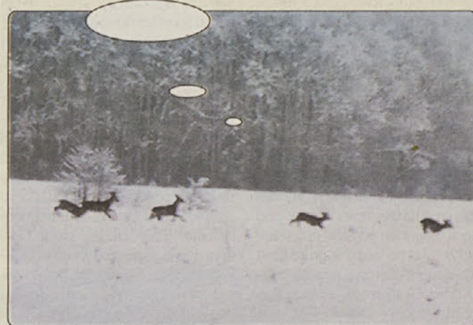
Lahko bi bila zimska idila na robu mesta. A kot kaže, je živali v snegu in mrazu na mestni prag prignalo pomanjkanje hrane. S.V.