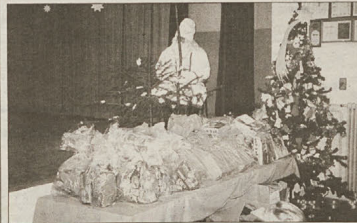
Darila, darila, darila...za vse jih je dovolj, je bil zadovoljen dedek Mrza.