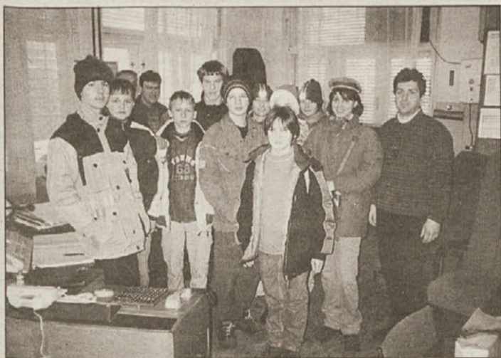
Na železniški postaji Sevnica