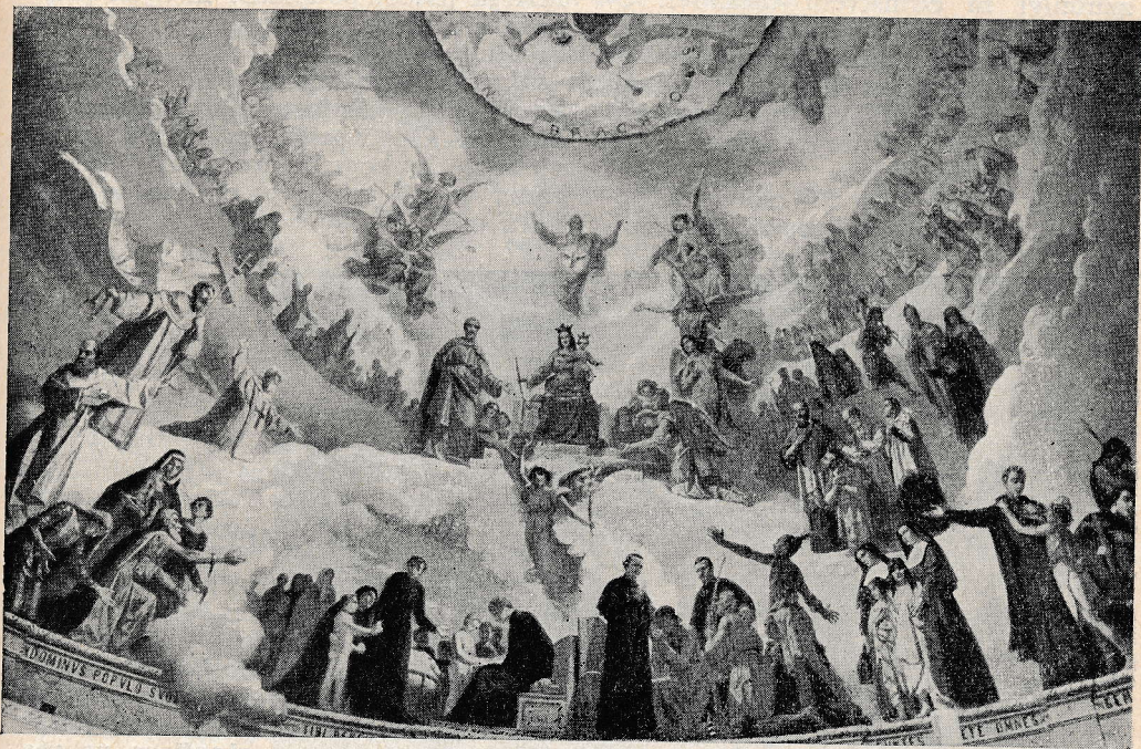
Turin: Marija Pomočnica v nebeški slavi med angeli in svetniki (slika v kupoli cerkve Marije Pomočnice v Turinu).

težko bolni ženi. Bolnica je že tri mesece ležala. Mučil jo je hud kašelj, vročina in popolna želodčna onemoglost.