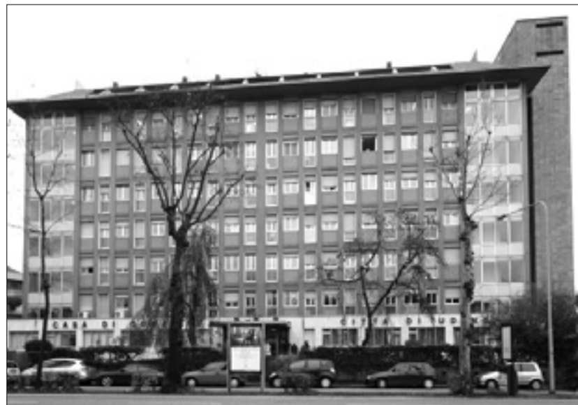
Videmska bolnišnica Città di Udine

Mills je sprva priznal, da je od Berlusconi prejel denar "v znak priznanja" za svoje delo. Kasneje je to zanimal, rekoč, da mu je denar izplačal italijanski ladjedelec. Berlusconi vse obtožbe odločno zanika, sicer pa je postopek proti njemu ustavljen zaradi imunitete, ki jo je uvedel zakon Alfano.