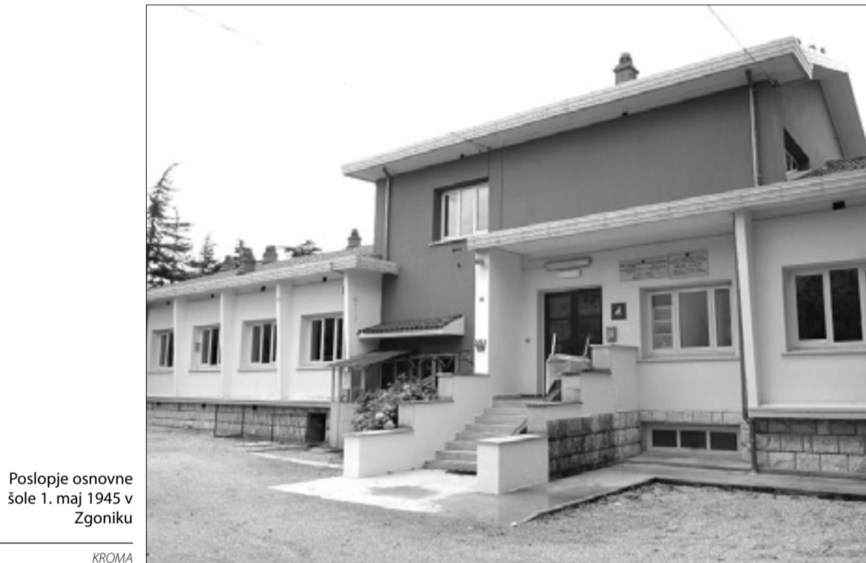
Poslopje osnovne šole 1. maj 1945 v Zgoniku