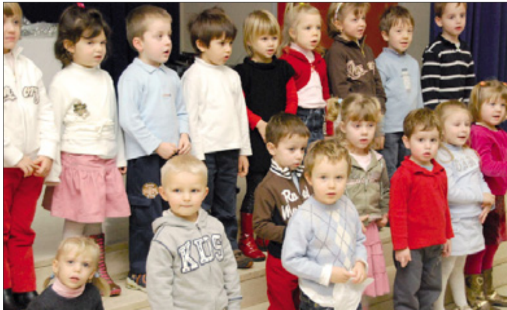
Otroci števerjanskega vrtca med torkovim božičnim nastopom