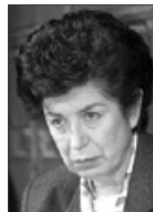
NEAPELJSKA ŽUPANJA ROSA RUSSO IERVOLINO

dni, nihče pa ni pričakoval, da bodo na koncu aretirali kar trinajst oseb. Med njimi so politiki, podjetniki in odvetniki, ki so po mnenju sodnikov igrali neke vrste posredniško vlogo med politiko in podjetništvom.