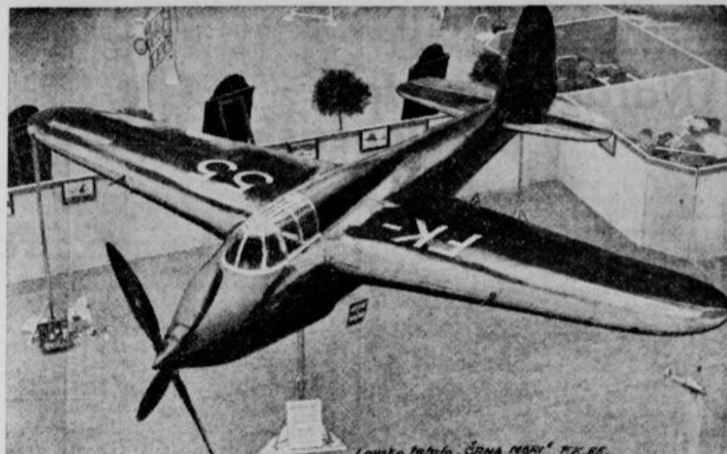
Najnovejši vzorec zrakoplova »FK 55« na razstavi v Parizu