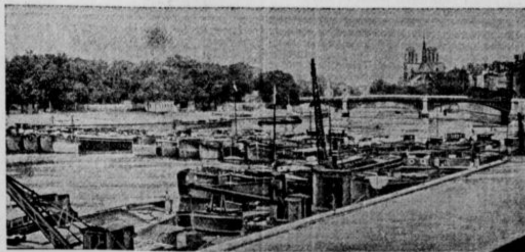
Na reki Seine štrikajo brodniki. Čolne in barke so zvezali in zagradijo reko, da je promet ustavljen