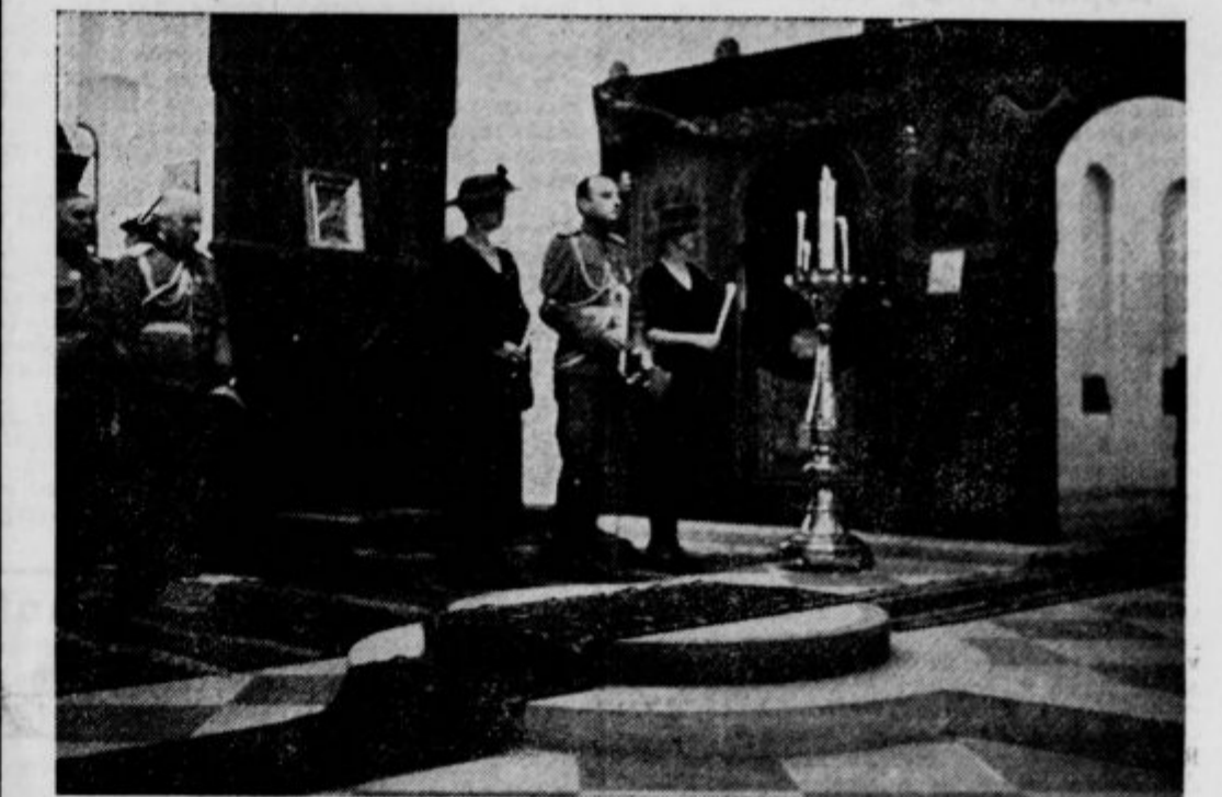
Knez-namestnik in kneginja med opelom v pravoslavni cerkvi.