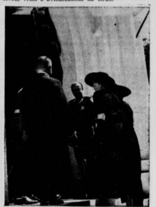
Prihod kneza-namestnika Pavla, kneginje Olge in kneginje Helene v pravoslavno cerkev.

krat »Slava!« Okoli trideset na 12 je bilo cerkveno bogoslužje v pravoslavni cerkvi zaključeno ter se je knez Pavle z obema kneginjama ter spremstvom vrnil z avtomobilom na Brdo.