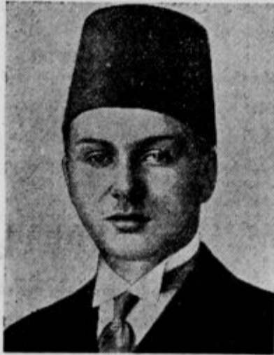
Mladega egiptovskega kralja, Farouka I., bodo z velikimi slovesnostmi kronali v Kairi konec tega meseca. Postal bo s tem polnoleten in bo opasan s »svetim mečem« Mohameda Alija.

Nekega hišnega posestnika v Kravari pri Moravski-Ostrovi je njegov prijatelj naplahtal, češ da je gosposka zasega njegovo enodužno hišo in mu namestila ljudi v stanovanje, tako da bo zanj ostala