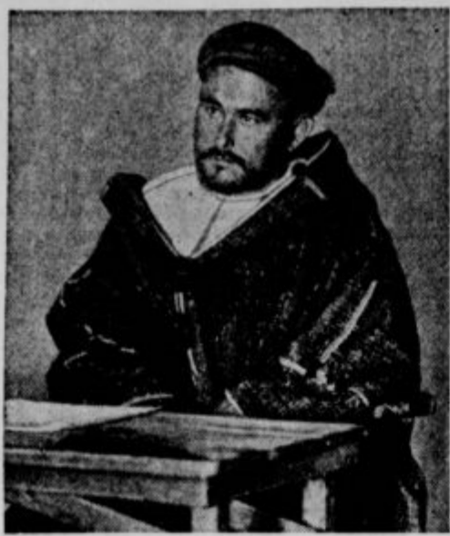
Krvave bitke za Maroko

Skoraj smo že pozabili na dramatično usodo Rifkabila Abd el Krima, ki se je kot vojak in voditelj svojega ljudstva pet let upiral dvema veselima in se boril za neodvisnost Maroka. Leta 1921 je pri Annalu uničujoče porazil španske kolonialne čete. Potem se je z vso silo obrnil proti Franciji. Dasi je ta država močna in je bila opremljena z vsemi vrstami orožja in je imela na razpolago kolonialne in domače čete, da bi pobila »puščavskega kralja« vendar se je znal Abd el Krim spet in spet umakniti odločilnim bitkam in je zato v poedinih spopadih Francoze občutno pobijal. Šele ko sta se l. 1925 združili Francija in Španija, da bi obvladali združenimi močmi tega moža, ki ni hotel trpeti nobenih evropskih gospodarjev na svojih domačih tleh, ga je doletela njegova usoda. Obkolili so ga z dveh strani hkrati in ga potisnili v zagato. »Ujemite ga živega ali mrtvega«, se je glasilo povelje Špancev, ki niso mogli preboleti poraza in so se izjavili, da ne poznajo zanj nobenega usmiljenja. Francija pa je dejala, da naj se njegovo življenje čuva, če bo izpuslil španke in francoske ujetnike. — Više in više v gore in med čeri so ga podili, dalje in dalje v pečene in sestradane pustinje. Njegovi zvesti so popadali. Tedaj je stopil Abd el Krim v tabor francoskega generala Chambruna in dejal: »Vaš ujetnik sem!« Po petih letih najbolj krvavih bitk in spopadov je bila maroška vojna končana.