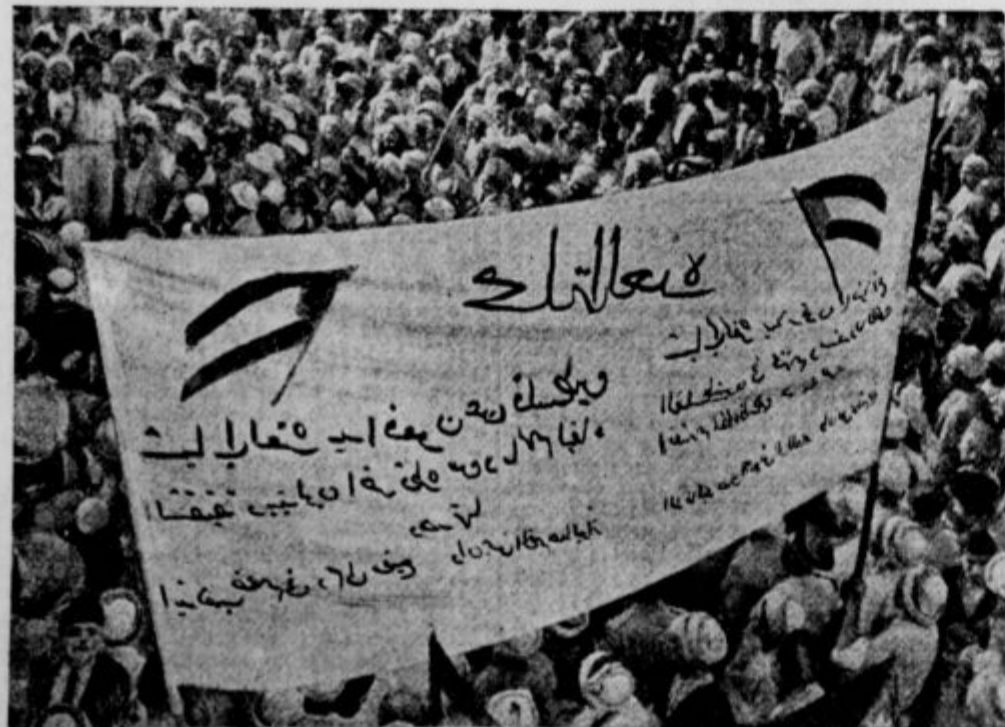
V Bagdadu razsajajo Arabci. Vedno bolj je razburjeno ljudstvo radi delitve Transjordanije in Palestine. V Bagdadu je bil velik shod Arabcev zoper judovske želje in za nedeljeno Veliko Arabijo