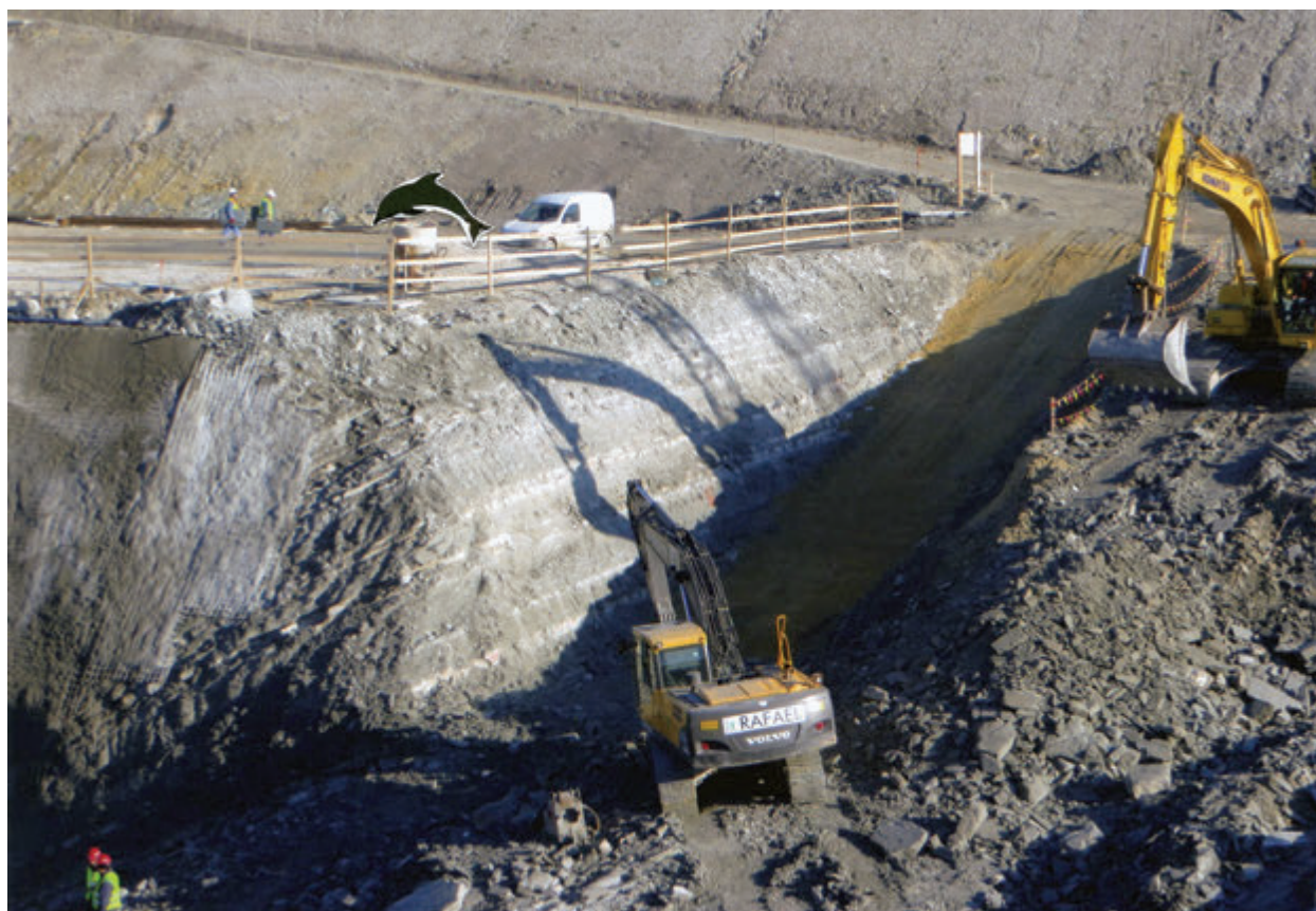
Slika 2. Najdišče delfiniovih ostankov v gradbeni jami Brežice Figure 2. The site of dolphin remains in excavation pit Brežice

Subordo Odontoceti Flower, 1867 Infraordo Delphinida Muizon, 1984 Superfamilia Delphinoidea Gray, 1821 Familia Kentriodontidae Slijper, 1936 Subfamilia Pithanodelphinae Barnes, 1985 Genus Champsodelphis Gervais, 1848