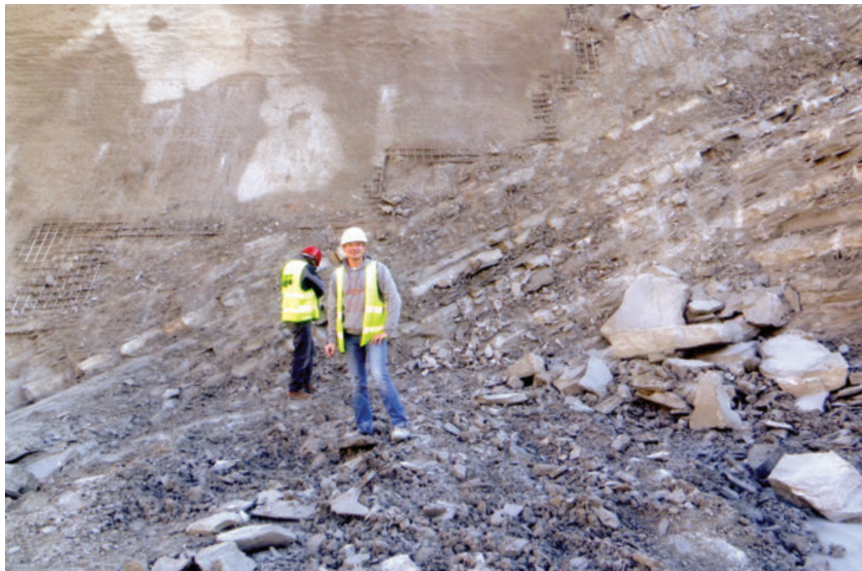
Slika 3. Sarmatijski laporovci pod najdiščem z ostanki delfina Figure 3. Sarmatian marlstones below site with dolphin remains

Opis: Ohranjen je distalni del desne nadlahtnice, ki je debelo ploščat in razmeroma čvrst (tab. 1, sl. 1a-1b). Na dorzalnem robu blizu spodnje sklepne površine (facies radialis) za koželjnico (tab. 1, sl. 1c) je velika deltoidna grbina (tuberositas deltoidea). Sklepna ploskev za koželjnico je široka in plitva, druga sklepna ploskev za komolčnico je ožja in bolj konkavna ter razdeljena na dve stični površini, večjo in manjšo (tab. 1, sl. 1d).