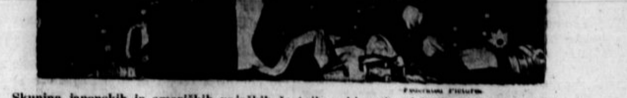
Skupina japonskih in ameriških vojaških častnikov, ki se je udeležila banketa v Tokiju.

Narocite Mladinski list, najboljši mesečnik za slovensko mladino!