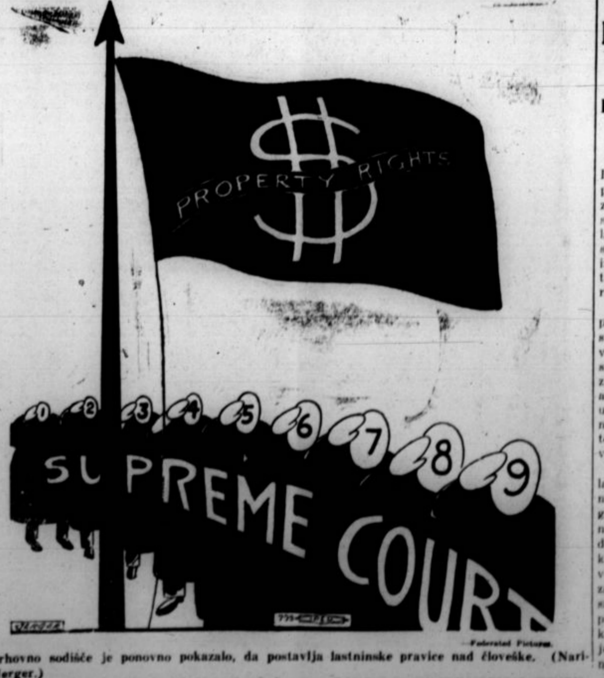
Vrhovno sodišče je ponovno pokazalo, da postavlja lastninske pravice nad človeške. (Narisanje Jerger.)

Na obravnavi so bili aretirani delavci obsojeni na mesec zapora vsak, "ker so podžigali na izgrede."