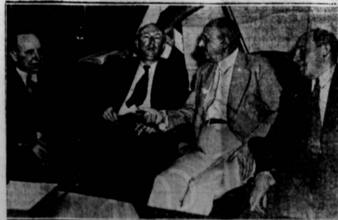
Vodilni "newdealerji" so bili silno iznenadeni, ko je vrhovno sodišče proglasilo zakon obnove za neustavne. Od leve proti desni: Stanley Reed, senator Harrison, justični tajnik Cummings in Donald R. Richberg.

Ljudi in njihovih del bi z Marsa ne opazil pač na bi se zemlja Marsovec gleda ne najja in mikavnejša od Venera. Na Marsu nem ni poletja, njegovo ozračje je silno preženo z oblaki. A ti oblaki letijo v visoki km, torej trikrat višje nego pri nas. Marsovo ozračje je podobno našemu, a težka, da bi se v njem dihali. Imeli bi tam občutek, da se nalo visoki gori. Zjutraj in zvečer je vedno megla in ponoči je še bolj občutno podnevi."