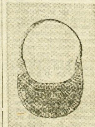
Luničast uhan okrašen z gravuro