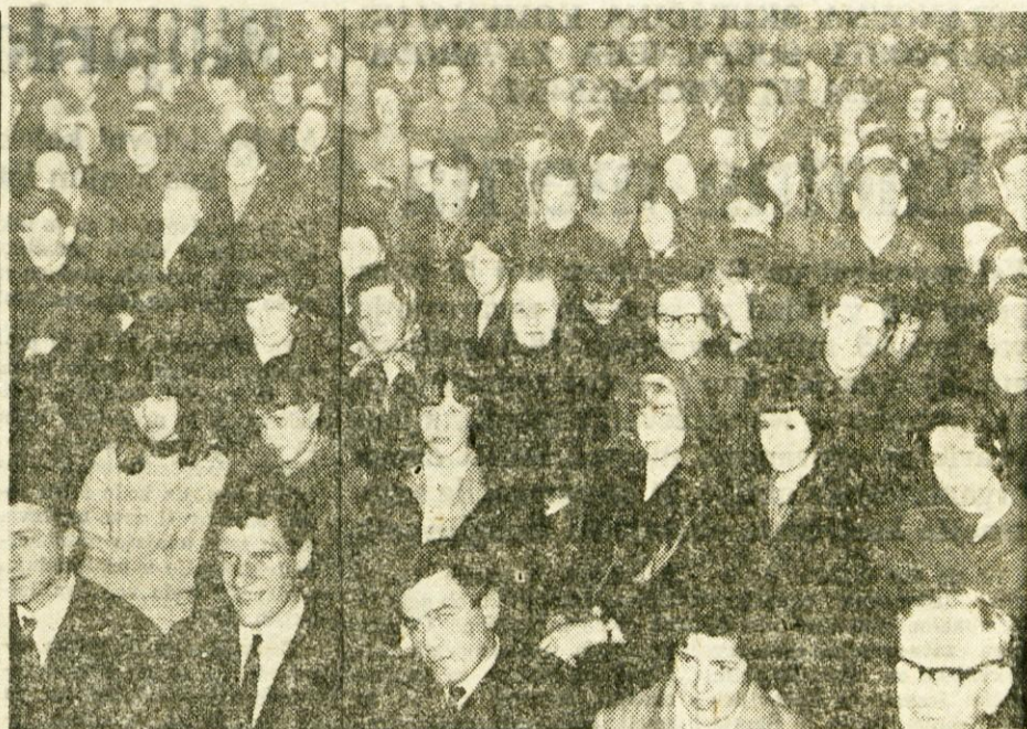
Domala tisoč obiskovalcev se je magnetno v evorano. Doživeti so dve uri razvedrila in napetega pričakovanja.