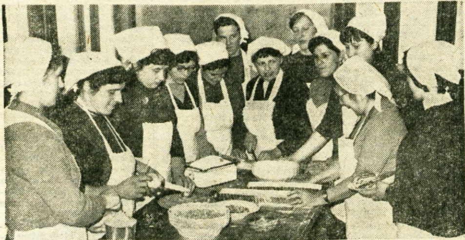
25 deklet iz bližnje in dalnje okolice Zmncina se je naučilo kuhati. Na sliki: Z zaključka tečaja pretekli ponedeljek

Da bi odstranili posledice lanskih poplav Save Dolinke in njenih hudournikov pri tokov, bodo letos uredili most čez Savo na Hrušici, zavarovali obrežje Save pri Martuljku in Na Savi na Jesenicah ter druga najkritičnejša mesta. Za ta dela je predvidenih okroglo 410 tisoč novih dinarjev. Okroglo 100.000 novih dinarjev (10 milijonov starih) pa bodo, kot je sklenila občinska skupščina, dodelili prizadetim krajevnim skupnostim za manjša zavarovalna dela in odpravo škode od poplav na tem območju. — B. B.