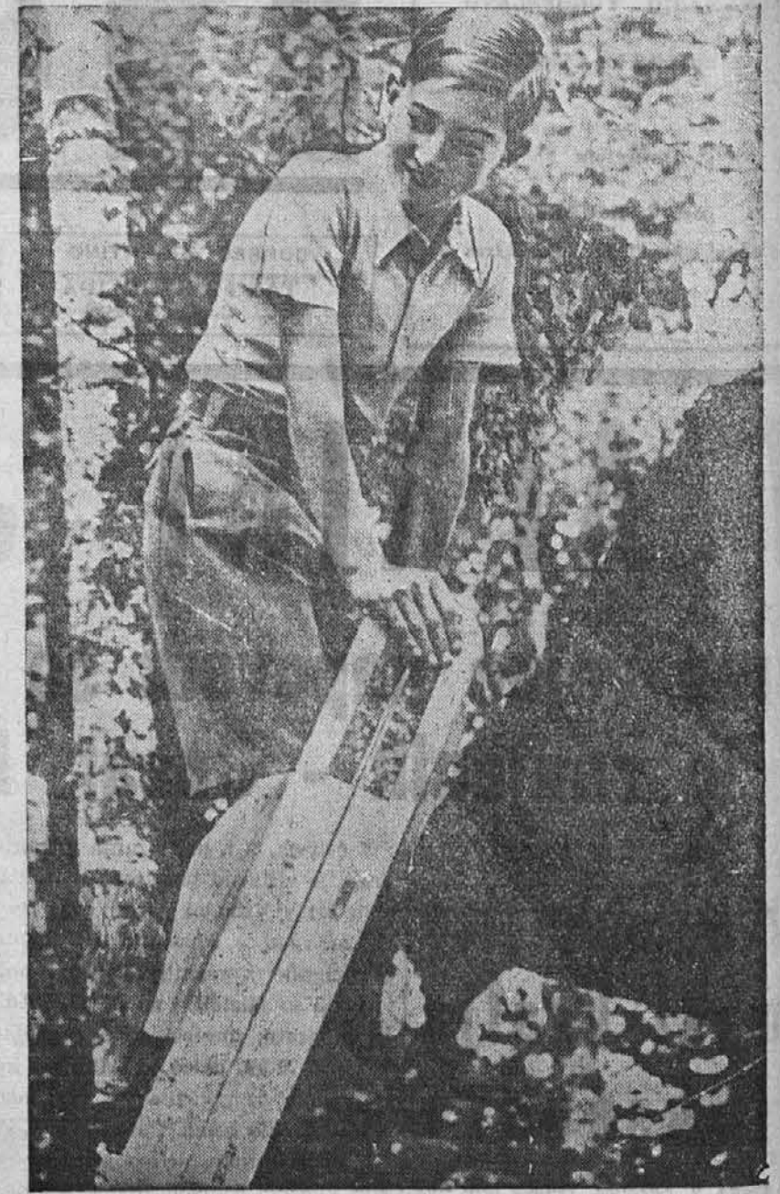
Kralj Petar II. mladi vladar Jugoslavije, Milan v kraljevskem vrtu na svoj rojstni dan, 6. septembra t. l.

Dne 12. oktobra, to je ravno na dan obletnice zaključka Evarh. Kongresa, se pripravča vsem možem in fantom, da se udeležijo pontifikalne sv. maše ob pol 9 uri na Plaza de Mayo. Zraven zgodovinske piramide bo postaviljen oltar, pri katerem bo tukajšnji nadškof služil sv. mašo. Med Sv. mašo bo 50 duhovnikov delilo sv. obhajilo za moške. Priporočila se vsem tistim, kateri niso pončei mogli opraviti snavadi, da bo v istem času v hišnji katedrali na razdaljo veliko številu spovednikov. Istega dne ob 3. popoldne vrši iz Plaza de Mayo po Av. de Mayo na Plaza Congreso svečana procesija, katere se udeležijo tudi sern predsednik tukajšnje Republike, Genl. Augustin P. Justo v spremstvu številnih škofov, diplomatov, ki so v o-stalih članov vlade. Kakor lansko leto, bo tudi letos sodokovalno okrog 9000 članov namožno nalite, tako da bo red nonolnoma zasotvlien. Tokrat se mi Slovenci svečane procesije ne