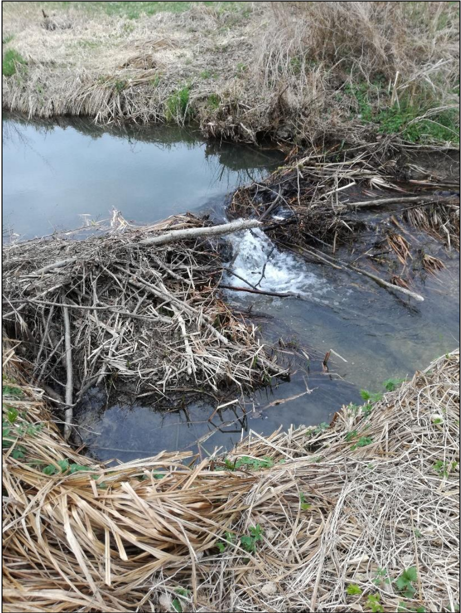
Slika 3. Bobrov jez na Senuši.