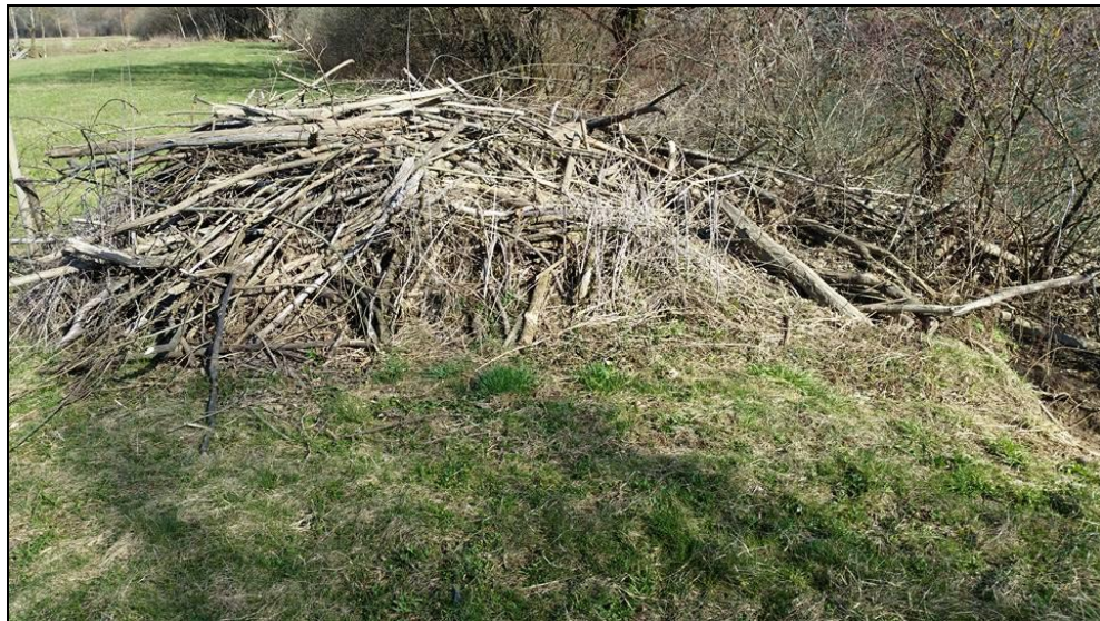
Slika 2. Bobrišče na Radešici.

Figure 1. Map of the Krka River catchment with its tributaries and locations of beaver colonies, with marked research area within Slovenia.