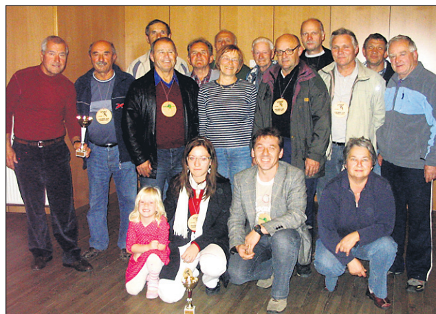
Udeleženci kolesarske akcije S kolesom na Areh iz našega področja.

Kolesarjenja se je udeležilo veliko število kolesarjev iz različnih krajev. Zaključek prireditve je bil v kulturnem domu v Sp. Hočah, kjer je bilo v uvodu potopisno predavanje o potovanju s triciklom iz Floride do Kalifornije, za katero