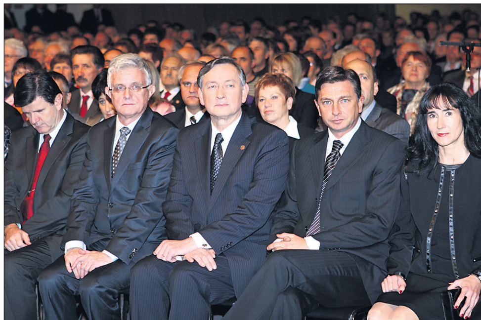
Med udeleženci osrednje državne proslave ob letošnjem dnevu Rudolfa Maistra so bili ob predsedniku države dr. Danilu Türku tudi številni drugi slovenski politiki, med njimi predsednik vlade Borut Pahor z življenjsko sopotnico, predsednik državnega zbora Pavle Gantar in predsednik državnega sveta Blaž Kavčič.

vo, in če je potrebno, tudi energično skrbeti za svoje nacionalne interese. To velja za vsa področja politike, od kmetijskih subvencij do zunanje politike in vseh vprašanj, povezanih z nadaljnjo širitvijo EU. Prav tako mora Slovenija ohraniti tiste pridobitve iz svoje preteklosti, ki so potrjene z mednarodnimi pogodbami. Tako je potrebno spoštovati in uresničevati tudi mednarodnopravno določene pravice manjšin. To prizadevanje ni zastarelo ali preživeto, prav nasprotno, poudarja predsednik države, je eden kritičnih preizkusov resnosti današnje Evrope, ki razume pomen vladavine prava. Prizadevanje za pravice manjšin je