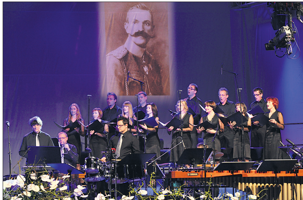
Kulturni program je potekal pod naslovom Maistrova dediščina. Osvetlil je njegov lik vojaškega poveljnika, državotvorca in pesnika.