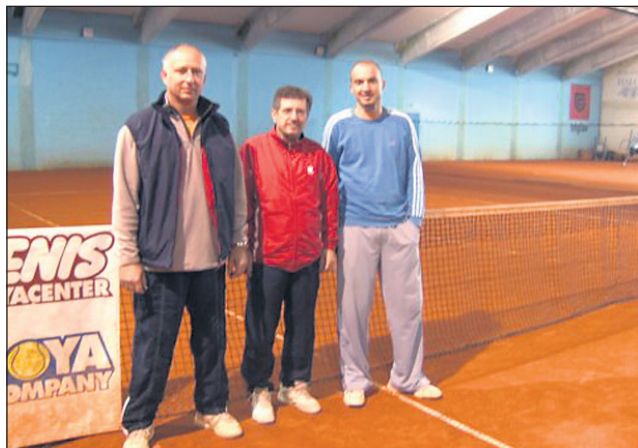
Ekipa TK Šumari

Rezultati 2. kroga: ENIGMA – TK GORIŠNICA 1:2 (A. Korošec – Krajnc 5:9, Cunk – Žnidarič 9:6, Cunk/A. Korošec – Simonič/Krajnc 5:7); TK ŠTRAF – TK SKORBA GAD 2:1 (B. Korošec – Šlamberger 5:9, Debeljak – Dobnik 9:5, B. Korošec/Štrafela – Ogrinc/Dobnik 8:5); ŠUMARI – KOVINARSTVO ŠPUREJ 3:0 (Sternad – Kolarič 9:2, Gulin – Iljevec 9:8,