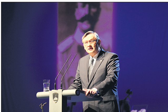
Slavnostni govornik je bil predsednik države dr. Danilo Türk: »Brez odločnosti in sposobnosti generala Maistra bi celotna kasnejša zgodovina Slovencev potekala drugače.«

»Z odločno akcijo je bila ustvarjena učinkovita podlaga slovenske državnosti. Brez te odločnosti in sposobnosti generala Maistra bi celotna kasnejša zgodovina Slovencev potekala drugače. Malo verjetno je, da bi brez njegove odločnosti sploh dočakali našo neodvisnost in državno samostojnost. Zato je prav, da se vsako leto spomnimo njegovih velikih dejanj in njegovih zaslug za to, da Slovenci obstajamo kot suveren narod in da imamo svojo lastno državo. Pomislimo samo na Maistrovo tveganje in sposobnost mobilizirati 4000 prostovoljcev za obrambo severne meje v manj kot mesecu dni v novembru leta 1918. Podvig teh razsežnosti ob koncu prve svetovne vojne, ko so bili ljudje naveličani orožja in ob pomanjkljivih komunikacijah zasluži vse možno občudovanje. Rudolf Maister je s svojim življenjem in delom pokazal, kako se vojaški poklic povezuje s kulturno občutljivostjo in z domovinsko zavestjo. Ta vzor je tudi danes pomemben ne le za ljudi vojaškega poklica, ampak za vse nas. Izročilo njegovega življenjskega dela moramo razumeti celovito in prav je, da se vprašamo, kaj pomeni njegovo izročilo v današnjem času in kaj so naše dolžnosti, če želimo biti vredni njegovega spomina,« je med drugim poudaril predsednik države dr. Danilo Türk.