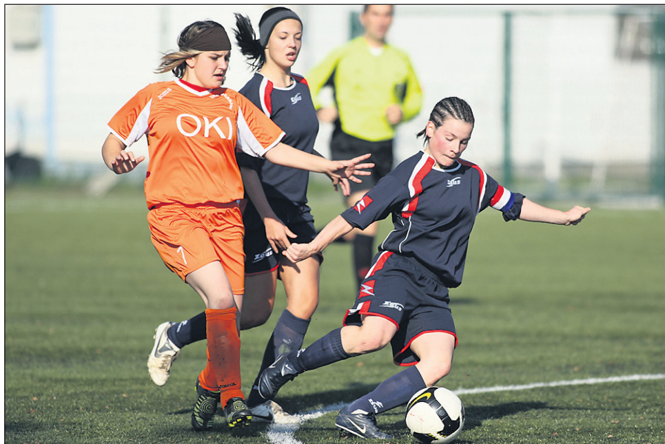
Ptujčanke (temni dresi) so tokrat imele priložnost za ugodnejši rezultat, Dornavčanke pa ne.