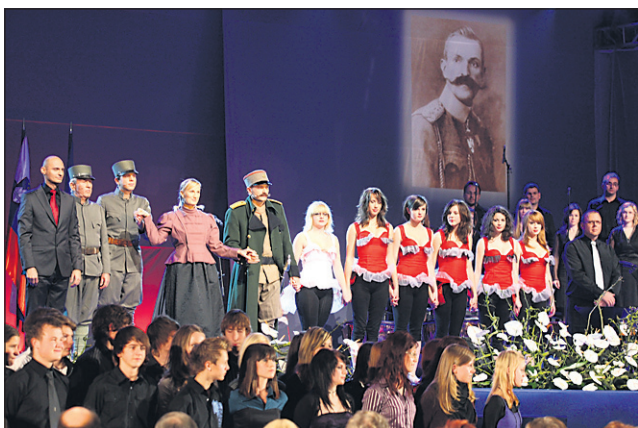
Oder so si delili glasbeniki, pevci, igralci in plesalci.