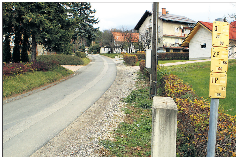
Vodova ulica je ena najbolj prometno nevarnih ulic na območju ČS Ljudski vrt. Že dolgo kliče po ureditvi pločnika in varne poti v šolo.