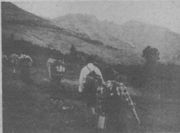
Na poti proti Solunski glavi