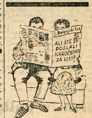
ALI STE ŽE POSLALI NAROČNINO ZA LIST?