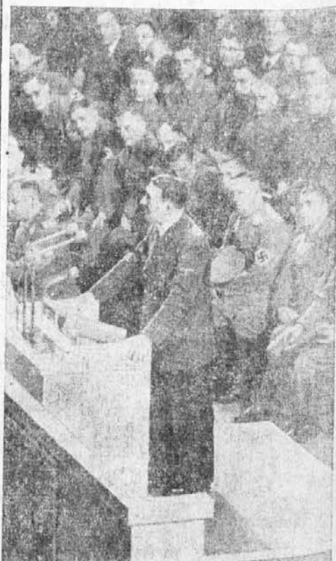
Vodja Nemčije Adolf Hitler govori nemškemu narodu ob osmi obletnici vlade nacionalnega socializma

× Na dan poroke izročijo japonske neveste svojim staršem vse darove, ki so jih prejeli od sorodnikov in znancev, da se na ta način vsaj malo oddolžijo staršem za trud, ki so ga imeli z njimi, ko so jih vzgajali.