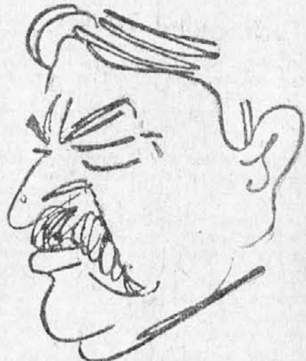
Aristide Briande (karikatura)

svojega nasprotnika. Briand je čestokrat nervozno bobnal s prsti po mizi, takrat so vsi vedeli, da premišljuje nekaj važnega. Ko je nekoč obiskal grob nemškega državnika Stresemanna in položil venec, so prisotni opazili, kako so Briandu