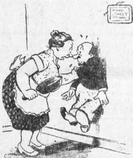
— Jaz te ljubim in nobena druga, zapomni si to že enkrat!

Marsikomu ni znano, da je naše navadno seno izvrstno zdravilo. Seno (ali še boljše seneni zdrčob) je treba dobro skuhati v vodi. Ta voda je posebno priporočljiva za kopeli vsem onim, ki trpijo na revmatizmu ter raznih obolenjih kosti. Kopeli morajo biti precej vroče, lahko so parne ali pa vodne. Kopanje v vodi, v kateri se je prekuhalo seno, izvrstno deluje na živce in krvni obtok.