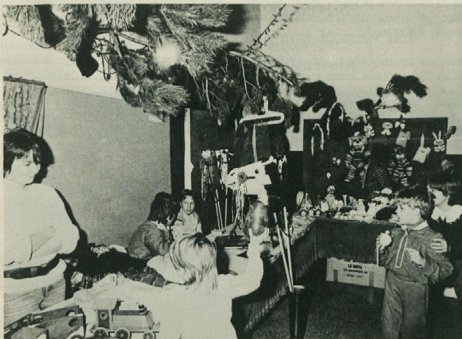
December, mesec praznikov. Začelo se je z Miklavžem (na sliki prireditve openskega društva Tabor) in končalo se bo januarja. Z darili, ki so nam jih pripravili vlada, Total in podobni, verjetno ne bodo med najlepšimi.