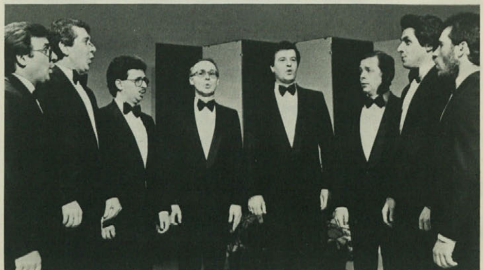
Tudi Tržaški oklet slavi letos obletnico ustanovitve. 15-letni trud in uspehe bo proslavljal v torek 17. decembra ob 20.30 v Kulturnem domu v Trstu.

Srečno in uspešno novo leto želi vsem članom, sodelavcem in prijateljem Slovenski raziskovalni inštitut