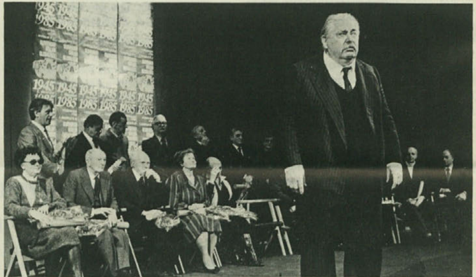
2. decembra je Slovensko stalno gledališče proslavljalo 40-letnico ustanovitve. Na sliki vidimo prizor nedeljske slavnostne prireditve.

Srečno in uspešno novo leto želi vsem članom, sodelavcem in prijateljem Slovenski raziskovalni inštitut