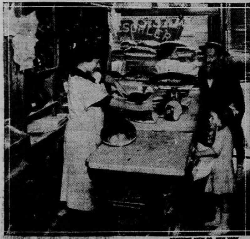
REVIEWS VIEW CO., NEW YORK

V New Yorku je poldrugi milijon Židov. Ob židovskih praznikih so newyorške židovske trgovine dobro preskrbljene s kruhom, a kršnega propisuje židovska vera.