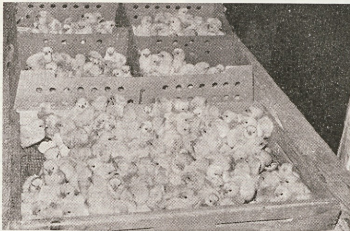
Vitalnost — znak kvalitete

Tone Pučko, inž.