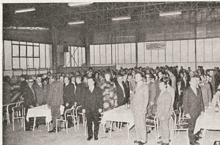
Slovesnost za dan republike je začela s himno v izvedbi godbe na pihala »Svoboda«