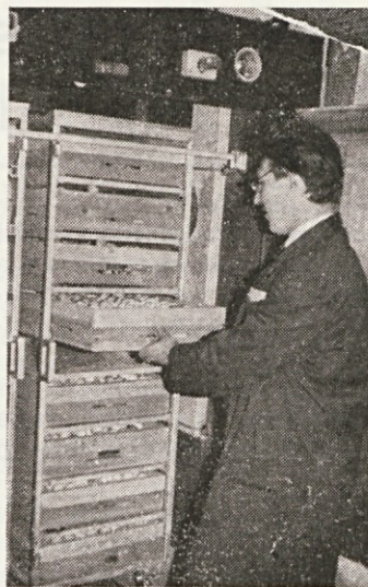
Veselje ob bogatem zarodu

Prve dni v januarju bodo začivkali piščanci: za 2,5-krat več jih bo. Namenjeni so gospodinjstvom na področju SOZD. Ostalo bo jih tudi za