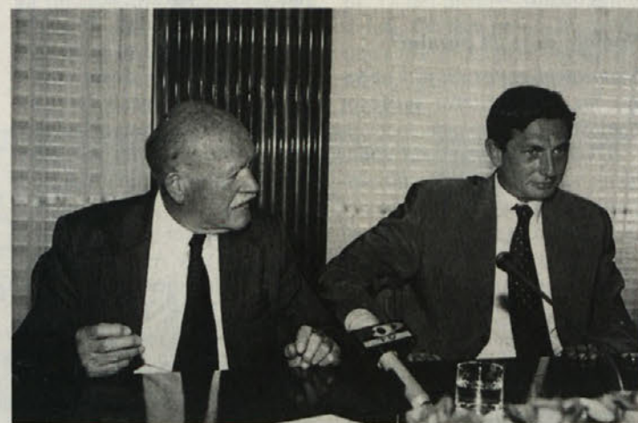
France Bučar in Borut Pahor: prvi in zdajšnji predsednik Državnega zbora

Čeprav je vsak iz svojega zornega kota osvetlil svoje poglede na dogajanje pred desetimi leti, ko se je Slovenija morala z orožjem postaviti za svojo osamosvojitve, je skupna izpoved bila jasna: brez enotnosti Slovencev ter soglasne podpore vseh strank projektu osamosvojitve, predvsem pa brez podpore medijev, bi Slovenija s tem velikim zgodovinskim projektom neprimerno težje uspela. Temelj osamosvojitve je bil plebiscit 26. decembra 1990, ki ga je podprla absolutna večina Slovencev ter državljanov neslovenskega rodu. Predlog za plebiscit je prišel iz vrst DEMOSa, takratne vladne koalicije,