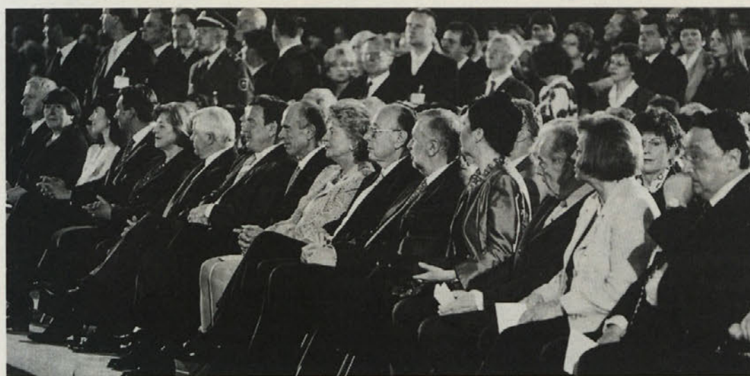
Vrsta častnih gostov 25. junija na osamosvojitveni slavnosti na Trgu republike v Ljubljani

Niz uradnih proslav desete obletnice samostojnosti, ki je kot »dan državnosti« tudi uradno državni praznik Slovenije, se je začel s slavnostno sejo državnega zbora. Predsednik Borut Pahor je osamosvojitve Slovenije imenoval izjemno in prelomno dejanje brez primere, pogojeno z zmago demokratičnih sil in kot rezultat demokratičnih odločitev. Posebej se je zahvalil vsem takratnim političnim akterjem v DEMOSovi vladi in drugih političnih usmeritvah, ki so imeli demokratično legitimirane plemenite cilje. Zato jih je mednarodna skupnost tudi priznala. Slovenija,