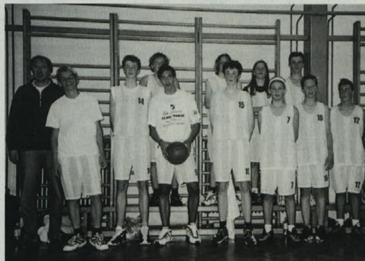
Ekipa KOŠ-a je potrdila svojo vlogo favorita

dobro organizacijo jubilejnega srečanja ter obenem izpostavila njegov velik pomen za mladince iz zamejstva v smislu krepitve športnega sodelovanja in graditve prijateljstva med slovensko mladino iz štirih sosednjih držav. Pomen športa pri oblikovanju slovenske identitete v zamejstvu ter pri sodelovanju preko državnih meja je posebej poudarila tudi državna sekretarka Tovornikova, ki je v svojem govoru čestitala vsem aktivnim udeležencem srečanja kot tudi organizatorjem in odgovornim za šport v zamejstvu. I. L.