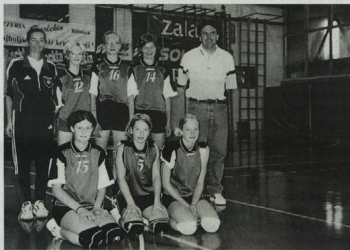
Odbojkarice so po daljšem odmoru spet zmagale na srečanju