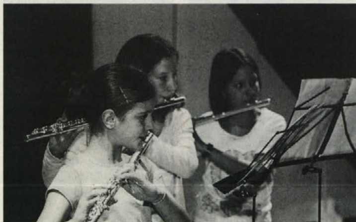
Trio prečnih flaut iz Šmihela