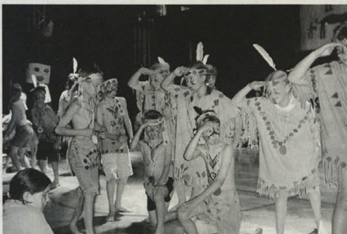
Pisanost plesalcev indijanskih plesov

Otroci so se udeleževali na kreativnem področju in ustvarili kar nekaj umetnin, npr. velik totem iz škatel, totem iz usnja, pri katerem so otroci pokazali svoje spretnosti v šivanju, pa indijanske obleke s tiskanimi motivi in lesenimi kroglicami. Izdelovali so loke in puščice ter naglavno okrasje iz pisanih pe-