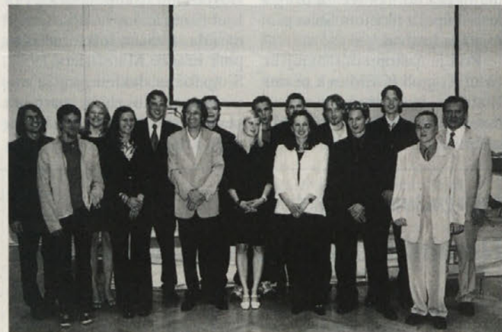
Letošnji maturantje dvojezične TAK