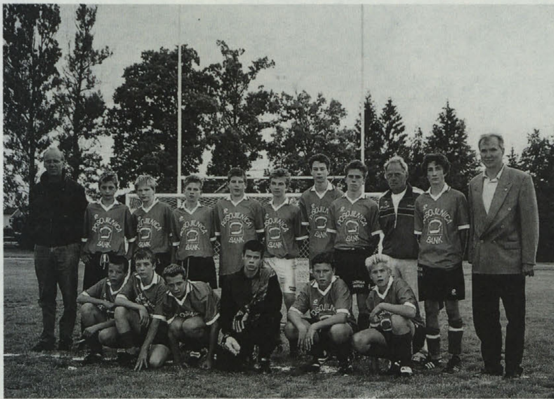
V nogometu je ekipa SŠZ s smolo postala »lex« tretja