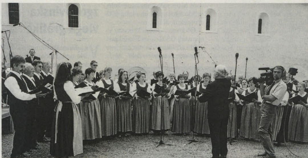
Zbor »Gallus« je sooblikoval bogoslužje na Krki