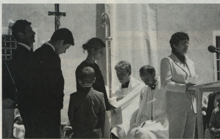
Družina Kargl je škofa nagovorila v obeh jezikih

ni deloval umetelno, ampak iskreno. Nagovoril je dejansko vse plasti prebivalstva, od cerkvenih sodelavcev do klera, od žensk do duhovniškega in redovniškega naraščaja, mladino in zakonce, tudi ločene.