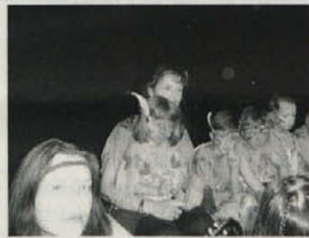
Indijanka Mali beli oblak v naročju vzgojiteljice