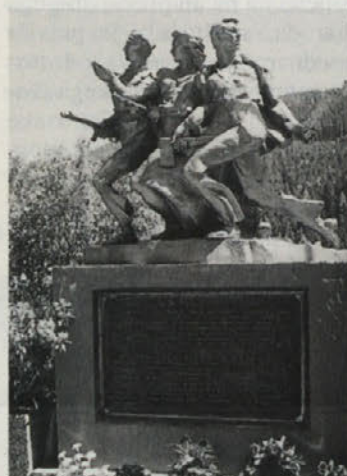
Partizanski spomenik pri Peršmanu