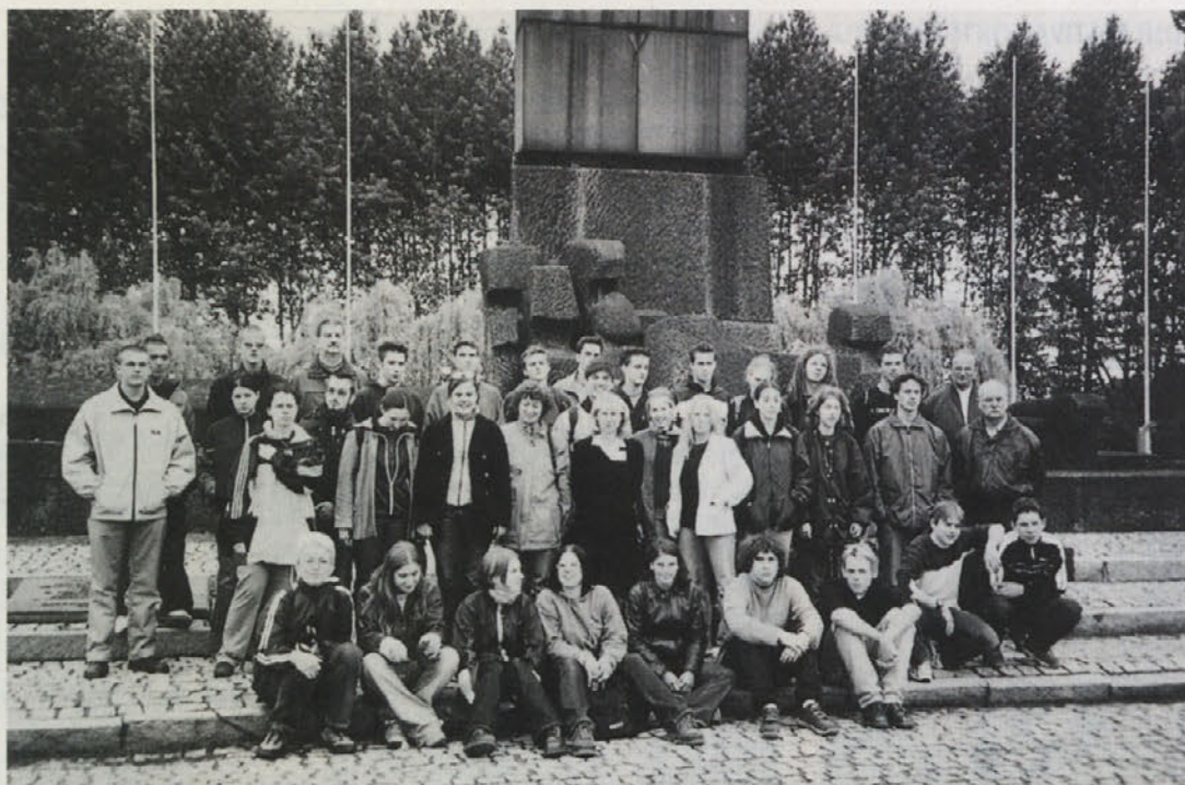
ZVEZNA GIMNAZIJA ZA SLOVENCE

Že petič (od 97. leta dalje) sta se oba sedma razreda slovenske gimnazije v Celovcu napotila na potovanje na Poljsko, tokrat od 2. do 6. junija. V prvi vrsti je pri tej ekskurziji šlo za obisk koncentracijskega taborišča Auschwitz-Birkenau.