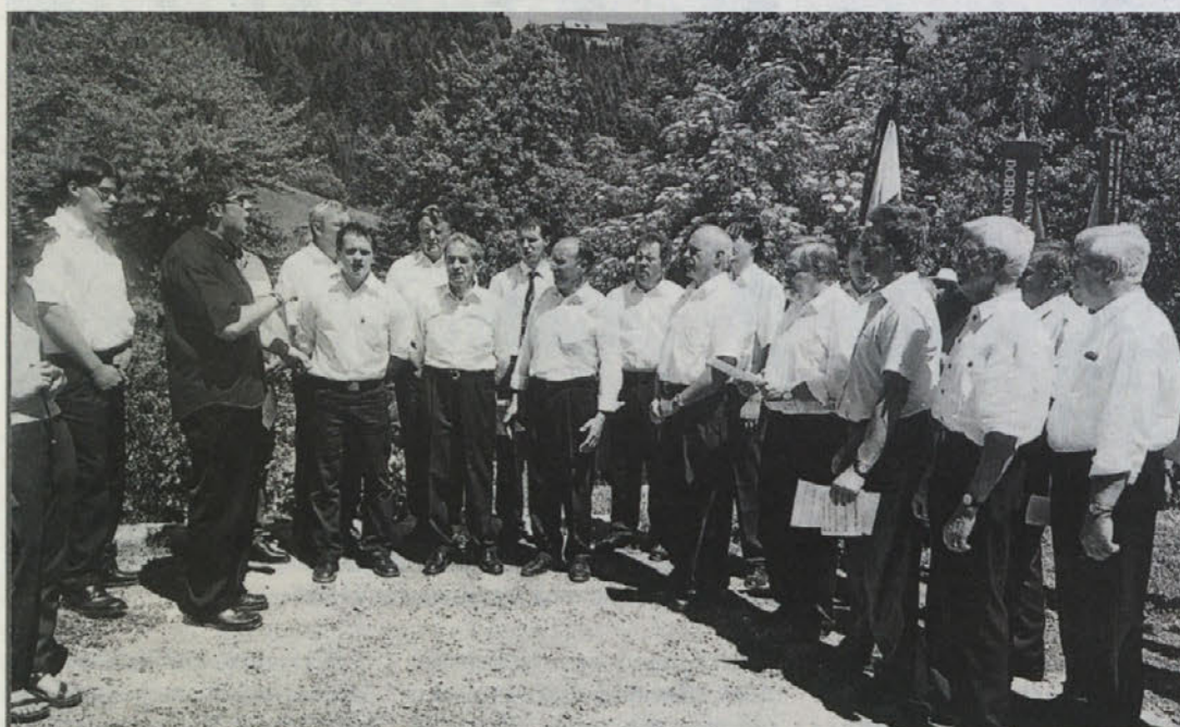
Moški pevski zbor »Foltej Hartman« iz Pliberka

Predsednica Zveze slovenskih žena je podprla politiko dialoga. Naglasila pa je, da obstajajo določene meje. Dialog bi moral potekati na osnovi medsebojnega spoštovanja in sožitja, v ospredju naj bi bilo urejanje odprtih vprašanj. Dialog ne bi smel dajati vtisa političnih kupčij, podločnosti, vtisa zavedanja in strahu, da bi kritične besede na račun deželnega glavarja lahko škodoval dialogu. Tudi taktika zavlačevanja v tem dialogu nima mesta, ker pospešuje le asimilacijo, obenem pa pripadnike narodne skupnosti deli na ekstremiste in na pridne. Predvsem pa ne bi smeli pristajati na to, da sta v pogo-