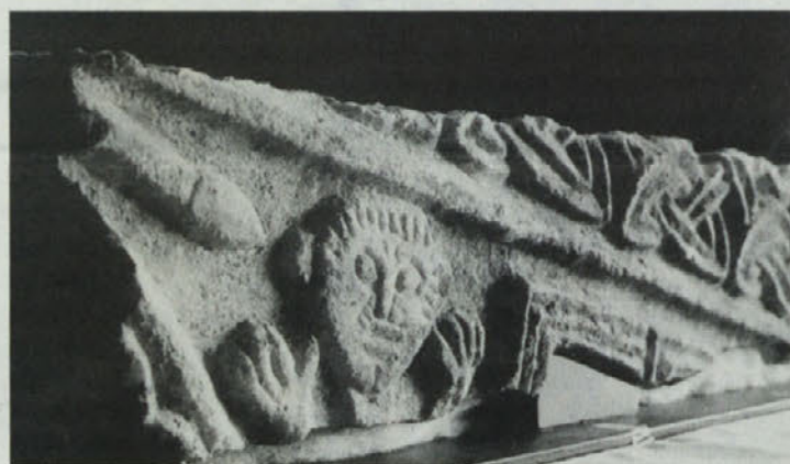
Motiv s pletenim vzorcem iz Molzbichla na Koroškem

ljudstev ter elementom in oblikam njihove državnosti.