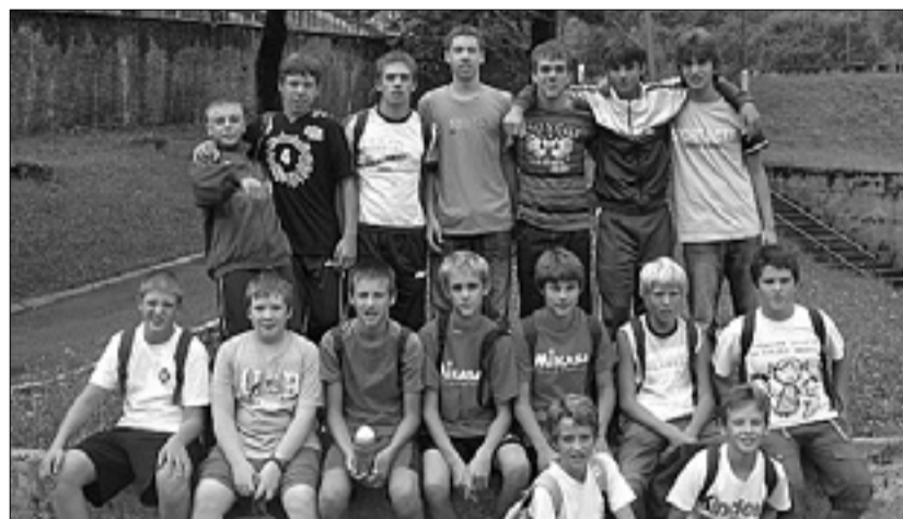
Ekipi Olympie U14 in U16 na pripravah v Bovcu