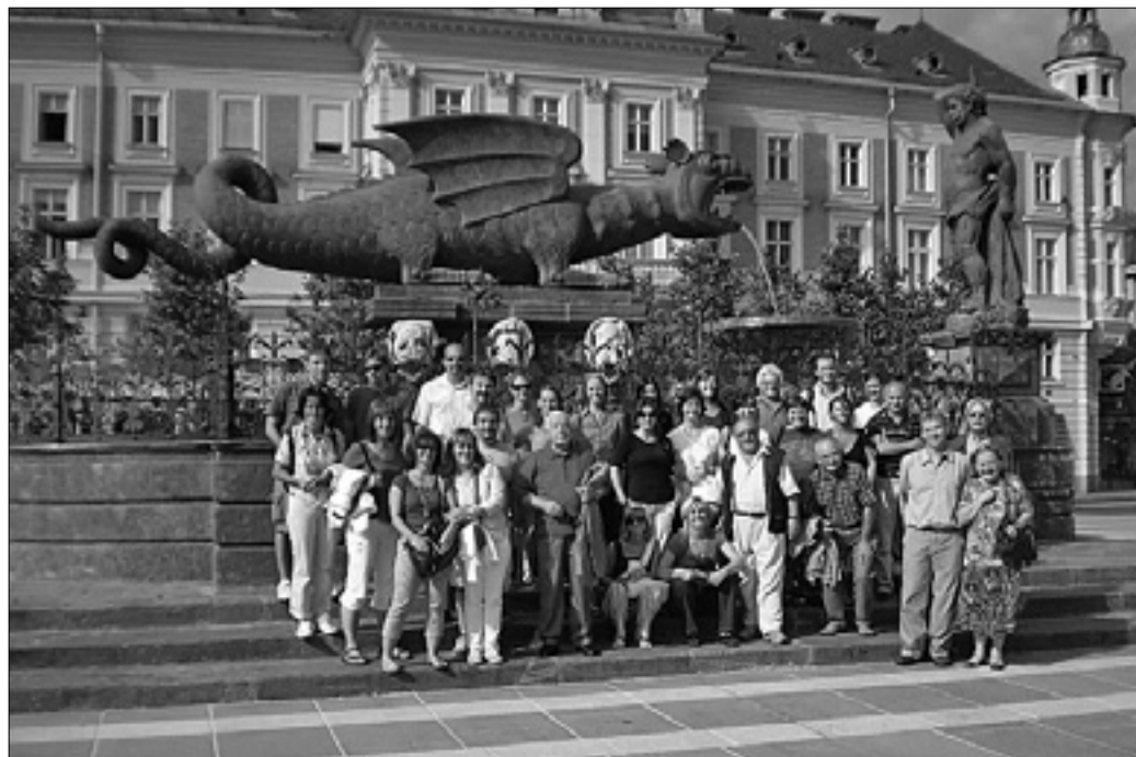
Gasilska fotografija udeležencev letošnjega seminarja v Celovcu

»Tovrstni seminarji so zelo koristni, ker ti postrežejo z različnimi realnostmi, ponudijo ti nove izzive in prijeme,« je ocenila Sističeva. Prav tako dober vtis je imel Pučnik, saj je med skupnostmi seveda veliko razlik, je pa tudi več podobnosti, tako da je tako srečanje izziv za rast in razvoj. (sas)