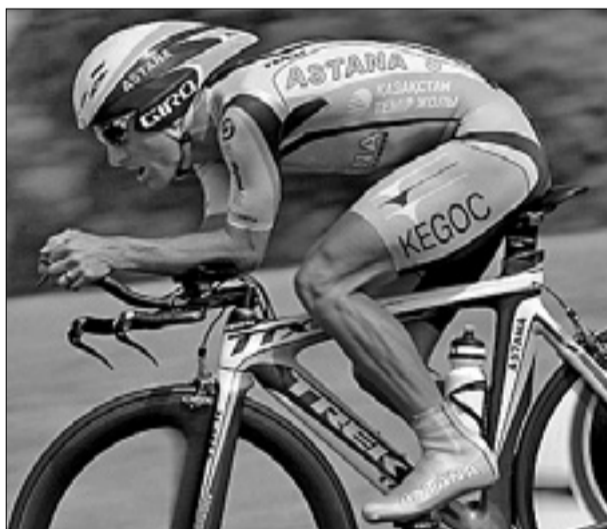
Američan Leipheimer je bil na vožnji na čas najhitrejši