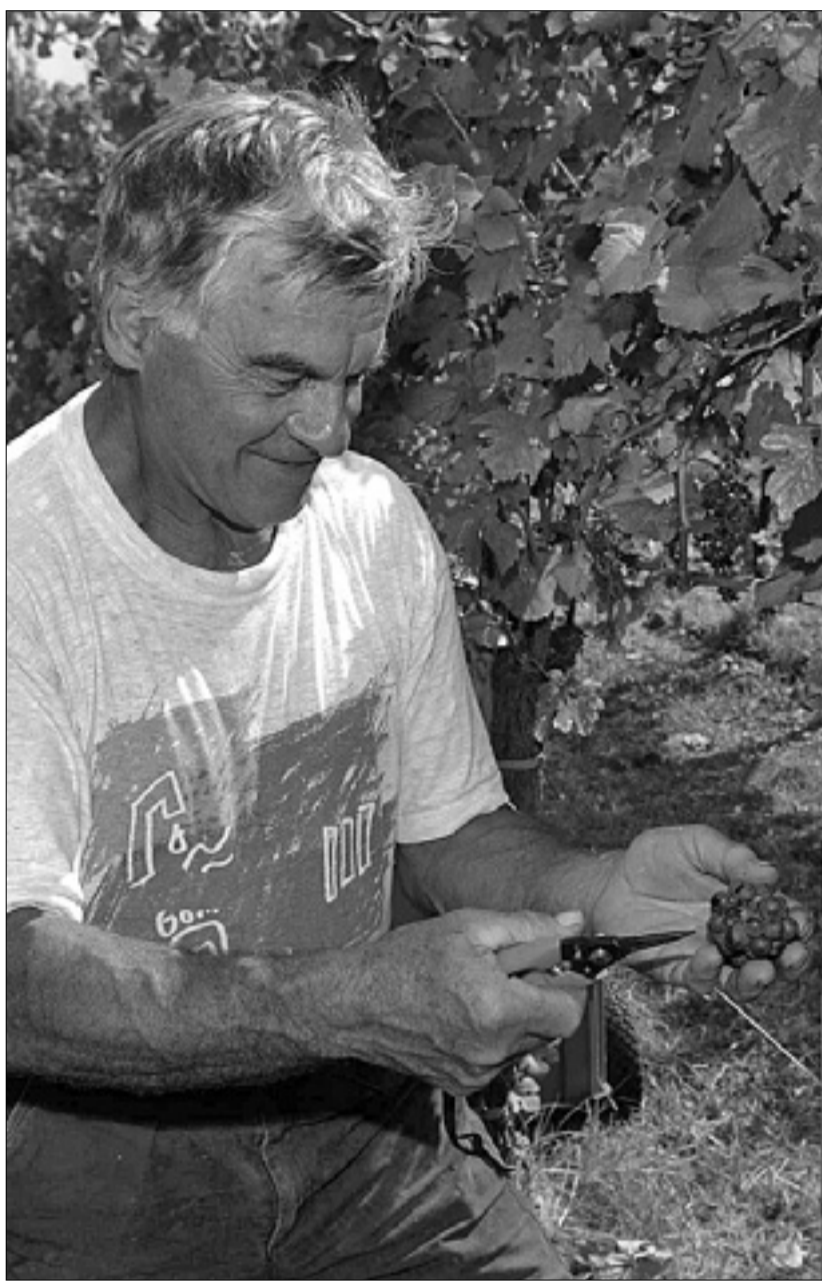
Včeraj so trgali grozdje v Langovem vinogradu na Bukovju