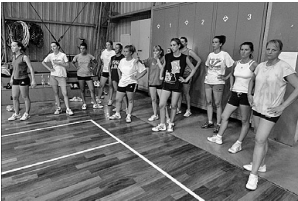
Združena ekipa Bor Breg že redno trenira