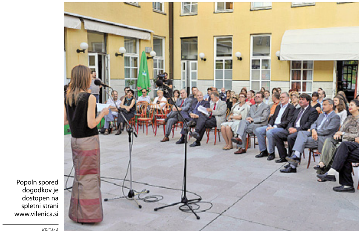
Popoln spored dogodkov je dostopen na spletni strani www.vilenica.si