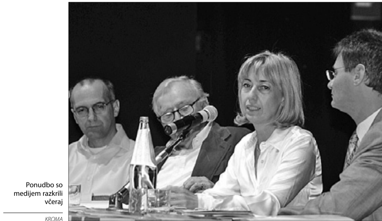
Ponudbo so medijem razkrili včeraj