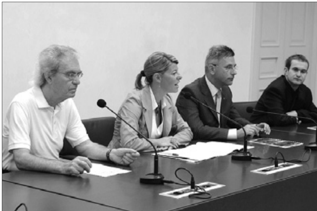
Pobuda so predstavili včeraj v deželni palači

Nastopili bodo mladi pevci in plesalci - Na sporedu bo tudi lepotno tekmovanje La ragazza d'Italia