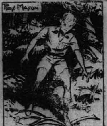
Toda v svoji neprevидnosti je stopil na suho vejo, ki je počila. Divjakove oči so se odprle.