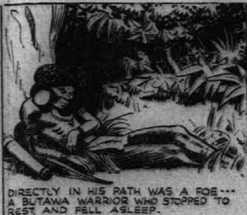
DIRECTLY IN HIS PATH WAS A ROE- BUTAWA WARRIOR WHO STOPPED TO REST AND FELL ASLEEP.