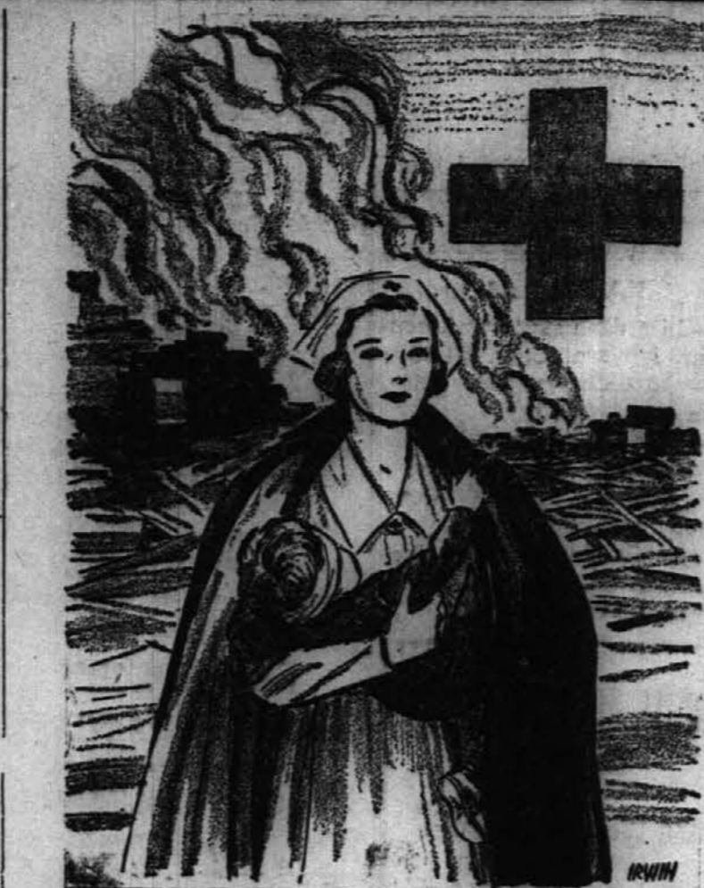
Ameriški Rdeči križ vodi točano kampanjo, da zbira med prebivalstvom znesek 50 milijonov dolarjev. Vsakemu večjemu mestu je bila nakazana kvota, koliko se pričakuje od njega. Chicaška kvota je $3,750,000. Polovica od omenjenih 50 milijonov bo šla za pomoč vojaštvu ostalo pa po večini za razne civilne potrebe.

Rad bi tudi opozoril take delodajalce, da mnogi izmed njih "inozemcev", ki so jih odpustili, imajo sedaj svoje sinove v naši vojski ali mornarici. Izmed njih, ki so umrli boreč se proti izdajalnim napadom na Manilo in Pearl Harbor, bili so možje, katerih ime je bi-