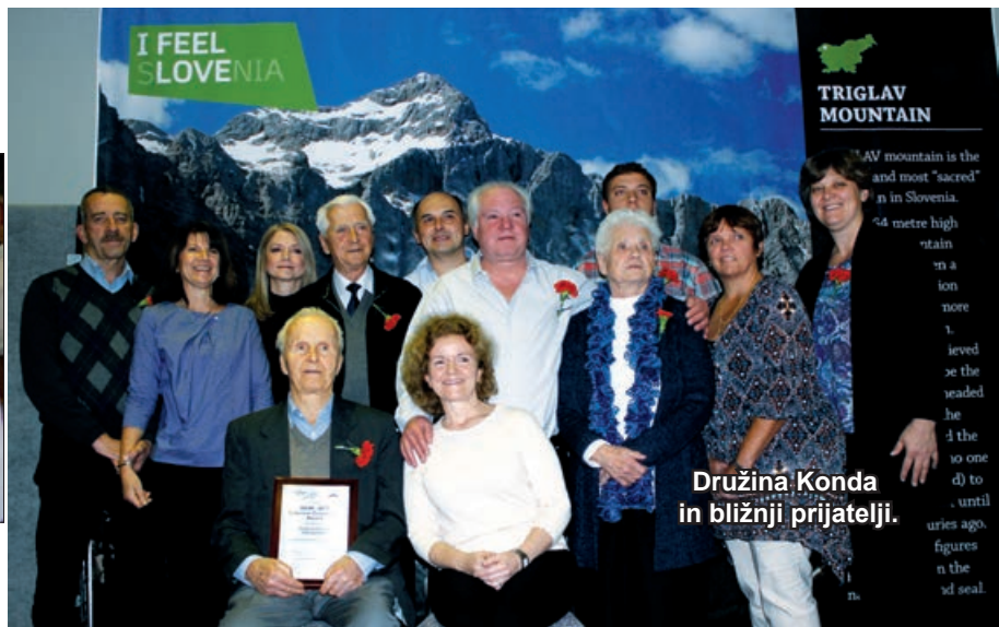
Družina Konda in bližnji prijatelji.