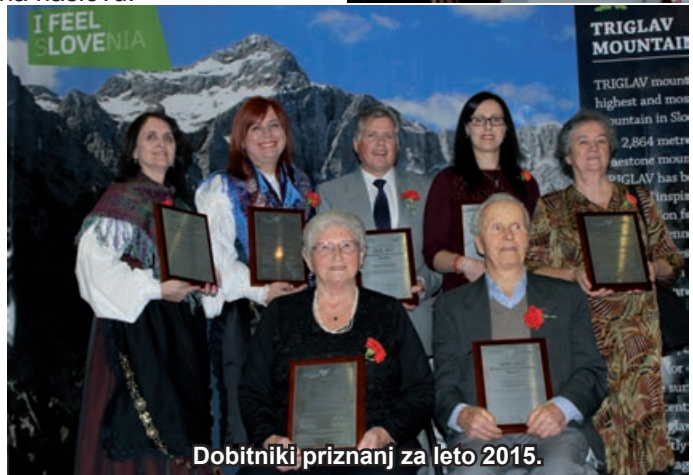
Dobitniki priznanj za leto 2015.