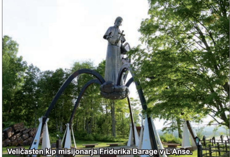
Veličasten kip misijonarja Friderika Barage v L'Anse.

Ogledala sva si lepo mestno središče Downtown Chicaga, ki je bilo vse v znamenju festivala, katedralo Holy Name – svetega imena, kjer je sedaj nadškof hrvaškega pokolenja dr. Blase J. Cupich, nato pa krenila na romarsko pot proti severu na obisk krajev misijonskega delovanja škofa Friderika Barage.