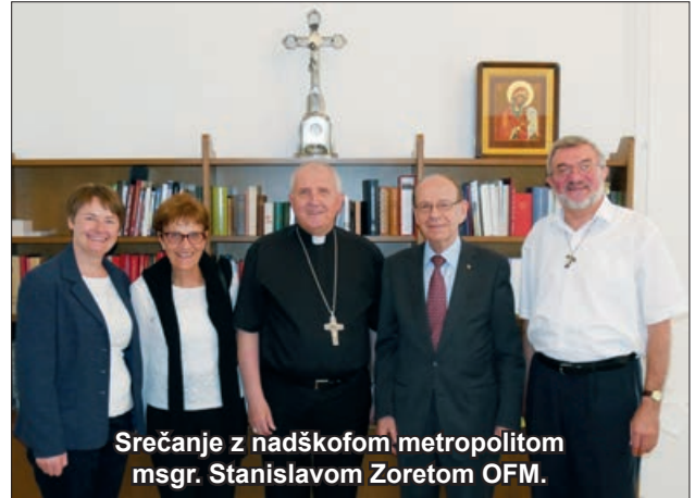
Srečanje z nadškofom metropolitom msgr. Stanislavom Zoretom OFM.