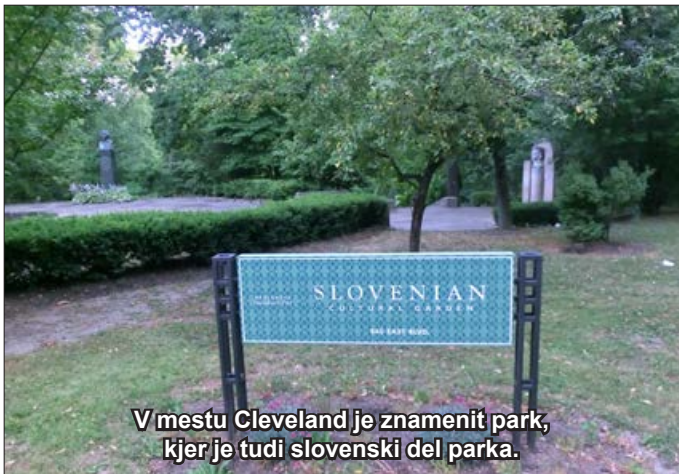
V mestu Cleveland je znamenit park, kjer je tudi slovenski del parka.