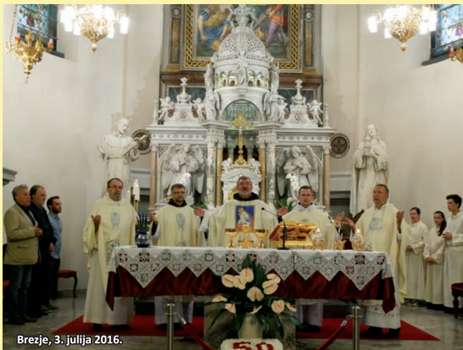
Brezje, 3. julija 2016.