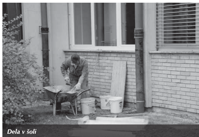
Dela v šoli

tudi člani strelskega društva bodo imeli boljše pogoje za delovanje. Tako se v Trzinu prepleta dobro in manj dobro, ker pa, kot radi rečemo, upanje umira zadnje, tudi mi upamo, da bo dobro tako prevladalo nad slabim, da ne bo več omembe vredno, in tako o slabem tudi pisati ne bo treba več.