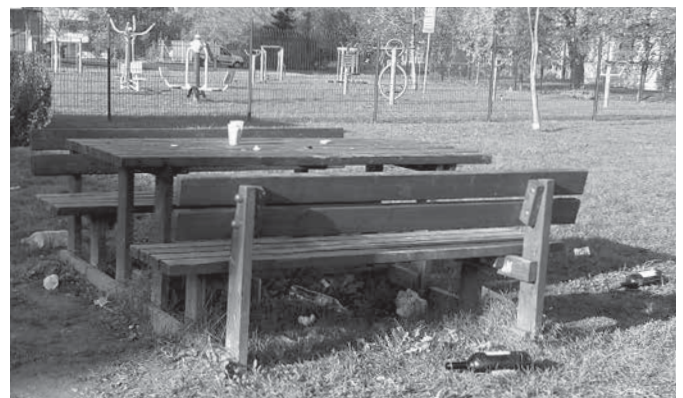
Jutranja trzinska idila na otroškem igrišču za osnovno šolo v soboto, 26. 10. 2013, oziroma na začetku krompirjevih počitnic.

Tudi tisto med osnovno šolo, krajevno knjižnico in bližnjimi bloki, kjer se mladina redno zbira ob koncih tedna, najpogosteje v petek in soboto zvečer, ko si želijo bližnji in pogosto tudi daljni stanovalci oziroma prebivalci Trzina nekoliko odpočiti od naporenega delovnega tedna. To pa vsak teden ni mogoče, saj morajo mladi na bučen način proslaviti vsak konec tedna ali pa dvo in večdnevno prekinitev šole in si v večernih urah zelo glasno povedati, česar si niso utegnili med tednom. Seveda nismo izmerili, ali pri tem redno prekoračujejo predpisanih 35 dB med 22. in 7. uro, pa vendarle ni hrup edini problem, ki krati spanec tamkaj živčim Trzincem. Vsakokrat, ko poleg vsega tudi popivajo, pustijo za seboj kup nesnage in umazanije, ki naslednje jutro pričaka nič kaj hudega sluteče otroke ob vstopu na otroško igrišče. Pa kaj spet piše tale »star fotr«, saj ga tisti, ki jim je namenjeno to pisanje, itak ne berejo. Morda pa bo vseeno dal kdo od njih tole na katerega