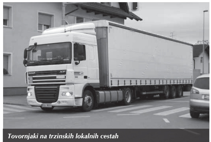
Tovornjaki na trzinskih lokalnih cestah

ki nastajajo zaradi neurejenosti brežin in vodotokov, za ostalo pa je odgovorna Republiška vodna skupnost. Ampak v času krize, ko država nima dovolj denarja za manjše posege, lahko tudi Občina ukrepa tako, da nameni sredstva za ureditev Pšate iz svojega proračuna; zaradi tega pa zagotovo ne bo pod drobnogledom protikorupcijske komisije. V Pšati še vedno leži manjše drevo (pri Kraljevem mostu), potok je še vedno neočiščen, kar pa je najbolj katastrofalno, je to, da je desni breg Pšate, na katerem so pašniki, v delu od Kraljevega mosta nizvodno, višji od levega brega, ki je naseljen. Kaj se bo zgodilo v naslednjih dneh, saj nam, ko to pišem, v našem okolju meteorologi zaradi poplavne ogroženosti obljublajo oranžni alarm, ali ob katerem od naslednjih večjih deževij? Se vam to zdi prav, občinski svetniki Občine Trzin? Se vam zdi prav, da prebivalci starega dela Trzina ob vsakem večjem dežju s strahom čakamo na poplave. Se vam zdi prav, da gradimo v Trzinu objekte, ki stanejo skupaj preko milijon evrov, medtem pa pozabljamo na varnost občanov, ki so vas z dobrimi nameni volili? Kaj mislite, da bo na naslednjih volitvah?