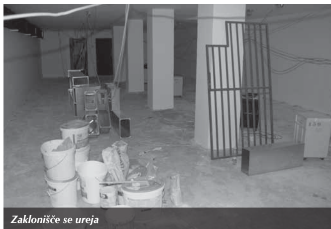
Zaklonišče se ureja

Se je pa v času krompirjevih počitnic v šoli marsikaj dogajalo. Opravili so kar nekaj vzdrževalnih del: zamenjali so varnostne mreže na oknih telovadnice, ker stare niso bile več primerne, v zaklonišču šole pa so urejali prostore za Strelsko društvo Trzin. Ureditev je organizirala Občina Trzin. POHVALNO! Naši otroci bodo prišli v urejeno in lepo šolo, lahko se bodo vključili v strelsko društvo in