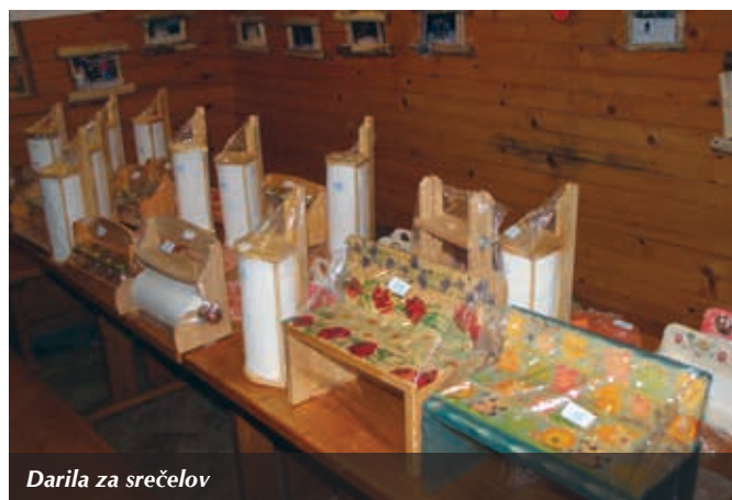
Darila za srečelov