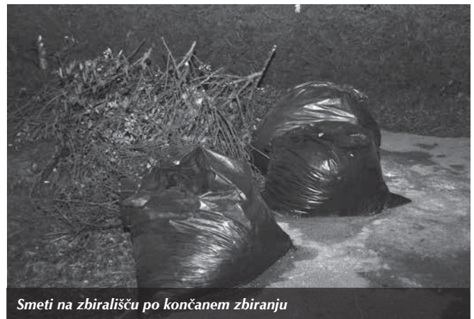
Smeti na zbirališču po končanem zbiranju

Ne morem si kaj, da se ne bi spet lotil tudi teme, ki je bila že večkrat na vrsti. To je neurejenost Pšate nizvodno od Kraljevega do Habatovega mostu. Nazadnje ko sem zahteval od Občine Trzin, da zagotovi poplavno varnost na tem delu, so mi odgovorili, da ne smejo, ker je za to odgovorna Republiška vodna skupnost, in da bodo prijavljeni komisiji za korupcijo. Vendar to ni res! Z Agencije RS za okolje - Oddelek za območje srednje Save, so odgovorili, da so za očiščene bregove Pšate odgovorni tudi lastniki zemljišč ob potoku. Občina ima predvsem nalogo obveščanja na nevarnosti,