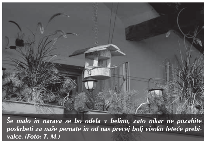
Še malo in narava se bo odela v belino, zato nikar ne pozabite poskrbeti za naše pernate in od nas precej bolj visoko leteče prebivalce.

Ampak ne smemo preveč godrnjati, nekaj se je vendarle premaknilo, saj so blizu gasilskega doma v začetku listopada zabrneli stroji, ki bodo ozaljšali jugovzhodno stran Ljubljanske ceste. Vse lepo in prav, a zakaj so začeli graditi v mesecu, za katerega