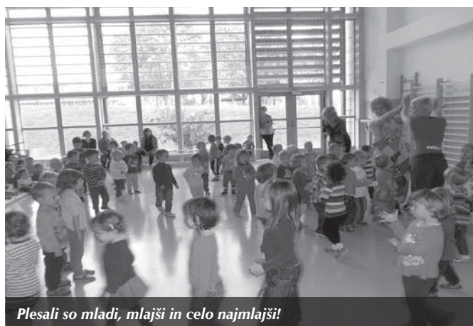
Plesali so mladi, mlajši in celo najmlajši!

s srečnim koncem (da bi bilo le vedno tako!), otroci pa so bili nad pogumnimi fanti tako navdušeni, da ga tisti dan (in še nekaj naslednjih) ni bilo malčka, ki ne bi že vedel, kaj bo, ko bo velik – gasilec!!!