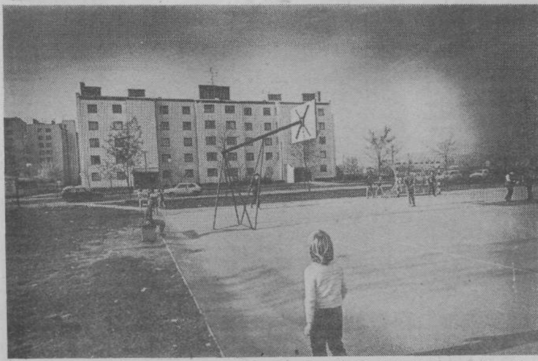
Večnamenska ploščad v stanovanjskem naselju ob Celovelandski v Novih Jaršah (Foto: Dušan G.)