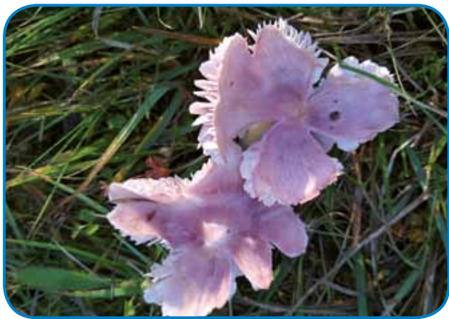
Rožnata vlačnica je rejdkost po cejlom svejti

Vlačnice so zaščitenne, vrejdnost ene gobe je 10 gezero forintov. Nejsa za gesti, užitne vrejdnosti nemajo. Rade majo kiselo zemlo pa