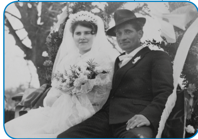
Mauž je ženin biu na borovom gostüvanji

»Nika nej prajla, ona je privolila, zato ka vsigdar tau prajla, ka si si ziskala,