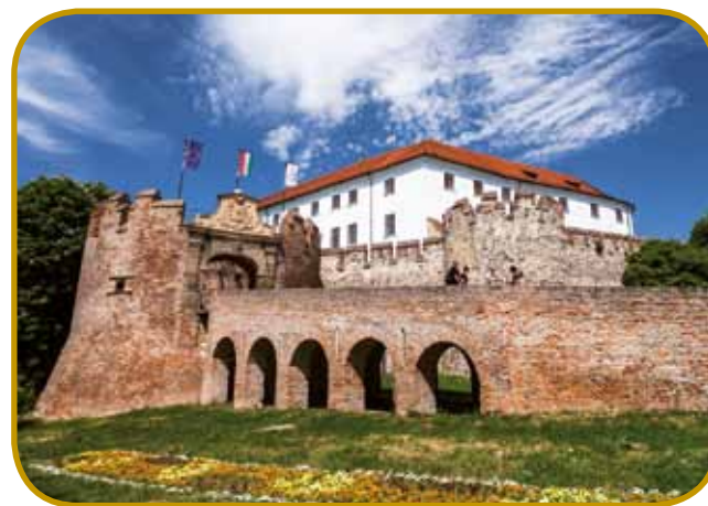
Grad v Siklósi je eden najbolje gorostali zgodovinski spomenik na Vogrskom - zidali so ga od srednjoga vōka vse do gnes

com inda svejta cupprišli eške srbski Raci in Nemci. Muzej Dorotty Kanizsai eške gnesdén nutpokaže bogato etnološko in kulturno erbo djužni Slavov, zvün noše in poištva leko tam poglednemo dosta erični »črni vrčov« s krajine tō.