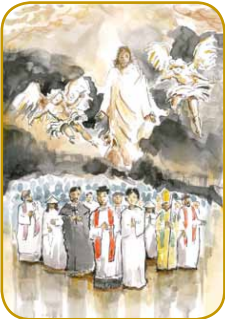
Med 117 vietnamskimi mantrnikami je bilau 8 püšpekov, 50 dühovnikov in 59 vörnükov vsefelé starosti

Po novejšom kalendari katoličanske Cerkve se 24. novembra spominamo na svete vietnamske mantrnike (vietnámi vértanúk). Té ažijski rosag naj-