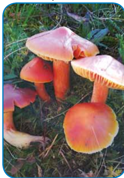
Vlačnice so zaščitenne, vrejdnost ene gobe je 10 gezero forintov

jo k našoj krajini kak zaščitenne rastline. Škoda bi bilau, če bi preminile.