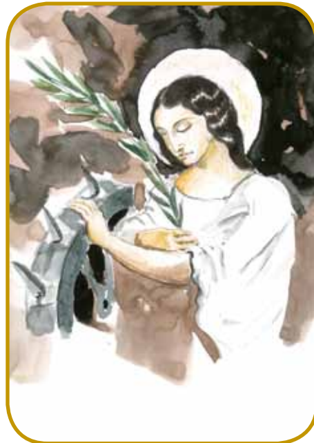
Sveto Katarino Aleksandrijsko malajo s potačom, na šterim so ostrí naužci – té se je strau na male falate, zatok so svetnici krajsekli glavau

Sveto Katarino Aleksandrijsko čestijo kak patronuškinjo dejkeu in pojbinske mladine, štamparov, knižničarov, filo-