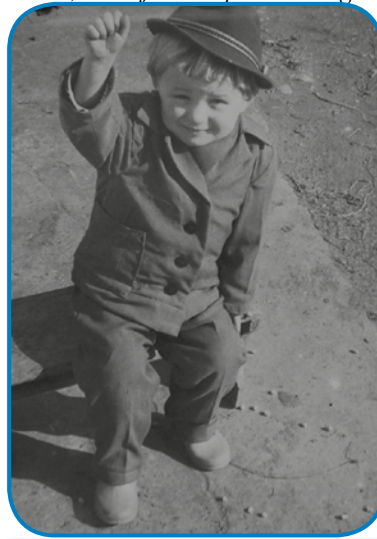
Mali Jože z lejtim kolapošom

paverskom deli, tüdi različne lidi sam predstavlo, med njimi se spaumnim, ka tüdi eno žensko, stera je v cimpranom