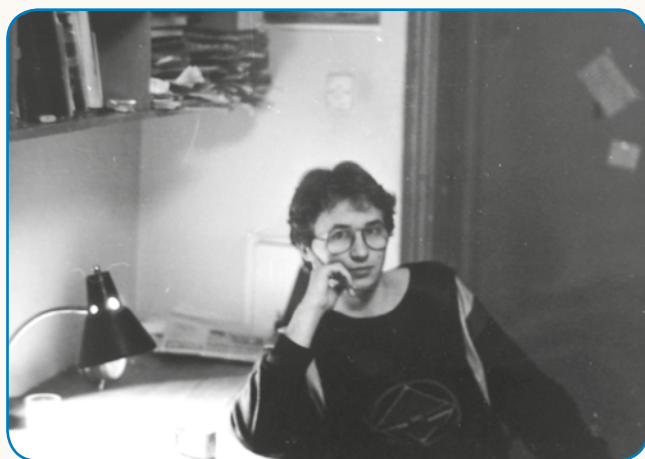
Rad ma ekstreme stran 4