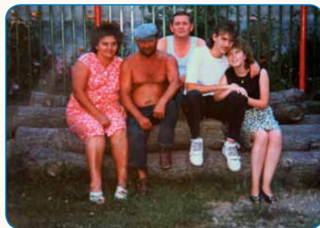
Materni dzejik ne moreš pozabiti stran 8