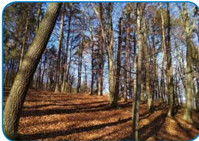
Vekšoga veseldja nega, kak geseni ojdti po lesej

Vekšoga veseldja nega, kak geseni ojdti po lesej, čüti, kak šumače süjo listje pod nogami. Bükeve, gaber, topa so že listje dolpistili, hrast je ridjavi grato. Samo borovi so zeleni, čakajo snejg. V lejsi je tišina in