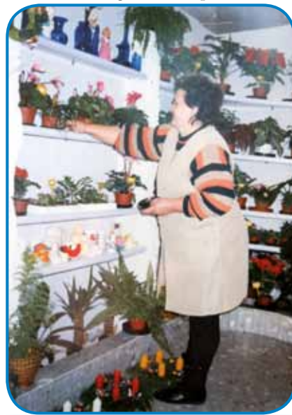
Mariš so potistim, ka so zaprli židano fabriko, delali v cvetličarni

so vüje, tam je nutra odletejla, spodkar na patej gumičizme vöftrgnila, tam pa