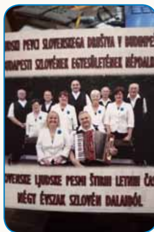
Slovenske ljudske pesmi ... stran 6