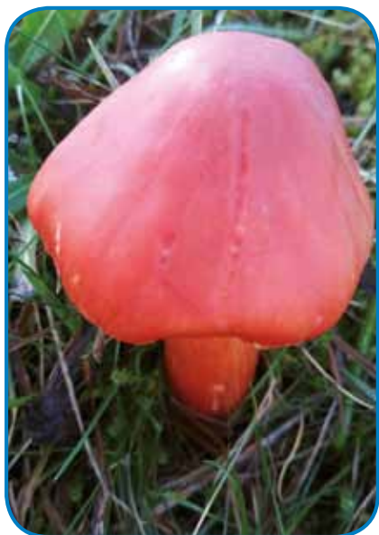
Škarlatne vlačnice majo redeči klobük, takšo formo kak zvaun

senco, takšno mesto, gde je napolnje senca. Vsigdar na gnakom mesti rastejo, zato ga volo gi naléki najdemo. Na žalost vsako leto menje