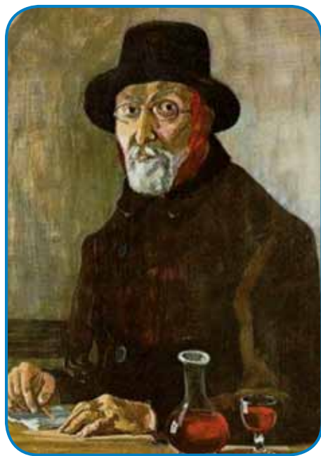
Janez Trdina, slovenski pisatelj (1830 - 1905) - Ljubljanski zvon 1881

Tak je tou. Paver je büu raztreseni pri molitvi, ranč tak kak dostakrat mi. Te se pa čüdivamo, zakoj Boug ne čüje naše prošnje.