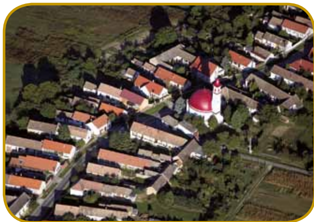
Mala baranjska vesnica Palkonya - kauli kraugle cerkve stogi 53 zavarovani zamenic, štere so postavljali od začetka 19. stoletja

V tisti vesnicaj, prej štéri se je nekda v Mohács paščo vogrski krau Lajoš II., so postavili spo-